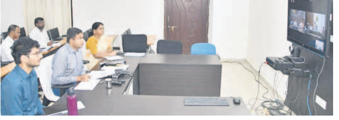
వీడియో కాన్ఫరెన్స్ లో పాల్గొన్న కలెక్టర్, అదనపు కలెక్టర్, అధికారులు

నిర్మల్ అర్బన్, ఆగస్టు 1 : ఎల్ఆర్ఎస్ ద్వారా భూముల క్రమబద్ధీకరణ చర్యలు చేపట్టాలని కలెక్టర్ అభినవ్ అధికారులను ఆదేశించారు. శనివారం ఉప ముఖ్యమంత్రి భట్టి విక్రమార్కు, రెవెన్యూ మంత్రి శ్రీనివాస రెడ్డి పురపాలన ప్రధాన కార్యదర్శి కిశోర్ కలెక్టర్లతో భూముల క్రమబద్ధీకరణపై చేపట్టాల్సిన విధి విధానాలపై సంస్థల కా ర్యాలయల్లో నోడ్యుల కేంద్రాలు, (హెల్ప్ డెస్కు)లను ఏర్పాటు చేసుకోవాలని సూచించారు. అనంతరం అధికారులతో మాట్లాడుతూ.. ప్రభుత్వ భూములను కాపాడుతూనే అనుమతి లేని లే అవుట్లపై చర్యలు తీసుకోవాలన్నారు.