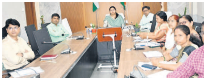
వీడియో కాన్ఫరెన్స్ లో పాల్గొన్న నిర్వహణ అధికారి, అధికారులు