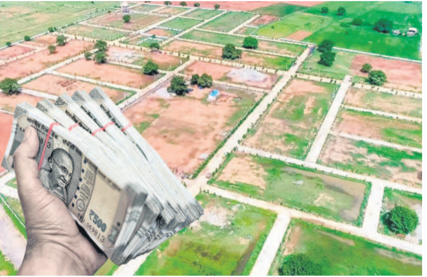
అక్కడ నిబంధనల ప్రకారం అయిపోతూ ఉంటుంది.

ఆస్టులు నివేదిత జాబితాలో ఉన్నా, కావాల్సిన డాక్యు మెంట్లు అన్నీ సమర్పించకపోయినా దరఖాస్తుదారులకు సమాచారం ఇస్తారు. రెండో దశలో వచ్చిన దరఖాస్తులను రెవెన్యూ ఇన్స్పెక్టర్, సీపీవారుల శాఖ ఏకా, టౌన్ ప్లానింగ్ సూపర్ వైజర్, పంచాయతీ అధికారుల టీమ్ ఫీల్డ్ వెరిఫికేషన్ చేస్తుంది. వారి మాత్రమే లాగి ఉన్న యాప్ లో సంబంధిత ఆఫీసర్లు, చెరువులు, కుంటలు, హెరి టేజ్ ప్రావర్షి, శిఖం, దేవాదాయ, ఇంకా భూములు, కోర్టు కేసుల్లో ఉన్నాయా లేదా పరిశీలించి అభ్యంతరాలు లేని నమోదు చేస్తారు. లెవల్-2లో అక్రమ సాధించిన దరఖాస్తులను పరిశీలిస్తారు. సంబంధిత ఫ్లాట్ లేదా లే అవుట్ను రోడ్డు ఎంత వెడల్పుతో ఉన్నాయి. మార్కెట్ ప్లాన్ ప్రకారం చేశారా లేదా, ఓపెన్ స్పేస్ ఎంత ఉంది. తదితర సాంకేతిక అంశాలను వెరిఫై చేస్తారు. ఆఫీసర్లతో ఉన్నాయని సీపీవో లేదా టీపీవో అధికారులు నిర్ధారిస్తారు. అనంతరం అవసరమైన చిత్రాలు సమర్పించడంతోపాటు ఫీజు చెల్లించాలని నోటీసులు జారీ చేస్తారు. వివిధ దశలో అన్ని రకాల అభ్యంతరాలు సాధించిన దరఖాస్తులను క్రమబద్ధీకరిస్తూ ఉత్తర్వులు జారీ చేస్తారు. మున్సిపల్ కమిషనర్లు, అర్బన్ డెవలప్ మెంట్ అథారిటీ, అదనపు కలెక్టర్లు, కలెక్టర్ స్టాఫ్ తుది నిర్ణయం వెలుపడుతుంది. క్రమబద్ధీకరించిన, రిజిస్ట్రే చేసినా సిస్టమ్లో అవి అటోమేటిక్ జనరేట్ అవుతాయి. ఇలా నాలుగు దశల్లో ఎక్కడ జరగాల్సి వచ్చి