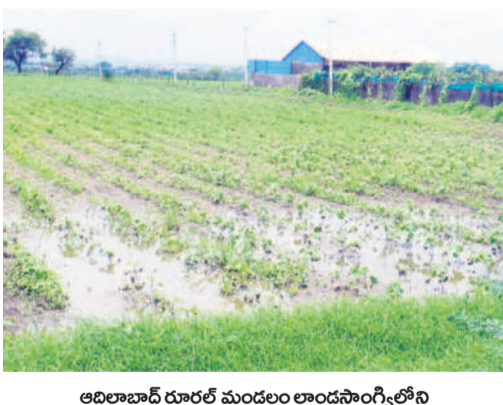
ఆదిలాబాద్ రూరల్ మండలం లాడంసాంగ్ గిల్లోని పత్తి చేలలో నిలిచిన వర్షం నీరు

ఆదిలాబాద్, ఆగస్టు 8 (నమస్తే తెలంగాణ) : ఆదిలాబాద్ జిల్లా వ్యాప్తంగా అధిక వర్షాలు అన్నదాతలను ఆందోళనకు గురి చేస్తున్నాయి. 20 రోజులుగా కురుస్తున్న వర్షాల కారణంగా పంటలను నష్టపోవాల్సిన దుస్థితి నెలకొన్నది. ఏకదాటిగా కురుస్తున్న వర్షాల కారణంగా పంటల ఎదుగుదల నిలిచిందని, దిగుబడిపై ప్రభావం పడుతున్నదని రైతులు ఆందోళన చెందుతున్నారు. ఆదిలాబాద్ జిల్లా వ్యాప్తంగా వానకాలంలో 5.20 లక్షల ఎకరాల్లో వివిధ పంటలు సాగువుతున్నాయి. ఇందులో అధికంగా పత్తి, సోయా, కంది వేశారు. జూన్ మొదటి, రెండో వారంలో విత్తనాలు వేయగా వర్షాలు పడడంతో పంటల ఎదుగుదల బాగా కనిపించింది. దీంతో రైతులు సాగుపై ఆశలు పెట్టుకున్నారు. కాగా.. మూడు వారాలుగా కురుస్తున్న వానలు రైతుల పొలిట శాపంగా మారాయి. అధిక వానల వల్ల చేలలో నీరు నిలిచి, పంటల ఎదుగుదల నిలిచిందని రైతులు ఆవేదన చెందుతున్నారు. ఎండ కాకుండా పడడం, వాతావరణం చల్లగా ఉండడం వల్ల సాగుపై ప్రభావం చూపుతున్నదని అన్నదాతలు అంటున్నారు.