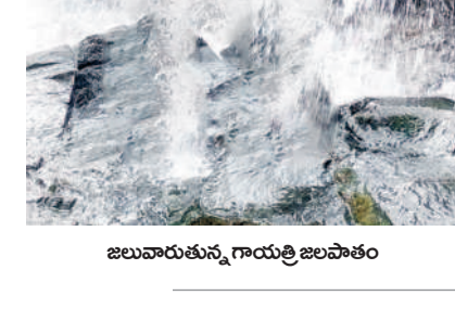
జలువారుతున్న గాయత్రి జలపాతం

ఆదిలాబాద్ జిల్లా ఇచ్చోడ మండలంలోని గాయత్రి జలపాతానికి జలకళ సంతరించుకున్నది. ఎడతెరిపి లేకుండా కురిసిన వర్షాల వాగులు, చెరువులు, కుంటలు, జలపాతాలు పొంగి పొర్లుతున్నాయి. గాయత్రి జలపాతం వరభు తొక్కుతున్నది. ఈ జలపాతం 350 అడుగుల ఎత్తు నుంచి నీరు జాలువారుతుండడంతో వరల్డ్ లాంటి రాపెల్లింగ్ పోటీలకు అనుకూలంగా ఉంది. ఆదిలాబాద్ పోలీస్ ఠాణ్, ఆగస్టు 3