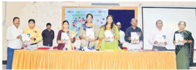
బుక్ రిలీజ్ చేస్తున్న వీసీ ఖుష్కా గుప్తా, అధికారులు