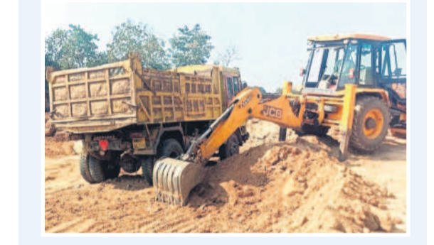
సింగంపల్లి-బినాపూర్ శివారులో మొరం తీస్తున్న పోక్లయిన

మాక్లూర్, ఆగస్టు 3: మాక్లూర్ మండలంలో మొరం అక్రమ తవ్వకాల వ్యాపారం మూడు పువ్వులు.. ఆరు కాయలుగా నడుస్తున్నది. అనుమతి లేకుండా రాత్రివేళలో జిల్లా కేంద్రానికి మొరం తరలిస్తూ అక్రమార్కులు సొమ్ము చేసుకుంటున్నారు. మాదాపూర్, మాక్లూర్, బినాపూర్, సింగంపల్లి, దాసినగర్, మామిడిపల్లి తదితర గ్రామాల్లో మొరం మాఫియా ఆగడాలకు అంతరేదేదు. దీంతో గుట్టలు మాయమై పచ్చని ప్రకృతి అగ్రహారంగా మారుతున్నది. మాదాపూర్లోని తహసీల్ కార్యాలయం, పోలీస్ స్టేషన్లకు కూతవేయి దూరంలోనే ఈ తతంగమంతా నడుస్తున్నా పట్టించుకునే నాడుడే కరువయ్యాడు. ఎవరైనా ఫిర్యాదు చేస్తే తూతూ మంత్రంగా జరిమానా విధిస్తూ అధికారులు చేతులు దులుపుకోంటున్నారని మండల ప్రజలు ఆరోపిస్తున్నారు. అక్రమ మొరం తరలింపుపై తహసీల్దార్ పట్టిన నవ వివరణ కోరగా అనుమతులు లేకుండా మొరం తరలిస్తే వాహనాలను సీజ్ చేసి కేసు నమోదు చేస్తుమని, ప్రభుత్వ ఆదాయానికి గండికొడుతున్న వారిని ఉపేక్షించేది లేదన్నారు.