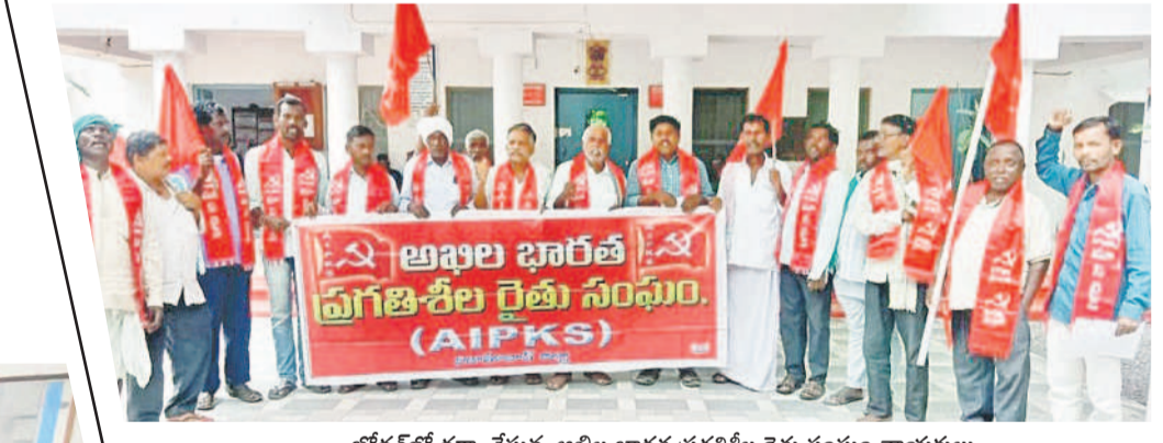
బోధన్ లో ధర్మా చేస్తున్న అఖిల భారత ప్రగతిశీల రైతు సంఘం నాయకులు