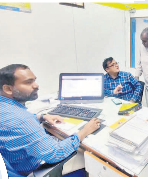
ఎడవల్లిలో కెనరా బ్యాంకు మేనేజర్లను ప్రశ్నిస్తున్న రైతులు

రుణమాఫీ ప్రక్రియలో చిత్ర విచిత్రాలెన్నో వెలుగులోకి వస్తున్నాయి. ప్రభుత్వ ప్రకటనలకు భిన్నంగా క్షేత్ర స్థాయిలో పరిస్థితులు కనిపిస్తున్నాయి. రూ. లక్షన్నర లోపు పంట రుణాలన్నీ మాఫీ చేశామని కాంగ్రెస్ సర్కారు గొప్పగా ప్రకటించింది. కానీ, ఉమ్మడి జిల్లాలో బయట పడుతున్న ఉదంతాలు ప్రభుత్వ టాల్కన్లన్నీ తగ్గకు కడుతున్నాయి. రూ. 63 వేల రుణం తీసుకున్న ఓ రైతుకు ఒక్క రూపాయి మాఫీ కావడం.. సర్కారు పనితీరుకు అర్థం పడుతున్నది. అంతేకాదు, ప్రభుత్వ మార్గదర్శకాల ప్రకారం వేలాది మంది అర్హులైన రైతులకు మాఫీ పద్ధింపకుండా పోయింది. రూ. లక్షన్నర కాదు కదా, రూ. 50 వేల లోపు ఉన్న ఎంతో మంది రైతుల రుణాలు మాఫీ కాలేదు. ప్రామాణికంగా అర్హుల జాబితాల దాఖలు చేయక పోవడం, మార్గదర్శకాల పేరిట కొర్రలు విధించడంతో వేలాది మందికి ప్రభుత్వ ప్రయోజనం దక్కకుండా పోయింది. దీంతో ఆవేదనకు గురవుతున్న రైతులు అక్కడక్కడ ఆందోళనలకు దిగుతున్నారు.