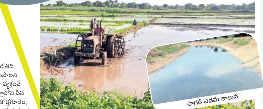
సాగర్ ఎడమ కాలువ

ప్రాజెక్టును నిర్మించిన న్నారు. ప్రస్తుత మంత్రులు మైదాన ప్రాంతాల్లోని తమ నియోజకవర్గాల రైతాంగానికి నీరందించేందుకు ప్రయత్నాలు చేస్తూ భద్రాద్రి జిల్లా రైతులకు అన్యాయం చేయాలని చూస్తున్నారని మండిపడ్డారు. ఈ ప్రాజెక్టు నిర్మాణ సమయంలో ఆదనంగా నీరుల కోసం రూ.800 కోట్ల వరకు ప్రతిపాదనలు పంపామని, అందులో హెచ్చింపు కోసం రూ.25 కోట్లు అప్పటి బీఆర్ఎస్ ప్రభుత్వం మంజూరు చేసిందని, ఆ పనులను ప్రస్తుత కాంగ్రెస్ ప్రభుత్వం పూర్తిగా నిలిపివేసిందన్నారు. అంతేకాకుండా సీతారామ సాగర్ కాలువ, ఎన్ఎస్పీ కాలువకు మధ్యలో లింక్ తెనాలి మంజూరు చేసిందని, దీనిని పూర్తి చేసి లక్ష ఎకరాల్లో గోదావరి నీటిని ఖమ్మం జిల్లాలోని