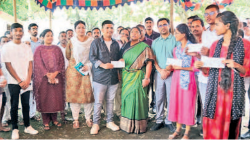
విద్యార్థులకు చెక్కులను అందిస్తున్న సీతక్క