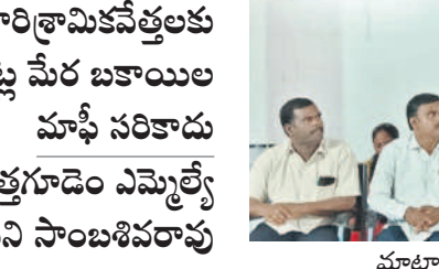
మాట్లాడుతున్న ఎమ్మెల్యే కూననేని సాంబశివరావు

బడా పారిశ్రామికవేత్తలకు రూ.కోట్ల మేర బకాయిల మాఫీ సరికాదు కొత్తగూడెం ఎమ్మెల్యే కూననేని సాంబశివరావు