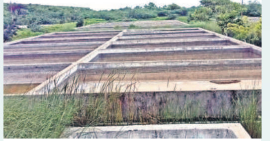
వాచంపాడిలో నూతనంగా నిర్మించిన నర్సరీలు

మోరార్జీ, ఆగస్టు 4: రాష్ట్రంలోనే సంబరవేసే కామారెడ్డిలోని జాతీయ చేపపిల్లల ఉత్పత్తి కేంద్రం జాతీయ చేపపిల్లల ఉత్పత్తి కేంద్రంగా మారింది. ప్రభుత్వం ఏటా చేపపిల్లల ఉత్పత్తికి ఏప్రిల్-మే నెలల్లోనే నిధులను విడుదల చేసేది. దీంతో పనులు మేడగా ప్రారంభమై సమయానికి చేపపిల్లలను ఉత్పత్తి చేసి మత్స్యశాఖలకు పంపిణీ చేసేవారు. కానీ ఈసారి నిధులు విడుదల కాకపోవడం కోపనీయం. ఏప్రిల్-మే నెలల్లో తల్లి చేపలను కొనుగోలు చేసి జూలైలో మొదటివారంలో చేపపిల్లల ఉత్పత్తి ప్రక్రియను ప్రారంభించారు. ఆగస్టు నెల ప్రారంభమైనా చేపపిల్లల ఉత్పత్తి ప్రక్రియ ప్రారంభం కాకపోవడం వలన అనుమానాలు రేకెత్తుతున్నాయి.