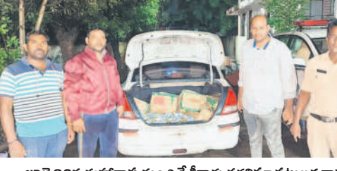
జూలై 20న మహారాష్ట్ర నుంచి దేశీయ తరలివచ్చిన పట్టుబట్ట వాహనం