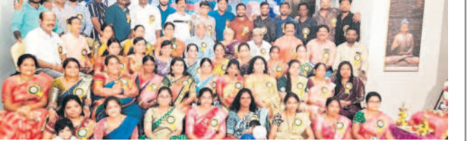
మంచిర్యాల: అపూర్వ సమ్మేళనంలో పాల్గొన్న ఉపాధ్యాయులు, విద్యార్థులు

మంచిర్యాల ఆర్ట్స్/మందమల్లె/తాండూర్, ఆగస్టు 4 : జిల్లాలో పలుచోట్ల అధికారం అపూర్వ సమ్మేళనాలు నిర్వహించారు. నన్నూర్లోని శ్రీ సర్వస్వ శివ మందిరంలో 2002-03లో పదో తరగతి చదివిన విద్యార్థులు మంచిర్యాల పట్టణంలోని ఓ ఫంక్షన్ హాల్లో, మందమల్లె పట్టణంలోని శ్రీరాఘవేంద్ర ఉన్నతపాఠశాలకు చెందిన 2001-02 పదో తరగతి బ్యాచ్, తాండూర్ మండల కేంద్రంలోని శ్రీవాణిసేకేతన్ పాఠశాలలో 2002-2003కు చెందిన పదో తరగతి బ్యాచ్ విద్యార్థులు అపూర్వ సమ్మేళనాలు నిర్వహించారు. ప్రొడెమ్మి దే నాడు అందరూ ఒకేబోల చేరి.. ఒకరినొకరు ఆత్మీయంగా పలకరించుకున్నారు. ఆ నాటి