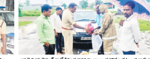
జూలై 21న జైనుర్ కాలేజీగూడ దగ్గర గంజాయి తరలివచ్చిన పట్టుబట్ట వాహనం

కుమ్రం టీం ఆసిఫాబాద్, ఆగస్టు 4 (నమస్తే తెలంగాణ) : జిల్లాలో జోరుగా అక్రమ దందా సాగుతున్నది. కొందరు వ్యాపారులు మహారాష్ట్ర నుంచి చెక్ పోస్టులను దాటుకొని పశువులు, దేశీయ, గంజాయి, గుట్టాపంటి యధేచ్ఛగా సరఫరా చేస్తూ అందినకాడికి దండంతున్నట్లు తెలుస్తున్నది. వారికి సరిహద్దులోని వెక్స్ పోస్టును దాటుకొని నిషేధిత వస్తువులు తీసుకొచ్చే వాహనాలు జిల్లాలోకి ఎలా ప్రవేశిస్తున్నాయోనే ప్రశ్నార్థకంగా మారుతున్నది. అయితే, చెక్ పోస్టు సిబ్బంది కాసుల కోసం కచ్చర్ల పడి చూచాలను తనిఖీ చేయకుండానే వదిలేస్తున్నట్లు ఆరోపణలు వెల్లవెత్తుతున్నాయి. ఇటీవల జరిగిన పలు ఘటనలను చూస్తే ఆ ఆరోపణలకు బలం చేకూరుతున్నది. ఇటీవల పోలీసులు నిఘా గుట్టా, దేశీయ, గంజాయి, పశువులను పట్టుకొని పలుపురిపై కేసులు నమోదు చేశారు.