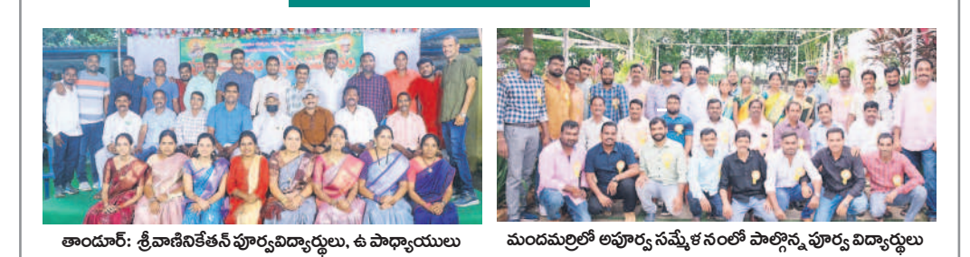
తాండూర్: శ్రీవాణిసేకేతన్ పూర్వవిద్యార్థులు, ఉపాధ్యాయులు మందమల్లెలో అపూర్వ సమ్మేళనంలో పాల్గొన్న పూర్వ విద్యార్థులు

మంచిర్యాల ఆర్ట్స్/మందమల్లె/తాండూర్, ఆగస్టు 4 : జిల్లాలో పలుచోట్ల అధికారం అపూర్వ సమ్మేళనాలు నిర్వహించారు. నన్నూర్లోని శ్రీ సర్వస్వ శివ మందిరంలో 2002-03లో పదో తరగతి చదివిన విద్యార్థులు మంచిర్యాల పట్టణంలోని ఓ ఫంక్షన్ హాల్లో, మందమల్లె పట్టణంలోని శ్రీరాఘవేంద్ర ఉన్నతపాఠశాలకు చెందిన 2001-02 పదో తరగతి బ్యాచ్, తాండూర్ మండల కేంద్రంలోని శ్రీవాణిసేకేతన్ పాఠశాలలో 2002-2003కు చెందిన పదో తరగతి బ్యాచ్ విద్యార్థులు అపూర్వ సమ్మేళనాలు నిర్వహించారు. ప్రొడెమ్మి దే నాడు అందరూ ఒకేబోల చేరి.. ఒకరినొకరు ఆత్మీయంగా పలకరించుకున్నారు. ఆ నాటి