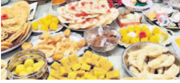
కాళికాదేవికి సాచిన సమర్పించిన భక్తులు

కూడా శ్రావణమే.. శ్రీకృష్ణుడు అవతరించినది శ్రావణమాసంలోనే.. బలిచక్రవర్తికి పట్టాభిషేకం జరిగిన మాసం.. భక్తిమూర్తి శ్రీమదాదిత్య మొదటి.. శ్రవణ నక్షత్రానికి అధిపతి శివుడు ఈ మాసంలో శ్రీమహావిష్ణువుని పూజిస్తాడని ప్రతీతి. అందుకే శ్రావణ మాసానికి ఇంకటి ప్రత్యేకత సంబంధించి కుంది. శ్రావణ మాసంలో వచ్చే ప్రతీరోజు ఎంతో విశిష్టత ఉంది. ఎందుకంటే ఈ మాసాంతం శ్రవణ నక్షత్రం ఉండటమే కారణమని పండితులు చెప్పున్నారు. మాసాంతం స్వామిని, అమ్మవారిని కొలిస్తే సకల పాపాలు తొలుగుతాయని పండితులు చెబుతున్నారు. శ్రావణ మాసం వర్షంతువతోపాటు పండుగలను తీసుకొస్తోంది. ఈ మాసంలో వచ్చినప్పుడు పండుగలు ఏ మాసంలో రావు. అందుకే ఈ మాసాన్ని పండుగ మాసం అని కూడా అంటారు. నాగుల పంచమి.. శ్రావణ శుద్ధ చవితి, పంచమి రోజున నాగులవ వితి, పంచమిని జరుపుకుంటారు. ఈ రెండు రోజులతోపాటు, శ్రావణ మాసంలో వచ్చే శనివారాల్లో పెద్దలు, పిల్లలు పుట్టలేని పావు పానీ భక్తిశ్రద్ధలతో నమస్కరిస్తారు. నాగముద్దికలను సమర్పించుకుంటారు. ఇలా వేస్తే సర్వదోషాలు, సర్వదోషాలు తొలగిపోతాయని భక్తుల విశ్వాసం. శ్రావణ పూర్ణిమ.. శ్రావణ మాసంలో వచ్చే పూర్ణిమనే శ్రావణ పూర్ణిమ అంటారు. అలాగే రక్షా బంధన, జం