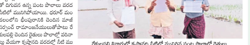
రేకులపల్లి శివారావు కృష్ణానది నీటిలో మునిగిన పంట పొలాల్లో రైతులు

ధరూరు, ఆగస్టు 4 : కృష్ణానదికి వరద పోవడంతో జూరాల ప్రాజెక్టు నిండుకుండా తలపిస్తున్నది. ఎగువ నుంచి భారీగా వరద వస్తుండడంతో వచ్చిన నీటిని వచ్చినట్లే దీగవకు విడుదల చేస్తుండడంతో దిగువ ఉన్న పంట పొలాలు వరద నీటితో మునిగిపోయాయి. ధరూరు మండలంలోని తీరప్రాంత ప్రాంతాలలోని పంట పొలాలు వరద నీటితో మునిగిపోయాయి. ధరూరు మండలంలోని తీరప్రాంత ప్రాంతాలలోని పంట పొలాలు వరద నీటితో మునిగిపోయాయి.