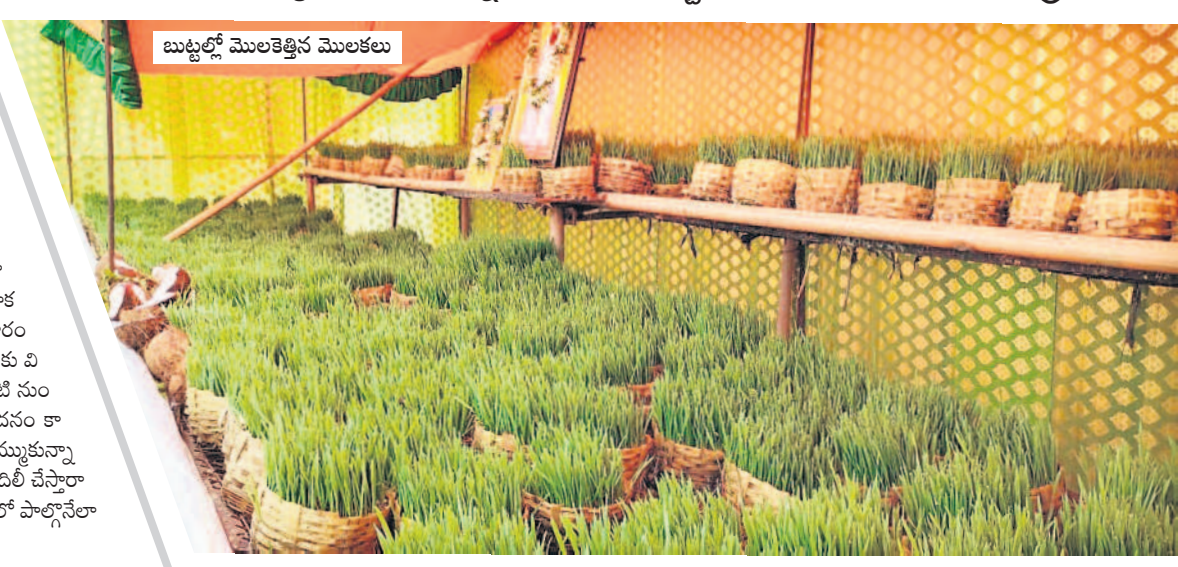
బుట్టిలో మొలకెత్తిన మొలకలు

9రోజులపాటు ప్రత్యేక ఉపసానాలు గిరిజన తండాలు, గ్రామాల్లో నెలకొన్న సందడి ముట్టిని, మొలకలను పూజించే గిరిపుత్రుల పండుగ