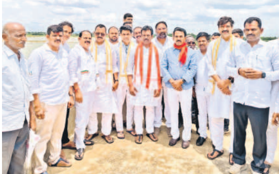
సరళాసాగర్ వద్ద మంత్రి జూపల్లి కృష్ణారావు, ఎమ్మెల్యేలు