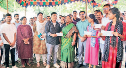
విద్యార్థులకు చెక్కులను అందిస్తున్న సీతక్క