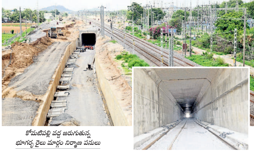
కోమటిపల్లి వద్ద జరుగుతున్న భూగర్భ రైలు మార్గం నిర్మాణ పనులు