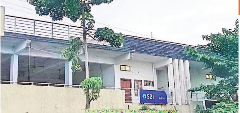
చెన్నారావుపేట ప్రాథమిక వ్యవసాయ సహకార సంఘం కార్యాలయం