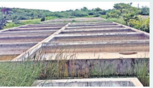
పోచంపాడలో నూతనంగా నిర్మించిన నర్సరీలు

మోర్రాడ్, ఆగస్టు 4: రాష్ట్రంలోనే సంబరవేసినా ఉన్న మొదటిరా మండలం పోచంపాడలోని జాతీయ చేపపిల్లల ఉత్పత్తి కేంద్రం జాతీయ దయనియంగా మారింది. ప్రభుత్వం ఏటా చేపపిల్లల ఉత్పత్తికి ఏటా-మే నెలల్లోనే నిధులను విడుదల చేసేది. దీంతో పనులు వేగంగా ప్రారంభమై సమయానికి చేపపిల్లలను ఉత్పత్తి చేసి మత్స్యకారులకు సుపలీటీ చేసేవారు. కానీ ఈసారి నిధులు విడుదల కాకపోవడం కోవ నీయం. ఏప్రిల్-మే నెలల్లో తల్లి చేపలను కొనుగోలు చేసి జూలైలో మొదటివారంలో చేపపిల్లల ఉత్పత్తి ప్రక్రియను ప్రారంభించారు. ఆగస్టు నెల ప్రారంభమైనా చేపపిల్లల ఉత్పత్తి ప్రక్రియ ప్రారంభం కాకపోవడం వలన అనుమానాలు రేకెత్తుతున్నాయి.