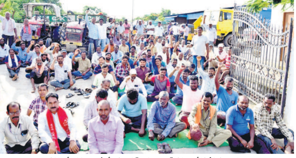
నగరంలోని సస్యగిరికాలనీలోని మున్సిపల్ వాహనాల షెడ్ వద్ద అందోళ్లన చేస్తున్న కార్యక్రమం