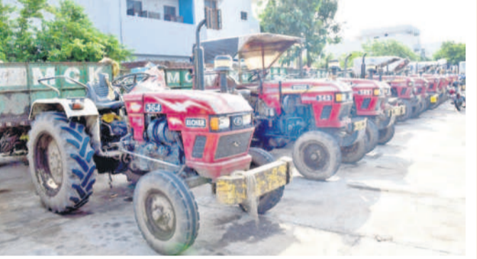
షెడల్లోని నిలిచి ఉంచిన ట్రాక్టర్లు