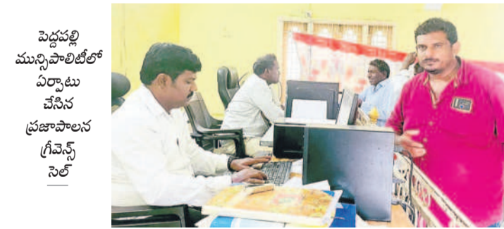
పెద్దపల్లి మున్సిపాలిటీలో ఏర్పాటు చేసిన ప్రజాపాలన గ్రీవెన్స్ సెల్

పెద్దపల్లి, ఆగస్టు 5 (సమస్య తెలంగాణ): ప్రజాపాలనలో గ్యారెంటీలు కోసం ప్రభుత్వం గతేడాది డిసెంబర్, జనవరి మొదట్లో ప్రజాపాలన పేరిట ఆరు రోజుల పాటు దరఖాస్తులు స్వీకరించింది. పెద్దపల్లి జిల్లాలోని 13 మండలాలూ, ఒక కార్పొరేషన్, మూడు మున్సిపాలిటీల నుంచి మొత్తంగా 2,40,667 దరఖాస్తులు అందాయి. ఆ తర్వాత తిరిగి ప్రజాపాలన దరఖాస్తు కేంద్రాలను ఏర్పాటు చేసి గ్యారెంటీ సర్ప్లై, ఉచిత విద్యుత్ కోసం 23,396 దరఖాస్తులను పరిశీలించి గ్యారెంటీ అకౌంట్ నంబర్లను, విద్యుత్ యూనిట్ నంబర్లను సరిచేశారు. ఇవి తప్ప ఇతర దరఖాస్తులన్నీ బుట్టరాణాలయ్యాయనే విమర్శలు ఉన్నాయి. మహాశక్తి పథకంలో మహిళలకు ప్రతి నిలూ ₹2500 జీవన భృతి కోసం 19,971 మంది, ఒక కార్పొరేషన్, 15 మండల ప్రజాపాలనలో 88,011 మంది రైతులు, 11,374 మంది కౌలు రైతులు, రైతు కులీలకు ఏడాదికి ₹12వేల సాయం కోసం 1,02,364 మంది, గృహాశక్తి పథకం కింద ఇంట్ల కోసం 1,85,404 మంది, 250 గజాల ఇంటి స్థలం కోసం 403 మంది అమరవీరులు కుటుంబాలూ, 2707 మంది ఉద్యోగి కుటుంబాలూ, చేయూత పథకం కింద సాయం 6979 మంది, ఇతర పన్నెత్త కోసం 49,552, కొత్త చేపనీ కాళ్లకు సంబంధించి 15,670 మంది చేసుకున్న దరఖాస్తులన్నీ పెండింగ్లోనే ఉన్నాయి. కాళ్ల గిలా తిరిగినా ఫలితం శూన్యం