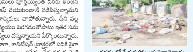
నగరంలో పేరుకపోయిన చెత్తావదారం

కరీంనగర్ కార్పొరేషన్, ఆగస్టు 5 : కరీంనగర్ నగరపాలక సంస్థలో పారిశుధ్య ట్యాంక్ షానింగ్, నీటి సరఫరా విభాగంలో వివిధ పనుల కోసం ట్రాక్టర్లను వినియోగిస్తున్నారు. పారిశుధ్య విభాగంలో ట్రాక్టర్లు 48, జేసీబీలు 3, హరితహారం కోసం 8, నీటి సరఫరాకు 7, ఫాంగికు రెండు, ల్యాండ్రీకు ఒకటి వాడుతున్నారు. అందులో నీటి సరఫరా కోసం హై లెవెల్లో నాలుగు, లో లెవెల్లో నాలుగు ట్రాక్టర్లు ఉపయోగిస్తున్నారు. కాగా అత్యధికగా వాహనాలకు మరమ్మతులు లేకుండా పోతున్నాయి. ముఖ్యంగా ప్రతి రోజూ ఆయా డివిజన్ల నుంచి చెత్తను తీసుకపోయే ట్రాక్టర్లలో ఎక్కువ వాహనాలకు రిపేర్లు కరువయ్యాయి. పలు ట్రాక్టర్లకు సెల్ఫ్ లేకపోవడంతో ఉదయం ప్రారంభిస్తే పనులు పూర్తయ్యేంత వరకు ఇంజనీ ఆఫ్ చేయకుండానే సడపిస్తున్నామని కార్మికులు వాపోతున్నారు. దీని వల్ల వ్యయం పెరగడంతోపాటు ఇతర సమస్యలు వస్తున్నాయని పేర్కొంటున్నారు. కాగా, కానీట్వన్ ట్రాక్టర్లలో పడికి పెట్టిన వాహనాలు రిపేర్లు లేక చక్కన పట్టి నట్లు కార్పొరేటర్లు చెబుతున్నారు.