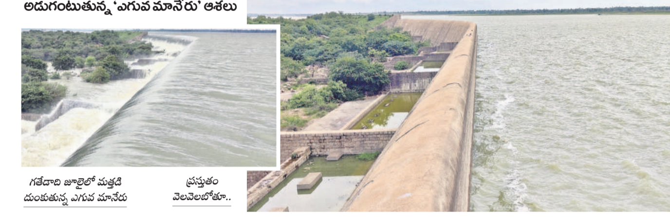
అడుగంటుతున్న 'ఎగువ మానేరు' ఆశకు ప్రస్తుతం వెలవెలబోతూ..

కాలం కాకపోవడం.. పరద రాకపోవడం.. కాశేశ్వరం జలాలను సర్కారు ఎత్తిపోయక పోవడంతో ఎగువ మానేరు ప్రాజెక్టులో నీళ్లు అడుగంటాయి. గతేడాది పరకు నిండుకుండను తలపించిన ఈ జలాలయంలో ఇప్పుడు నాలుగో పంపు కూడా నీళ్లు లేకపోవడం.. పోసిన నార్లు ముదిరిపోతుండడంతో రైతులకు కన్నీళ్లు మిగులుతున్నాయి. తరలివచ్చిన గోదావరి జలాలతో గత మూడేళ్లు మత్తడి దుంకగా, ఈసారి వానకాలం ప్రారంభమై రెండు నెలలు గడిచినా చక్క నీరు రాక వెలవెలబోతున్నది.