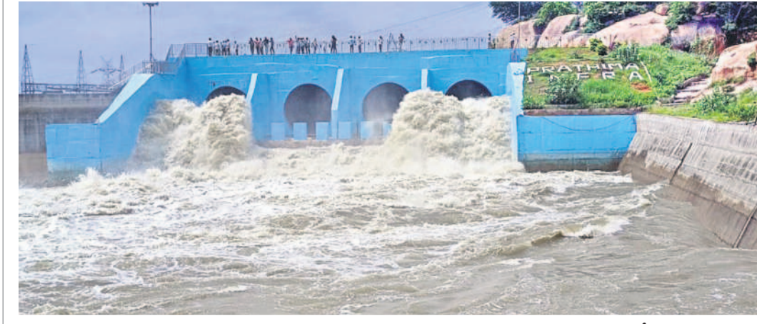
సిరిసిల్లా జిల్లా ఇల్లంకలకుంట్ల మండలం తిప్పాపూర్ పంచాయతీ డెలివరీ సిస్టమ్ నుంచి బయటికివేయబడుతున్న గోదాల జలాలు