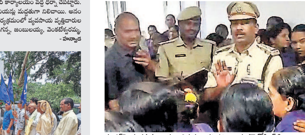
సూపర్ వైజర్లు తమను బూతులు తిడుతున్నారని నవీబాలయ హోటెలింగ్ నిబంధన, స్టీవర్లు సోమవారం అందోళనకు దిగారు. గ్రౌండ్ ఫ్లోర్లో టైలాయిని నిరసన తెలిపారు. పోలీసులు వారికి స్పృశ్యం చేయడం ప్రయత్నించారు. కొందరిని బీస్ సెక్యూరిటీ ఆఫీసర్ల (సీఎస్ఎస్) దగ్గరికి తీసుకెళ్లి మాట్లాడించారు. - సెక్టోరియల్