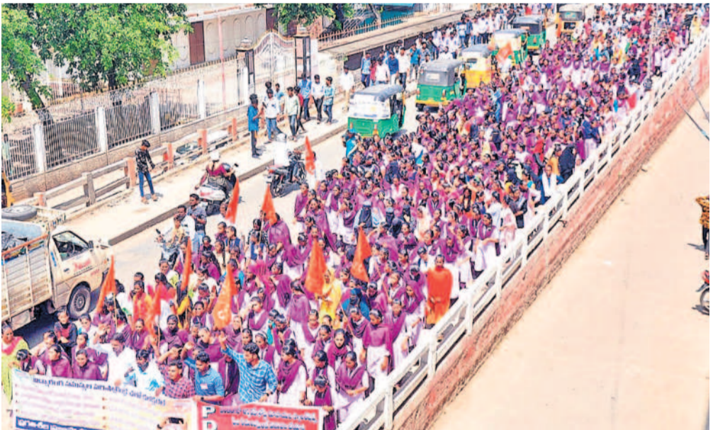
విద్యారంగం సమస్యలను పరిష్కరించాలని డిమాండ్ చేస్తూ ఖమ్మంలోని కాల్యాప్త నుంచి ట్రాఫిక్ పోలీసుస్టేషన్ వరకు పీడీఎస్ యూ ఆధ్వర్యంలో నిరసన చేపట్టారు. అనంతరం నాయకులు అదనపు కలెక్టర్ మధుసూదన్ కు విసతిపత్రం అందించారు. -ఖమ్మం ఎయ్ టెఫ్