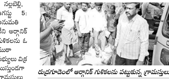
రుద్రగూడెంలో ఆర్డర్లీ గుళికలను పట్టుకున్న గ్రామస్తులు

పట్టుకొని పోలీసులకు అప్పగించిన గ్రామస్తులు