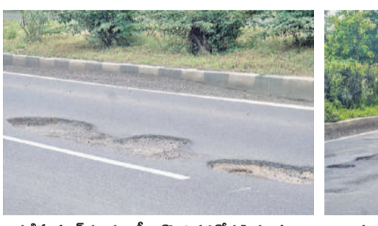
గుడిహత్నూర్ మండలం సీతాగిరి వద్ద రోడ్లపై గుంతలు

వరుసల రహదారి కావడంతో వాహనాలు వేగంగా పోతుంటాయి. రోడ్లపై ఉన్న గుంతలను తప్పించడానికి డ్రైవర్లు సడన్ బ్రేకులు వేయడం, పక్కకు తిప్పడంతో ప్రమాదాలు జరుగుతున్నాయి. గుంతల్లో పడి వాహనాలు పాడవుతున్నాయి. డ్రైవర్లు అంటున్నారు. కారణం ప్రయాణించే వారు రోడ్లపై వెదికోవడంతో ఇబ్బందులు ఎదుర్కోవాల్సి వస్తున్నది. రోగులు, గర్భిణులు రహదారిపై ప్రయాణం చేయాల్సిన పరిస్థితి లేదు. గుంతలో దిగిన వాహనాల పాడవడంతోపాటు మెల్లిగా పోవాల్సి వస్తున్నది ప్రయాణికులు అంటున్నారు.