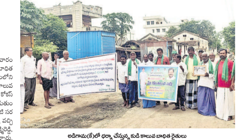
అడిగామ(కే)లో ధర్మా చేస్తున్న కుడి కాలు వ బాధిత రైతులు