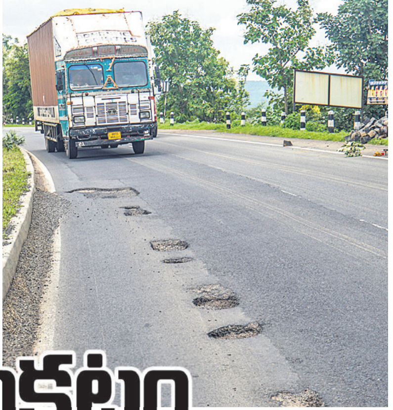
మావల సమీపంలో జాతీయ రహదారిపై గుంతల కారణంగా పక్కనుంచి వస్తున్న లారీ