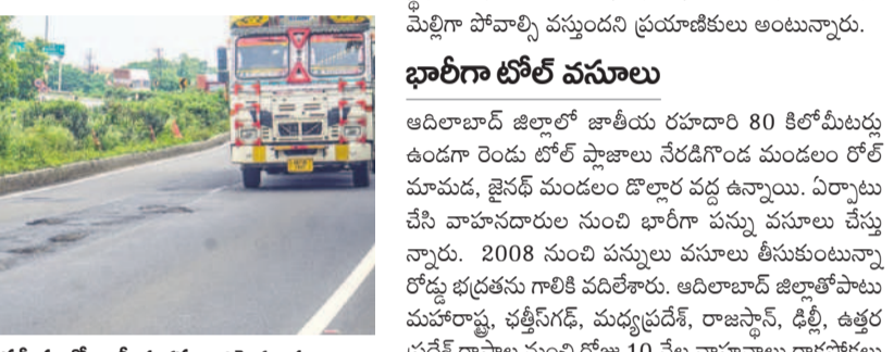
మావల సమీపంలో జాతీయ రహదారిపై గుంతలు

ఆదిలాబాద్, ఆగస్టు 6(నమస్తే తెలంగాణ) : ఆదిలాబాద్ జిల్లాలో జాతీయ రహదారి పరిస్థితి అర్ధానగంగా తయారైంది. జిల్లాలోని నేరడిగొండ మండలం రోల్ మోమడ నుంచి జైన్ల మండలం డొల్లార వరకు 80 కిలోమీటర్ల రోడ్లపై అడుగుడు గునా గుంతలు ఏర్పడ్డాయి. ఇటీవల కురిసిన వర్షాలతో రహదారిపై ప్రయాణం సరళిప్రాయంగా మారింది. ఆదిలాబాద్ జిల్లా మీదుగా ఉత్తరాది నుంచి దక్షిణాది రాష్ట్రాల వాహనాలు రాకపోకలు సాగిస్తుంటాయి. సరుకు రవాణాతో పాటు ప్రయాణికులను చేరవేస్తుంటాయి. నిత్యం వేలాది వాహనాల రాకపోకలు సాగిస్తుంటాయి. రహదారి 44 నిర్వహణను నేషనల్ హైవే అథారిటీ ఆఫ్ ఇండియా(ఎన్హెచ్ఐఐ) పరిధిలోకి వస్తుంది. రోడ్ల నిర్మాణ లోపం ఫలితంగా ఆదిలాబాద్ జిల్లాలోని జాతీయ రహదారిపై తరచూ ప్రమాదాలు జరుగుతుండగా రోడ్లపై గుంతలు ప్రమాదాలకు కారణమవుతున్నాయి. ఇటీవల ఇప్పటి వద్ద రోడ్లపై భారీ గుంతల కారణంగా లారీ డ్రైవర్ మోగాన్ని తగ్గించగా వెనక నుంచి వచ్చిన మోటార్ సైకిల్ లారీని డీకొట్టడంతో ప్రమాదం జరిగింది.