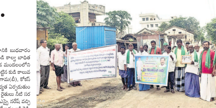
అడిగామ(కే)లో ధర్మా చేస్తున్న కుడి కాలువ బాధిత రైతులు