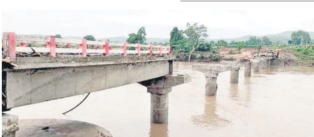
పెంజ మండలంలో కడెం వాగుపై వరదల కారణంగా కొట్టుకుపోయిన వంతెన