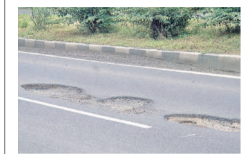
గుడిహత్నూర్ మండలం సీతాగిరి వద్ద రోడ్డుపై గుంతలు

రోడ్ల నిర్వహణ సరిగ్గా నిర్వహించలేనప్పుడు టోల్ షాజాల్లో టోల్ వసూలు చేయవద్దు. గుంతలతో కూడిన రహదారులు, టోల్ షాజాల్ వద్ద వాహనాల బారులు తీరడం ఏ మాత్రం ఆమోదయోగ్యం కాదు. కేంద్ర రహదారి, రవాణా జాతీయ రహదారుల శాఖ మంత్రి నితీష్ గడ్కర్ నేషనల్ హైవే అధికారులు, టోల్ షాజాల్ ఎజిక్యూటివ్ ఇటీవల చేసిన వ్యాఖ్యలు. కేంద్ర మంత్రి వ్యాఖ్యలను అధికారులు, టోల్ షాజాల్ నిర్వాహకులు మాత్రం పట్టించుకోవడం లేదు. రహదారి గుంతలమయంగా మారిన టోల్ షాజాల్ నిర్వాహకులు రోజూ లక్షల రూపాయల టోల్ వసూలు చేస్తున్నారు.