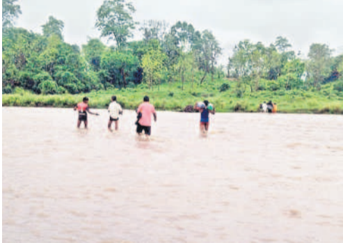
వంతెన కొట్టుకుపోవడంతో ప్రమాదకర స్థితిలో కడెం వాగు దాటి వెళ్తున్న వస్తువుల గ్రామస్థులు

నిర్మల్, ఆగస్టు 6(నమస్తే తెలంగాణ) : నిర్మల్ జిల్లాలో కొంతకాలంగా రోడ్ల పరిస్థితి దయనీయంగా మారింది. కాంగ్రెస్ ప్రభుత్వం అధికారంలోకి వచ్చిన తర్వాత కూలిన వంతెనల నిర్మాణాలు, రోడ్ల మరమ్మత్తులకు నిధులు మంజూరు చేయకపోవడం పల్లె ప్రజలకు శాపంగా మారింది. భారీ వర్షాలతో కుప్ప కూలిన వంతెనలను నిర్మించలేదు. కనీసం వాటి మరమ్మత్తుకు చర్యలు చేపట్టకపోవడంపై సర్కారు నిర్ణయానికి అడ్డం పడుతున్నది. కడెం, పెంజి, దస్తూరాబాద్, భానాపూర్, మామడ, కుబ్బీర్, తానూర్ మండలాల్లోని మారుమూల గ్రామాల రోడ్ల దారుణంగా తయారయ్యాయి. పెంజి, కడెం మండలాల్లోని వాగులపై గల వంతెనలు వరదల కారణంగా కొట్టుకుపోయి వస్తుంటే నిర్మించలేదు. కడెం వాగుపై పనులు వంతెన, గంగాపూర్ వంతెనల ద్వారా కావడంతో కేసీఆర్ ప్రభుత్వం పనులు చేపట్టేందుకు ఆదేశాలు జారీ చేసింది. ఇందుకు సంబంధించి పనులు వంతెన పునర్ నిర్మాణానికి రూ.5.50 కోట్లు, గంగాపూర్ వంతెనకు రూ.22 కోట్లను మంజూరు చేసింది. అయితే ఈ లోగా ఎన్నికలు రావడం, రాష్ట్రంలో ప్రభుత్వం మార్చడంతో పనులు ముందుకు సాగలేదు. కొత్త ప్రభుత్వం అధికారం చేపట్టిన వెంటనే గత ప్రభుత్వంలో మంజూరైన పనులను నిలిపివేయడంతో ప్రజలకు కష్టాలు మొదలయ్యాయి. ఎన్నికల సమయంలో రోడ్లు, వంతెనలు నిర్మించకుండా తాము ఓటేయబోమంటూ కూడా పలు గ్రామాల ప్రజలు ఆందోళనకు దిగారు. అయితే అధికారులు వారికి సహజంగా ఓటింగ్లో పాల్గొనేలా చేశారే తప్ప వారి సమస్యను పరిష్కరించలేదు. పంచాయతీ రాజ్, ఆర్ అండ్ బీ శాఖల పరిధిలోని రోడ్లు, వంతెనల నిర్మాణ పనులు పెండింగ్లో ఉన్నాయి. కాగా.. సమస్య తీవ్రం కావడంతో పల్లె ప్రజలు ఆందోళన బాటు పట్టేందుకు సిద్ధమవుతున్నారు. ఇందులో భాగంగానే కొన్ని రోజులూ చాలా చోట్ల బురద రోడ్లపై పరిచాట్లు వేసి ప్రభుత్వానికి తప్ప నిరసనను తెలియజేస్తున్నారు.