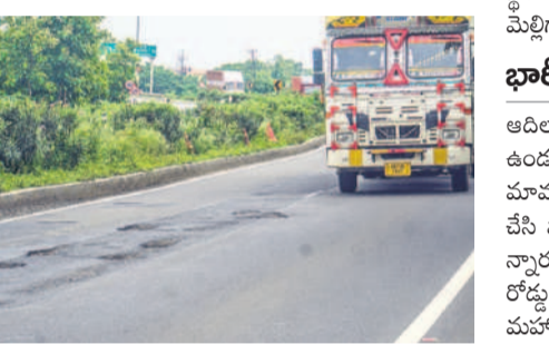
మావల సమీపంలో జాతీయ రహదారిపై గుంతలు

ఆదిలాబాద్, ఆగస్టు 6(నమస్తే తెలంగాణ) : ఆదిలాబాద్ జిల్లాలో జాతీయ రహదారి పరిస్థితి అర్ధానగా తయారైంది. జిల్లాలోని నేరడిగోడ మండలం రోల్ మోమడ నుంచి జైన్ పండలం డొల్లార వరకు 80 కిలోమీటర్ల రోడ్డుపై అడుగుడు గునా గుంతలు ఏర్పడ్డాయి. ఇటీవల కురిసిన వర్షాలతో రహదారిపై ప్రయాణం సరళిగా మారింది. ఆదిలాబాద్ జిల్లా మీదుగా ఉత్తరాది నుంచి దక్షిణాది రాష్ట్రాల వాహనాలు రాకపోకలు సాగిస్తుంటాయి. సరుకు రవాణాతో పాటు ప్రయాణికులను చేరవేస్తుంటాయి. నిత్యం వేలాది వాహనాల రాకపోకలు సాగిస్తుంటాయి. రహదారి 44 నిర్వహణను నేషనల్ హైవే అధికారి ఆఫ్ ఇండియా (ఎన్హెచ్ఐఐ) పరిధిలోకి వస్తుంది. రోడ్డు నిర్మాణ లోపం ఫలితంగా ఆదిలాబాద్ జిల్లాలోని జాతీయ రహదారిపై తరచూ ప్రమాదాలు జరుగుతుండగా రోడ్డుపై గుంతలు ప్రమాదాలకు కారణమవుతున్నాయి. ఇటీవల ఇప్పటి వద్ద రోడ్డుపై భారీ గుంతల కారణంగా లారీ డ్రైవర్ మోగాన్ని తగ్గించగా వెనక నుంచి వచ్చిన మోటార్ సైకిల్ లారీని డీకొట్టడంతో ప్రమాదం జరిగింది.