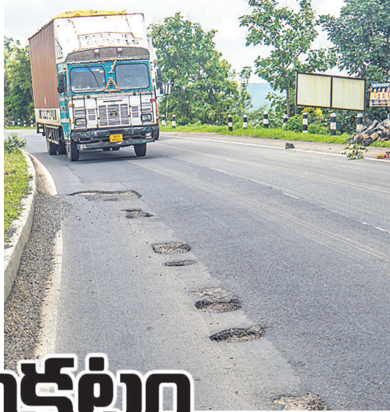
మావల సమీపంలో జాతీయ రహదారిపై గుంతల కారణంగా పక్కనుంచి వస్తున్న లారీ