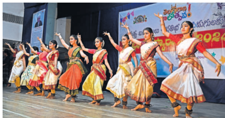
సుందరయ్య విజ్ఞాన కేంద్రంలో తెలంగాణ బాలీవుడ్ వంటి నిర్వహించిన కార్యక్రమంలో ప్రభుత్వ స్కూల్ విద్యార్థులకు ప్రతిభా పురస్కారాలను అందజేశారు. విద్యార్థులను సత్కరించిన అలరించింది.