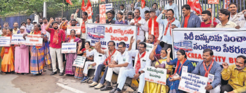
సిటీలో బస్సులను పెంచాలంటూ..గురువారం విసేజ్ వద్ద జైరాయింది.. నిరసన తెలుపుతూ, సిపీఎం నగర కమిటీ నేతలు