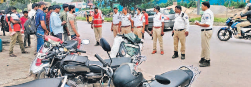
మియాపూర్ ట్రాఫిక్ పోలీసులు గురువారం బామపల్లిలోని కొకాకోలా యూటర్న్ వద్ద ప్రత్యేక తనిఖీలు చేపట్టారు. మియాపూర్, గండ్లపాలెం ప్రధాన రహదారిలో రాంగీరూట్లో వస్తున్న 30 వాహనాలను పట్టుకుని సీజ్ చేశారు. అనంతరం వాహనదారులకు కొన్నింటిని ఇచ్చారు. -దుందిగర్