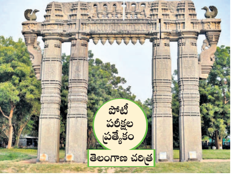
పోటీ పరీక్షల ప్రత్యేకం తెలంగాణ చరిత్ర