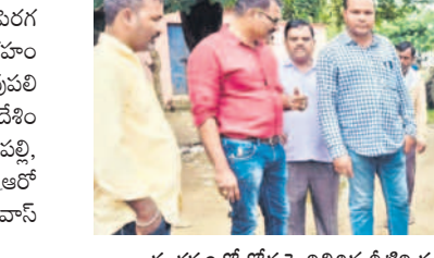
కందకర్పూర్ రోడ్డుపై నిలిచిన నీటిని పరిశీలిస్తున్న ఎంపీడీవో

పురాణిపేట్లో మొక్కలు నాటి నీళ్లు పోస్తున్న అధికారులు