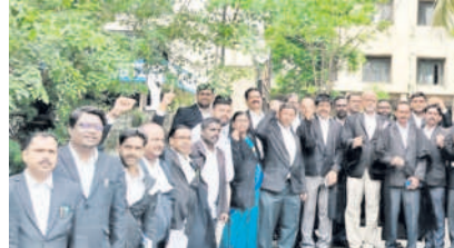
జనగామలో న్యాయవాదులపై పోలీసుల ఘోరక దాడిని నిరసనగా రెండోజా గురువారం జిల్లా కేంద్రంలో న్యాయవాదులు విధులను బహిష్కరించి, రోడ్డు ఎదురు చేసిన తెలిపారు. న్యాయవాదులపై దాడులు చేసిన పోలీసులపై చర్యలు తీసుకోవాలని, న్యాయవాద రక్షణ చట్టాన్ని తీసుకురావాలని కోరారు.