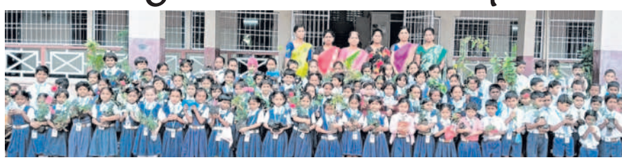
నిర్మల హృదయ పాఠశాలలో మొక్కలతో విద్యార్థులు