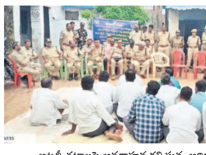
అటవీ చట్టాలపై అవగాహన కల్పిస్తున్న అధికారులు