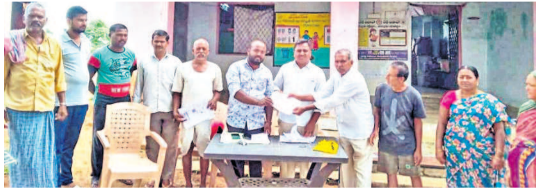
నంగూరు మండలం జేపీతండాలో రుణమాఫీ కాలేజీని ఏకాభివృద్ధి పనిని తీర్చిదిద్దేందుకు రైతులు

రుణమాఫీ గ్రీవెస్ సెలక్షన్ ఫిర్యాదుల వెల్లువ