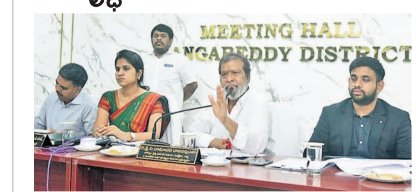
మాట్లాడుతున్న వైద్యారోగ్య శాఖ మంత్రి దామోదర రాజనర్సింహ

సంగారెడ్డి కలెక్టరేట్, ఆగస్టు 8: సీఎన్ఆర్ నిధులతో సంగారెడ్డి జిల్లాలో చేపట్టిన అభివృద్ధి పనులను వేగవంతం చేయాలని వైద్యారోగ్య శాఖ మంత్రి దామోదర రాజనర్సింహ అధికారులను ఆదేశించారు. గురువారం కలెక్టరేట్ లోని సమావేశ మందిరంలో వివిధ అభివృద్ధి పనులపై సమీక్షించారు. ఈ సందర్భంగా మంత్రి మాట్లాడుతూ 2023-24 సంవత్సరానికి జిల్లాలో రూ.160 కోట్ల సీఎన్ఆర్ నిధులు బకాయిలు ఉన్నట్లు తెలిపారు.