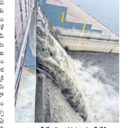
మర్నాటిలోని కొండపోచమ్మ సాగర్లోకి వస్తున్న గోదావరి జలాలు

మర్నాటి, ఆగస్టు 8 : వరాహా పరిశీలకుల నేతృత్వంలో సాగుకు నిరందిస్తూనే వేచిచూస్తున్న రైతులకు కొండపోచమ్మ సాగర్లోకి నీటిని ఎత్తిపోస్తుండడంతో రైతులు ఆనందం వ్యక్తం చేస్తున్నారు. కాళేశ్వర జలాల్తో కొండపోచమ్మ సాగర్ నుంచి నీటిని రైతాంగాన్ని ఆదుకోవాలని, మాజీమంత్రి, సిద్దిపేట ఎమ్మెల్యే హరికేరావు ఇటీవల నీటిపారుదల శాఖ మంత్రి ఉత్తంకూమార్ రెడ్డికి లేఖ రాసిని విడుదల చేశారని తెలిసింది. దీంతో ప్రభుత్వం ట్రాన్స్ గంత్ కడలిక పచ్చి మల్లన్నసాగర్ నుంచి నీటిని ఎత్తిపోస్తే ప్రత్యేకంగా ప్రారంభించింది. గురువారం ఒక మోటరు నుండి నీటిని ఎత్తిపోస్తూ గోదావరి జలాలు కొండపోచమ్మ సాగర్లోకి పరుగులు పెట్టాయి. 15 టీఎంసీల సాగునీరు గల కొండపోచమ్మ సాగర్లో ఇప్పటి వరకు 4.5 టీఎంసీల నీటిని ఎత్తిపోస్తున్నట్లు ప్రకటించారు. ఈనెల 11 వరకు నీటి అభివృద్ధిని బట్టి గోదావరి జలాలు ఎత్తిపోస్తామని అధికారులు తెలిపారు. కొండపోచమ్మ సాగర్లోకి గోదావరి జలాలు రావడంతో రైతులు హర్షం వ్యక్తం చేస్తున్నారు. నాలుగు రోజుల క్రితం రామాయంపేట కాల్యం