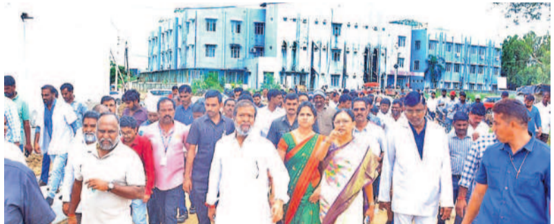
మెడికల్ కళాశాలను సందర్శించే సంగారెడ్డి రాజనర్సింహ, అధికారులు

ముందుగా భారీ పోలీసు బందోబస్తు నిర్వహించారు. ట్రైపుల్ ఆర్ రింగ్ రోడ్డు వల్ల జీవనోపాధి కోల్పోతున్నారని రైతులు ఆవేదన వ్యక్తం చేశారు. ప్రభుత్వం తమకు లిఖితపూర్వకంగా హామీ ఇచ్చి భూసర్వే చేయాలని డిమాండ్ చేశారు. తమ తాతల కాలం నుంచి వస్తున్న భూములను కోల్పోతే తమకు జీవనోపాధి లేకుండా పోతుందని, భూములు ఇచ్చే ప్రసక్తి లేదని తీవ్ర ఆందోళనలు చేస్తున్నారు. అనంతరం జాతీయ రహదారి 65పై ధర్మా నిర్వహించారు. ధర్మా చేస్తున్న రైతులను పోలీసులు అరెస్టు చేసి పోలీసుస్టేషన్ కు తరలించారు.