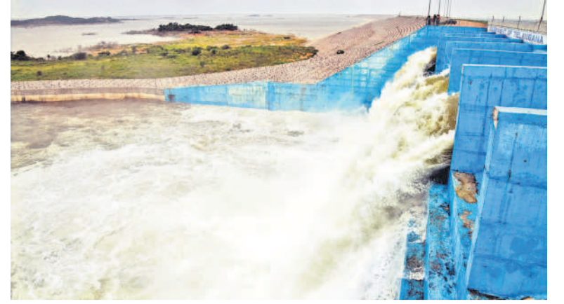
తుక్కాపూర్ పంపిణీని సుంచి మల్లన్నసాగర్లోకి వెళ్తున్న గోదావరి జలాలు