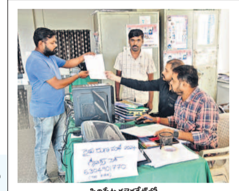
సిద్దిపేట కలెక్టరేట్లో రైతు రుణమాఫీపై గ్రీవెస్ సెలక్షన్ ఫిర్యాదు చేసిన అధికారులు