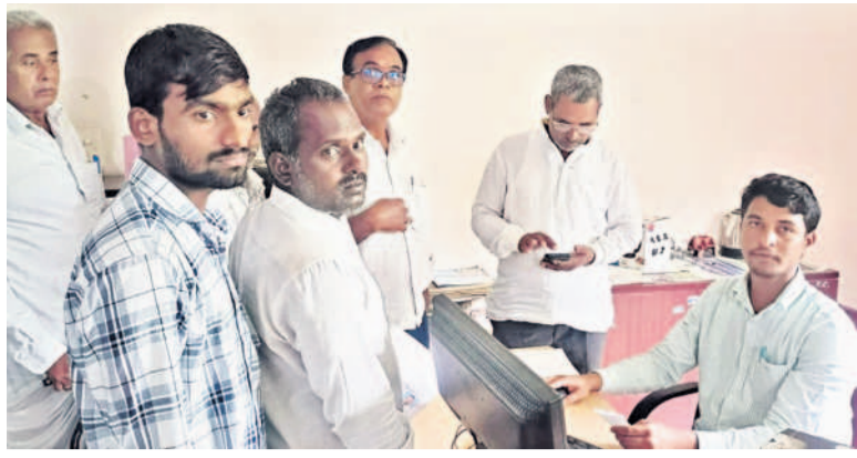
రుణమాఫీ కాలేజీని సంగారెడ్డిలోని జిల్లా వ్యవసాయశాఖ కార్యాలయంలో ఫిర్యాదు చేస్తున్న రైతులు