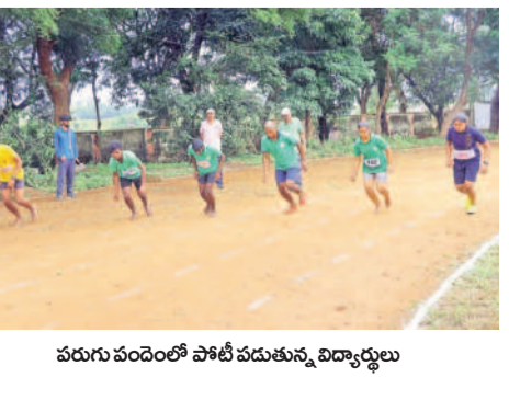
పరుగు పందెంలో పోటీపడుతున్న విద్యార్థులు