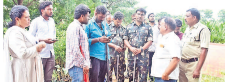
పోలీసు బందోబస్తు మధ్య ట్రైపుల్ ఆర్ సర్వే చేస్తున్న అధికారులు

సదాశివపేట, ఆగస్టు 8: రాష్ట్ర ప్రభుత్వం చేపడుతున్న రిజిస్ట్రేషన్ రింగ్ రోడ్డు నిర్మాణానికి భూములు ఇవ్వడంపై రైతులు తీవ్ర ఆందోళనలు చేస్తున్నారు. భూములు కోల్పోతున్నారని రైతులు ఆవేదన వ్యక్తం చేశారు. ప్రభుత్వం తమకు లిఖితపూర్వకంగా హామీ ఇచ్చి భూసర్వే చేయాలని డిమాండ్ చేశారు. తమ తాతల కాలం నుంచి వస్తున్న భూములను కోల్పోతే తమకు జీవనోపాధి లేకుండా పోతుందని, భూములు ఇచ్చే ప్రసక్తి లేదని తీవ్ర ఆందోళనలు చేస్తున్నారు. అనంతరం జాతీయ రహదారి 65పై ధర్మా నిర్వహించారు. ధర్మా చేస్తున్న రైతులను పోలీసులు అరెస్టు చేసి పోలీసుస్టేషన్ కు తరలించారు.