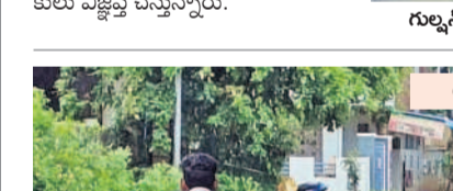
టీవల్ కాలనీలో నిందిత వర్షపునీరు