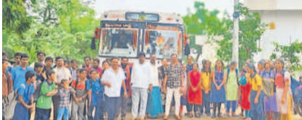
నిరసన తెలుపుతున్న విద్యార్థులు, యువకులు