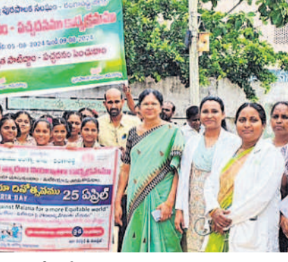
అమనగల్లులో రాజీ నిర్వహిస్తున్న వైద్యసౌఖ్యం