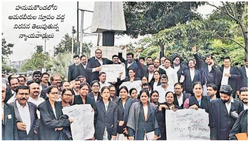
హనుమకొండలోని అమరవీరుల స్మారక చిహ్న నిరసన తెలుపుతున్న న్యాయవాదులు