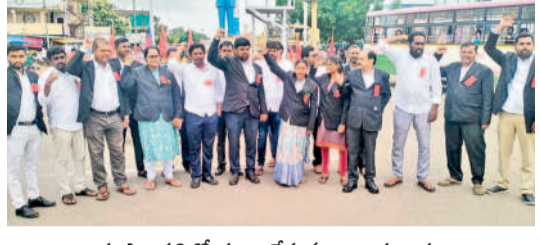
భూపాలపల్లిలో ధర్నా చేస్తున్న న్యాయవాదులు