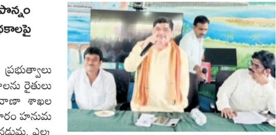
ఎల్లత్తుర్తి : మాట్లాడుతున్న మంత్రి పాస్సం ప్రభాకర్

ఎల్లత్తుర్తి/భీమదేవరపల్లి, ఆగస్టు 8 : ప్రభుత్వాల రైతులకు సబ్సిడీ కింద అందిస్తున్న పథకాలను రైతులు వినియోగించుకోవాలని రాష్ట్ర బీసీ, రవాణా శాఖల మంత్రి పాస్సం ప్రభాకర్ కోరారు. గురువారం హనుమకొండ జిల్లా ఎల్లత్తుర్తి మండలం కోతులనడమ, ఎల్లత్తుర్తి, భీమదేవరపల్లి మండలంలోని ముల్లూర్, మల్లూర్ రైతువేదికలో వ్యవసాయ, అనుబంధ రంగాల శాఖల అధికారులు, రైతులతో సమావేశం నిర్వహించి కేంద్ర, రాష్ట్ర ప్రభుత్వాల సబ్సిడీపై అందిస్తున్న పథకాలపై అవగాహన కల్పించారు. ఈ సందర్భంగా మంత్రి మాట్లాడుతూ రాష్ట్రంలో ఎక్కడా లేని విధంగా రైతులు, అధికారులతో సమావేశాలు నిర్వహిస్తున్నామన్నారు. ప్రభుత్వాల అందించే సబ్సిడీ పథకాలపై రైతులకు సరైన అవగాహన లేక వాటిని వినియోగించుకోలేక పోతున్నారని అన్నారు. రైతులకు తమకు నచ్చిన పథకాలకు సంబంధించి అధికారులకు దరఖాస్తు చేసుకొని అర్హి పొందాలని, బ్యాంకు అధికారులతో సైతం మాట్లాడతామన్నారు. దేవదాసు ప్రాజెక్టు కాలనుకూల పరమార్థుడు పనులు పూర్తిచేసి చివరి ఆయకట్టు వరకు నీళ్లు అందేలా చూస్తామన్నారు.