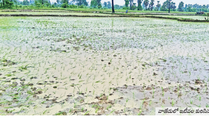
వాజేడులో ఇటీవల కురిసిన వర్షంతో వేసిన పరి నాట్లు