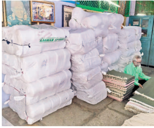
ఖరీదు చేసిన కార్మిట్లను బండీల్స్ కడుతున్న సిబ్బంది