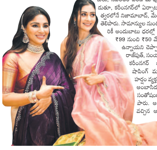
కరీంనగర్లో మెరిసిన సినీతారలు