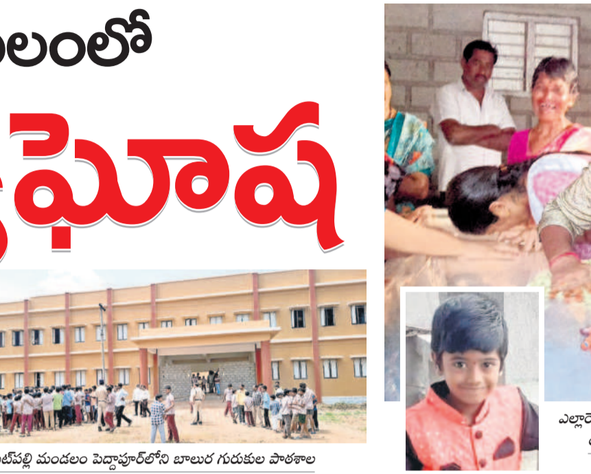
మెట్పల్లి మండలం పెద్దాపూర్లోని బాలుర గురుకులం పాఠశాల

ఉమ్మడి జిల్లాలోనే ప్రత్యేక గుర్తింపు కలిగిన పెద్దాపూర్ బాలుర గురుకులంలో మృత్యుఘోష వినిపిస్తున్నది. సౌకర్యాల లేమి, పాలకుల చోద్యం, అధికారుల అలసత్వం పిల్లల ప్రాణాలను బలిగొంటున్నది. పదిహేను రోజుల క్రితం ఓ విద్యార్థి మృతిచెందిన విషయం మరిచిపోకముందే, శుభవారం మరో విద్యార్థి పరిస్థితి విషమంగా ఉండడం భయాందోళన కలిగిస్తున్నది. వరుస ఘటనలకు పాముకాటే కారణమన్న అనుమానాలు బలంగా కనిపిస్తుండగా, విద్యార్థులు పణికిపోవచ్చు వచ్చున్నది. పాఠశాల అవరణలో పిచ్చి మొక్కలు, ముఖ్యపాదలు ఉండడం, పాముల సంచారం ఉండడంతో ఎప్పుడూ జరుగుతుందో తెలియని పరిస్థితి ఉన్నది. దీనిపై తల్లిదండ్రులు ఆందోళన చెందుతున్నారు. తమ పిల్లల భవిష్యత్ కోసం పంపానుని, ఇలా చంద్రకోపడం కోసం కాండంటూ ఆవేదన వ్యక్తం చేస్తున్నారు.