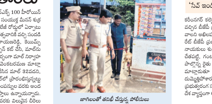
జాగిలంతో తనిఖీ చేస్తున్న పోలీసులు

నిషేధిత పదార్థాల కోసం వేట నగరంలో పోలీసుల తనిఖీలు కరీంనగర్ రాంసగర్, ఆగస్టు 9 : నిషేధిత పదార్థాలకు అడ్డుకట్ట వేసేందుకు కరీంనగర్ పోలీస్ కమిషనరేట్ పోలీసులు వేట సాగించారు. నార్కోటిక్స్ విభాగంలో ప్రత్యేక శిక్షణ పొందిన పోలీస్ జాగిలంతో డాగ్ స్కాప్ డివిజన్ బృందం కరీంనగర్-2 టౌన్ సీబి సిబ్బందితో కలిసి రంగంలోకి దిగారు. శుభవారం నగరంలోని పార్కింగ్ ఆఫీసులు, కిరాణి షాపులు, పాన్ షాపులు, హాస్టళ్లు, అనుమానిత ఇండ్లలో తనిఖీ చేశారు. పోలీస్ స్టేషన్ పరిధిలో ఎక్కడైనా నిషేధించిన గంజాయి, మత్తు పదార్థాలు ఉన్నా లేక విక్రయాస్తున్నట్లు సమాచారం ఉంటే వెంటనే దరఖా 100 ద్వారా సమాచారం అందించాలని టౌన్ డివీజన్ సరెండర్ తెలిపారు.