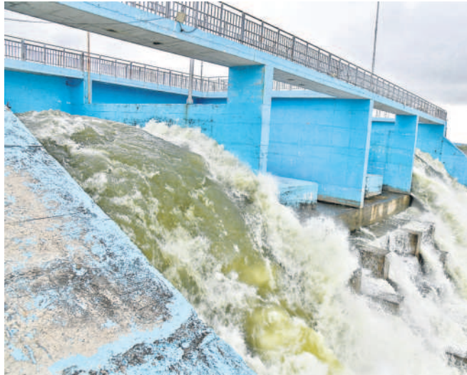
అన్నపూర్ణ రిజర్వాయర్ నుంచి వండ్లపూర్ వద్ద హన్మంతు ద్వారా నిర్మింపబడిన జిల్లా రంగనాయకసాగర్లోకి వస్తున్న గోదావరి జలాల