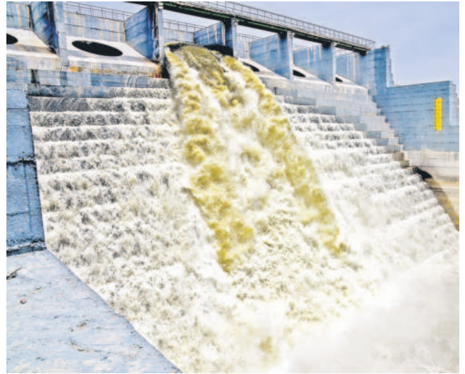
మల్లన్నసాగర్ నుంచి మర్చి వద్ద హన్మంతు ద్వారా కొండవోచమ్మ సాగర్లోకి దుంకుతున్న గోదావరి జలాల