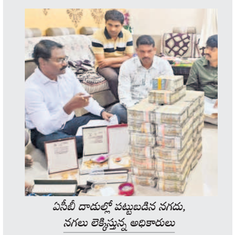
ఏసీబీ దాడుల్లో పట్టుబడిన నగదు, నగలు లెక్కిస్తున్న అధికారులు