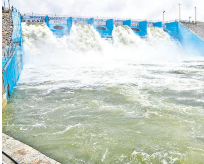
రంగనాయకసాగర్ నుంచి తుక్కాపూర్ సమీపంలో ద్వారా మల్లన్న సాగర్లోకి వదుగులు తీస్తున్న జలాల