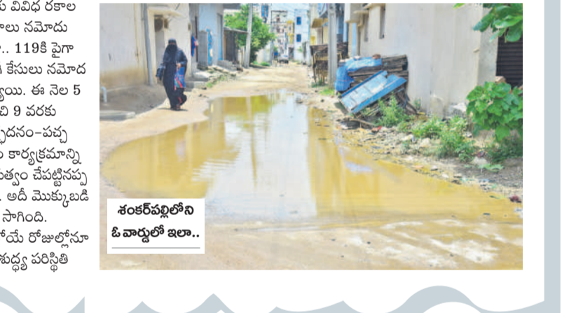
శంకర్ పల్లిలోని ఓ వాడులో ఇలా..