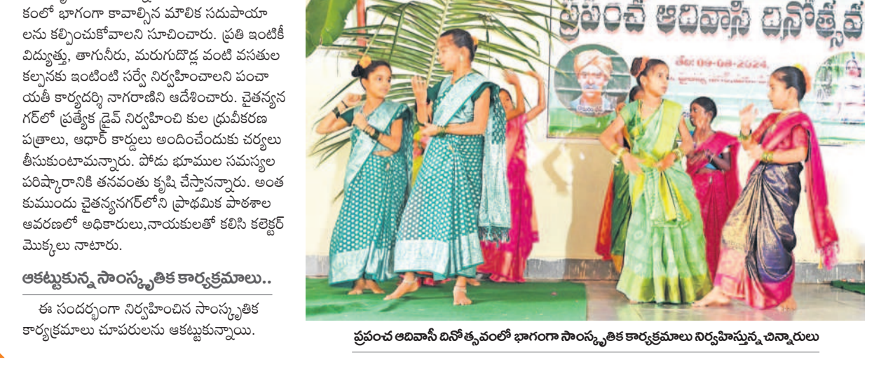
ప్రపంచ ఆదివాసి దినోత్సవంలో భాగంగా సాంస్కృతిక కార్యక్రమాలు నిర్వహిస్తున్న చిన్నారలు

ఆకట్టుకున్న సాంస్కృతిక కార్యక్రమాలు.. ఈ సందర్భంగా నిర్వహించిన సాంస్కృతిక కార్యక్రమాలు చూసేసరికి ఆకట్టుకున్నారు.