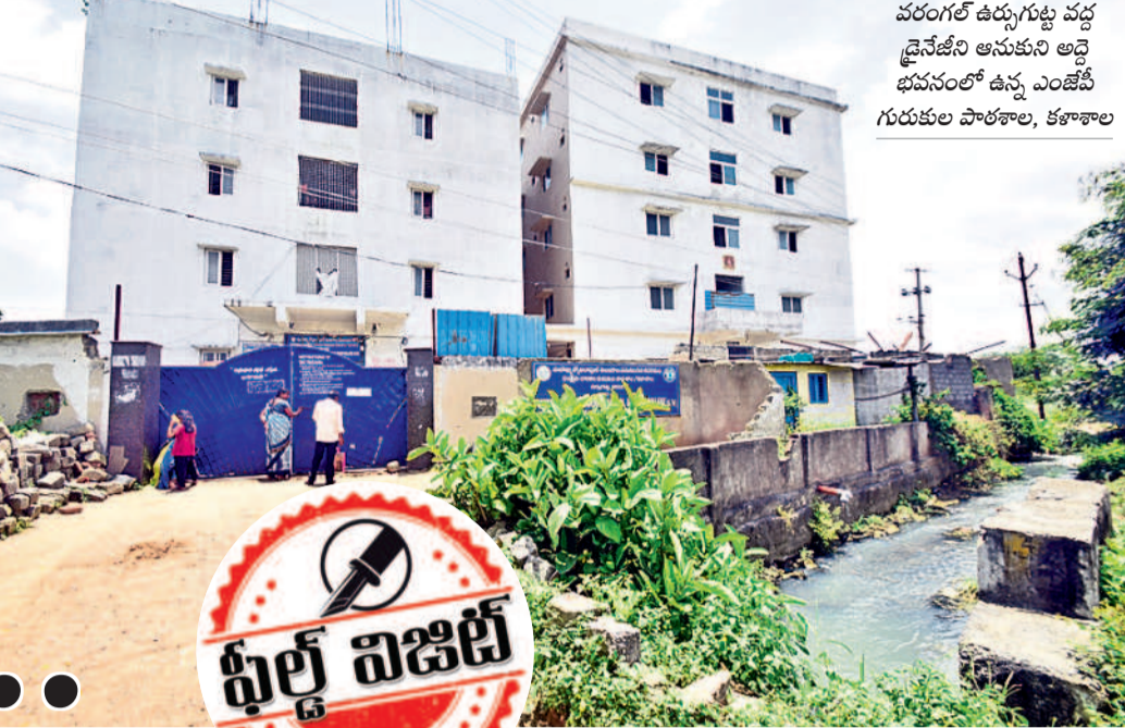
వరంగల్ ఉర్బన్ గుట్ట వద్ద డైనేజీని అనుకుని అద్దె భవనంలో ఉన్న ఎంజీపీ గురుకులాల పాఠశాల, కళాశాల