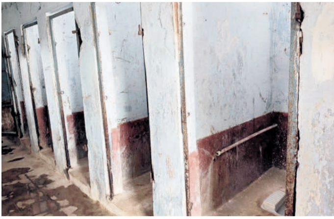
జనగామలోని సోషల్ వెల్ఫేర్ పాఠశాలలో దోమల బెడద మరుగుదొడ్లు