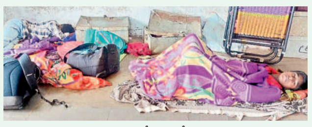
మల్లపల్లి గురుకులంలో జ్వరంతో పడుకున్న విద్యార్థులు