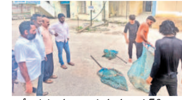
వీధికుక్కలను బంధిస్తున్న మున్సిపల్ సిబ్బంది

వరంగల్ చౌరస్తా, ఆగస్టు 10: పసికందు ఘటన నేపథ్యంలో ఎంజీఎం దవాఖానలో సంబంధిస్తున్న వీధికుక్కలను శనివారం మున్సిపల్ సిబ్బంది పట్టుకున్నారు. శిశువు మృతదేశాన్ని పీక్కు తిన్న ఘటన వెలుగులోకి రావడంతో శనివారం మంత్రి కొండ సురేఖ స్పందించి మున్సిపల్ అధికారులను ఆదేశించారు. ఈ మేరకు జీడబ్ల్యూఎస్ సీఎం హెచ్ డాక్టర్ రాజేశ్వర్ ఆధ్వర్యంలో 12 కుక్కలను బంధించి ఇతర ప్రాంతాలకు తరలించారు.