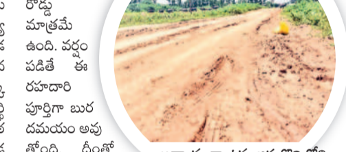
అధ్యాసంగా ఉన్న జక్కలొద్దిలోని మైనారిటీ గురుకులాల బాలర పాఠశాలకు వేరుకునే మట్టిరోడ్డు

వరంగల్ ఉర్బన్ గుట్టలోని అద్దె భవనంలో సమస్యల్ని మహాత్మా జ్యోతిబాపూలే తెలంగాణ మెన్ కబడిన తరగతుల సంక్షేమ బాలికల గురుకులాల పాఠశాల, కళాశాలలో సమస్యలు గుర్తుకుంటున్నాయి. సరిపడా గదులు, టాయిలెట్స్, డ్యూయల్ డెస్కులు లేవు. ఈ పాఠశాల, కళాశాలలో విద్యార్థులు వెలుగులోకి రావడానికి ప్రభుత్వంలోనే ప్రథమస్థానంలో నిలిచినప్పటికీ సమస్యలతో సమతమపుటుక లేదు. శనివారం 'నమస్తే తెలంగాణ' ఈ గురుకులాలపై విజిట్ చేయగా పలు సమస్యలు వెలుగులోకి వచ్చాయి. ఈ భవనం ఖమ్మం ట్రైబ్యూనల్ వద్ద పక్కనే డైనేజీని అనుకుని ఉండడంతో దుర్వాసన వస్తుండగా, కొన్ని సందర్భాల్లో విద్యార్థులను వ్యాధుల బారిన పడుతున్నారు. ప్రస్తుతం ఈ గురుకులాలలో ఐదు సుంచి వద్ద తరగతి గదులు 480, ఇంటర్మీడియట్ చదువుతున్న వారు 320, మొత్తం 800 మంది ఉన్నారు. ఇంటర్మీడియట్ విద్యార్థులు 160 మంది ఉండగా, జిల్లాలోని నెక్సోండ మహాత్మా జ్యోతిబాపూలే కళాశాల నిర్వహణకు అప్పజేసిన వసతులు లేకపోవడం వల్ల అక్కడి నుంచి 160 మందిని ఇక్కడకు తీసుకొచ్చారు. ఈ గురుకులాలలోని పాఠశాల విద్యార్థులు తరగతి గదుల్లో నేలపై కూర్చోవాల్సి వస్తున్నది. పాఠశాల విద్యార్థులకు చెందిన ద్యుయల్ డెస్కులను నెక్సోండ నుంచి వచ్చిన ఇంటర్మీడియట్ విద్యార్థులకు సమకూర్చటం వల్ల ఈ సమస్య ఉత్పన్నమైంది. మూడు తరగతుల విద్యార్థులను నేలపై కూర్చోని చదువు సాగుతున్నాయి.