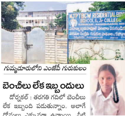
గుమ్మడూరులోని ఎంజీపీ గురుకులం