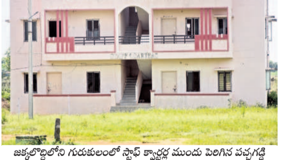
జక్కలొద్దిలోని గురుకులాలలో స్టాప్ క్వార్టర్ల ముందు పెరిగిన వచ్చగడ్డి

అరకొర వసతులు, అధ్యాసంగా పరిసరాలు పెచ్చులాడుతున్న తరగతి గదులు, ఉరుస్తున్న భవనాలు విద్యార్థుల సంఖ్యకు అనుగుణంగా లేని మరుగుదొడ్లు, స్నానగదులు