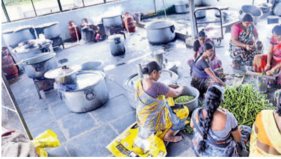
వర్షపాటు మండలంలోని ఇల్లంద కస్తూర్బాగారి బాలికల విద్యాలయం సమస్యలకు నెలపుగా మారింది. పాఠశాలలో విద్యార్థులకు స్వచ్ఛమైన తాగునీరు అందించేందుకు గత కేసీ ఆర్ ప్రభుత్వం వాటర్షాంట్ ఏర్పాటు చేసింది. కానీ ప్రస్తుతం కాంగ్రెస్ ప్రభుత్వం ఏర్పాటు చేసిన తర్వాత సరైన నిర్వహణ లేక వాటర్ షాంట్ పనిచేయడం లేదు. ఫలితంగా విద్యార్థులు నల్లా నీళ్లు తాగి వస్తోంది. కులుషిత నీటి వల్ల విద్యార్థులు పలుమార్లు జ్వరం బారిన పడుతున్నారు. అలాగే మూత్రాశయ, మరుగుదొడ్డు కూడా అపరిశుభ్రంగానే ఉన్నాయి. వీటిని ఎప్పటికప్పుడూ శుభ్రం చేయించడంలో కూడా అధికారులు నిర్లక్ష్యం కనిపిస్తోంది. అలాగే శుభి, రుచికరమైన భోజనం పెట్టడం లేదని విద్యార్థులను వాపోతున్నారు. ప్రస్తుతం ఇల్లంద

మహబూబాబాద్ జిల్లాలోని గురుకులాల పాఠశాలల్లో వసతులు సరిగా లేక విద్యార్థులు ఇబ్బందులు పడుతున్నారు. మహబూబాబాద్ పట్టణం గుమ్మడూరులోని మహాత్మా జ్యోతిబాపూలే తెలంగాణ మెన్ కబడిన తరగతుల సంక్షేమ గురుకులాల పాఠశాల, కళాశాలను శనివారం 'నమస్తే తెలంగాణ' బృందం క్షేత్రస్థాయిలో పరిశీలించింది. ఇందులో ఐదు సుంచి వద్ద తరగతి, ఇంటర్మీడియట్ ఎంపీసీ, బైపీసీ, సీకేసీ విద్యార్థులు చదువుతున్నారు. దంతాలవల్లిలో అద్దె భవనం దొరకపోవడంతో అక్కడి విద్యార్థులకు కూడా ఇక్కడికి తీసుకొచ్చారు. మొత్తం 613 మంది విద్యార్థులు విద్యనభ్యసిస్తున్నారు. తరగతి గదులు సరిపడా ఉన్నప్పటికీ టాయిలెట్స్ కేవలం 22 మాత్రమే ఉండడంతో ఉదయం లేవగానే క్యూ కట్టాల్సి వరిస్తోంది. బాత్రూంలు కూడా తక్కువగానే ఉన్నాయి. భోజనశాల సైతం చిన్నగా ఉండడంతో మూడు షిఫ్టుల్లో భోజనాలు చేస్తున్నారు. ఈ విషయమై ప్రెసిడెంట్ దేవులపల్లి రాజేశ్వర్ నివారణ కోరగా తాను ఇటీవలే బదిలీపై వచ్చానని, సమస్యలను ఉన్నతాధికారులకు దృష్టికి తీసుకెళ్లి పరిష్కరించేలా చూస్తానన్నారు.