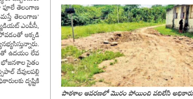
పాఠశాల ఆవరణలో మొరం పోయింది వదిలేసి అధికారులు

వర్షపాటు మండలంలోని ఇల్లంద కస్తూర్బాగారి బాలికల విద్యాలయం సమస్యలకు నెలపుగా మారింది. పాఠశాలలో విద్యార్థులకు స్వచ్ఛమైన తాగునీరు అందించేందుకు గత కేసీ ఆర్ ప్రభుత్వం వాటర్షాంట్ ఏర్పాటు చేసింది. కానీ ప్రస్తుతం కాంగ్రెస్ ప్రభుత్వం ఏర్పాటు చేసిన తర్వాత సరైన నిర్వహణ లేక వాటర్ షాంట్ పనిచేయడం లేదు. ఫలితంగా విద్యార్థులు నల్లా నీళ్లు తాగి వస్తోంది. కులుషిత నీటి వల్ల విద్యార్థులు పలుమార్లు జ్వరం బారిన పడుతున్నారు. అలాగే మూత్రాశయ, మరుగుదొడ్డు కూడా అపరిశుభ్రంగానే ఉన్నాయి. వీటిని ఎప్పటికప్పుడూ శుభ్రం చేయించడంలో కూడా అధికారులు నిర్లక్ష్యం కనిపిస్తోంది. అలాగే శుభి, రుచికరమైన భోజనం పెట్టడం లేదని విద్యార్థులను వాపోతున్నారు. ప్రస్తుతం ఇల్లంద