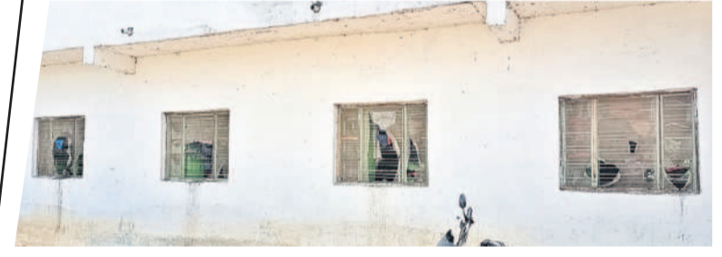
కెటికీలకు విరిగిపోయిన జాలీలు

కొత్త పంచాయతీలు ఏర్పాటు.. కోటగిరి, ఆగస్టు 10: కోటగిరి మండలంలో కొత్తగా మరో మూడు గ్రామ పంచాయతీలకు ప్రభుత్వం ఆమోదముద్ర వేసింది. గతంలో 13 గ్రామ పంచాయతీలు ఉండగా కొత్తగా మరో మూడు ఏర్పాటుచేయబడ్డాయి. శ్రీనివాసరెడ్డి కాలనీ, చిత్తంపల్లి, దీంతో కోటగిరి మండలంలో 16 గ్రామ పంచాయతీలు ఏర్పాటుచేయబడ్డాయి. ఏర్పాటు చేయబడ్డాయి. ఏర్పాటు చేయబడ్డాయి. పాఠశాలలో ఐదు.. పాఠశాలలో, ఆగస్టు 10: పాఠశాల మండలంలో ఐదు గ్రామ పంచాయతీలకు కొత్తగా ఏర్పాటు చేస్తున్నారు.