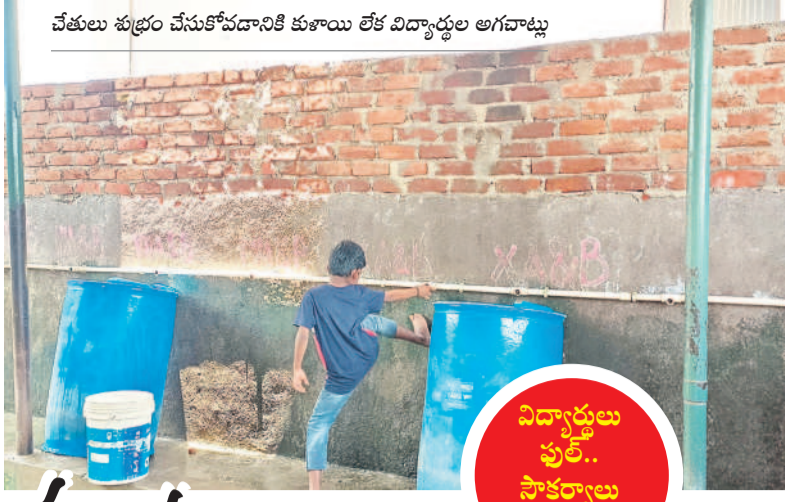
చేతులు శుభ్రం చేసుకోవడానికి కుశాల లోక విద్యార్థుల అగణాట్టు

విద్యార్థులు శుభ్రం చేసుకోవడానికి కుశాల లోక విద్యార్థుల అగణాట్టు