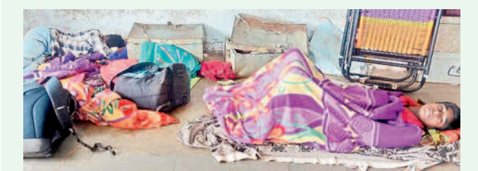
మల్లంపల్లి గురుకులంలో జ్వరంతో పడుకున్న విద్యార్థులు