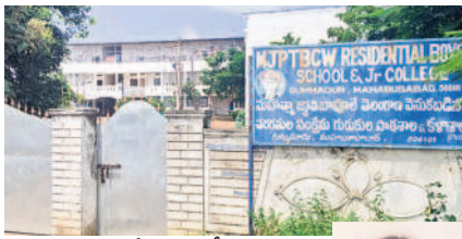
గుమ్మడూరులోని ఎంజీపీ గురుకులం