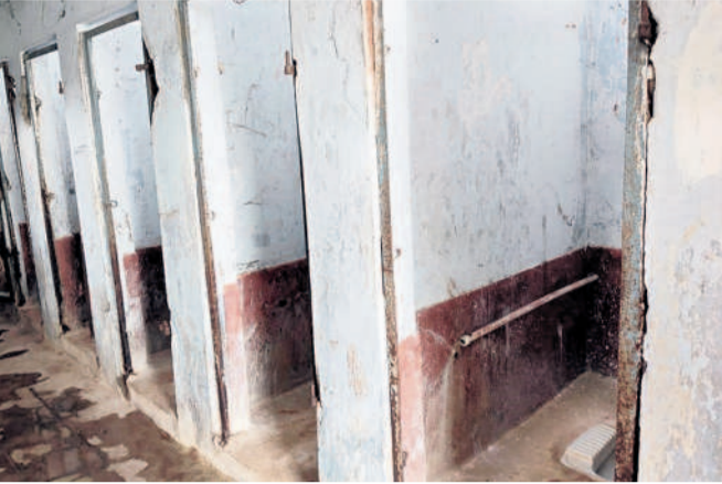
జనగామలోని సోషల్ వెల్ఫేర్ పాఠశాలలో దోమల లేని మరుగుదొడ్డు

దోమల బెడద లో తరగతి గదిలో బెంచీలు లేక ఇబ్బంది పడుతున్నాయి. అలాగే దోమల ఎక్కావగా ఉన్నాయి. వీటి నివారణకు మందు స్ప్రే చేయాలి. విద్యార్థులకు ఎలాంటి అసౌకర్యాలు లేకుండా చూడాలి. - ఏ దీపి, కేజీబీపీ రాజకాండ, దోమల