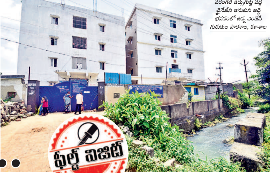
వరంగల్ ఉర్బుగుట్ట వద్ద డ్రైనేజీని అనుకుని అద్దె భవనంలో ఉన్న ఎంజీపీ గురుకుల పాఠశాల, కళాశాల