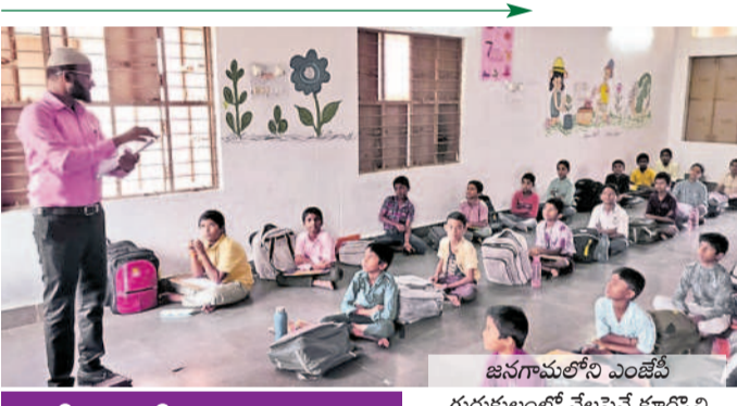
జనగామలోని ఎంజీపీ గురుకులంలో నేలపైనే కూర్చోని విద్యార్థులు

హనుమకొండ జిల్లాలో గురుకులాల, ఆశ్రమ పాఠశాలలు, సంక్షేమ వసతి గృహాలు మురికి కూపాలగా మారాయి. వాటిలో విద్యార్థులు పలు రకాల సమస్యలతో సహవాసం చేస్తున్నారు. చాలా ఆశ్రమ పాఠశాలలు, వసతి గృహాల్లో పరిశుభ్రత పాటించడం లేదు. గత ప్రభుత్వం గురుకులాల, ఆశ్రమ పాఠశాల, హాస్పిటల్స్ సుస్థితిని పునరుద్ధరించే పాటు బలవర్ధకమైన పాస్టికానీసం సరఫరా చేసింది. ప్రతి రోజూ గిడ్డు, వారంలో రెండు రోజులు చిక్నెన్, చేపలు భోజనం పెట్టేవారు. ప్రస్తుతం వారంలో రెండు రోజులు మాత్రమే కోడిగుడ్డు పెడుతున్నట్లు సమాచారం. కొన్ని ఆశ్రమ పాఠశాలలు, హాస్పిటల్స్ దొడ్డు బియ్యం అన్నం, కుళ్లి పోయిన కూరగాయలు, ఉల్లిగడ్డలు, నీళ్ల చారుతో భోజనం పెడుతున్నట్లు కొందరు విద్యార్థులు తెలిపారు. అంతేకాక కిటికీలకు, రూములకు మెష్ (దోమ తిరులు) విద్యార్థులు చేయకపోవడం, ప్యాన్లు సరిగా తిరిగిపోవడంతో దోమలు, ఈగలతో విద్యార్థులు రోగాల బారిన పడుతున్నారు. పాలసముద్రంలోని ఎన్నో ఆశ్రమ పాఠశాలలో అనేక సమస్యలతో విద్యార్థులు అవస్థలు పడుతున్నారు. ఉన్న కొన్ని గదులనే అప్పింటికి వాడుతున్నారు. విద్యుత్ డెన్ చేయడంతోపాటు విద్యార్థులు ఆ గదుల్లోనే చదువుతున్నారు. విద్యార్థులు కూర్చోనే ఉండకుంట్లు, పడుకొనేందుకు గార్మింట్స్ లేక నేలపైనే కూర్చోబెట్టి క్షామిలు చెప్పడం, రాత్రి వేళ్లలో అదే నేలపైనే పడుకోబెట్టడంతో విద్యార్థులు భయాందోళనకు గురవుతున్నారు. కెపాసిటీకి మించి విద్యార్థులు చేరుకుండడంతోనే ఇబ్బందులు వస్తున్నాయని పలువురు వార్డెన్లు వాపోతున్నారు. ప్రభుత్వం నుంచి బియ్యం, పప్పులు సరఫరా చేస్తున్నప్పటికీ కోడి గిడ్డు, పాలు, కూరగాయల లాంటి ప్రావిజన్స్ గత పేట్రులకు గత పేట్రులకు నీరు నుంచి బిల్లులు రావడం లేదని, అప్పులు తెచ్చి సొంతగా కొనుగోలు చేస్తున్నట్లు వార్డెన్లు చెబుతున్నారు.