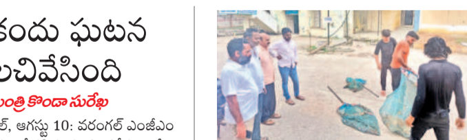
విధికుక్కలను బంధిస్తున్న మున్సిపల్ సిబ్బంది

నర్సంపేటలోని సోషల్ వెల్ఫేర్ గురుకుల పాఠశాల, కళాశాల భవనం పెప్పిలూడుతుండడంతో విద్యార్థుల ప్రాణాలు అరచేతుల్లో పెట్టుకోవాల్సి వస్తోంది. ఇందులో ప్రస్తుతం 546 మంది విద్యార్థులున్నారు. గురుకులం ప్రాంతంలోని సమీపంలోని పాఠశాలలో కావడంతో విద్యార్థులు ఇబ్బందులు పడుతున్నారు. వచ్చే నీరు కూడా గోడలు, జాయింట్ల నుంచి కారుతున్నది. దీని వల్ల వర్షం కురిసినప్పుడల్లా ఎప్పుడూ పెప్పిలూడి మీద పడతాయానని విద్యార్థులు భయాందోళనకు గురవుతున్నారు. ఇప్పటికే గోడల వెంట నీళ్లు కారుతూ పగుళ్లు పడుతున్నాయి. మరమ్మత్తు కోసం చాలాసార్లు ఉన్నతాధికారుల దృష్టికి తీసుకుని వెళ్లినా ఫలితం లేదు. నిధులు మంజూరు చేయకపోవడంతో పాఠశాల భవనంలోనే కాలం వెళ్లిపోతున్నాయి. మొత్తం 40 గదులు ఉండగా, విద్యార్థుల ఆడేగించారు. ప్రభుత్వ దవాఖానలో వైద్యులు అప్రమత్తంగా ఉంటూ ఇలాంటి ఘటనలు పునరావృతం కాకుండా పర్యవేక్షించాలని సూచించారు. ఎంజీఎం దవాఖానలో ఆడనాని అడనాని సీమెరాల విద్యార్థులు చర్యలు తీసుకోవాలని జిల్లా అధికారి యంత్రాంగాన్ని ఆమె ఆదేశించారు. దవాఖానలు, బహిరంగ ప్రదేశాల్లో వీధి కుక్కలు సంచరించకుండా చర్యలు తీసుకోవాలన్నారు.