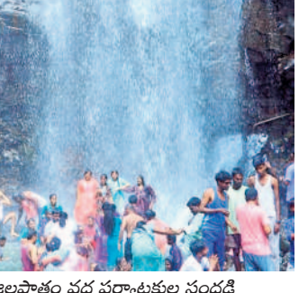
అందాలతో ఆకట్టుకుంటున్న జలపాతాలు... భారీగా తరలివచ్చి సందడి చేస్తున్న పర్యాటకులు