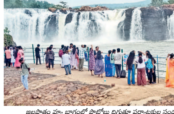
జలపాతం వ్యాఖ్యానంలో పాటోలు దిగుతూ పర్యాటకుల సందడి

బోనమో పోచమ్మ... పోచమ్మ, ముత్యాలమ్మ, మైనమ్మ, పెద్దమ్మ లకు సమర్పణ... ఆకట్టుకున్న శివసత్తుల పూసకాలు, పోతరాజుల విన్యాసాలు... శ్రావణ మాస బోనమో సందడిగా పల్లెలు