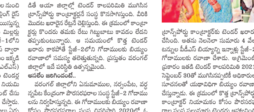
ముగిసిన టెండర్ కాలపరిమితి... చేతులెత్తిన ట్రాన్స్పోర్టు కాంట్రాక్టర్... ఎంఎల్ఎస్ గోదాములకు నిలిచిన రైన్ రవాణా... 60 రేషన్ షాపులకు అందని 550 టన్నుల బియ్యం... కాల్వలకు తప్పని ఎదురుచూపులు... పౌరసరఫరాల సంస్థ అధికారుల నిర్లక్ష్యమే కారణం

పౌరసరఫరాల సంస్థలో ప్రజాపంపిణీ వ్యవస్థ (సీడిఎస్) బియ్యం రవాణాపై వివాదం తలెత్తింది. కాలపరిమితి ముగిసినందున తాను స్టేజీ-1 గోదాముల నుంచి స్టేజీ-2 గోదాములకు బియ్యం రవాణా చేయలేని ట్రాన్స్పోర్టు కాంట్రాక్టర్ చేతులెత్తేశాడు. కొత్త ట్రాన్స్పోర్టు కాంట్రాక్టర్ నియామకం కోసం పౌరసరఫరాల సంస్థ ఇటీవల పిలిచిన టెండర్ ను కొన్ని కారణాల వల్ల రద్దు చేసింది. దీంతో వరంగల్ జిల్లాలో స్టేజీ-2 గోదాములకు బియ్యం రవాణాకు తాజాగా బిడ్డే వందలి. ఫలితంగా ఈ నెలలో ఇప్పటివరకు జిల్లాలోని పలు చోట దుకాణాలకు పీడిఎస్ రైన్ చేరుకోలేదు. కాల్వలకు రేషన్ బియ్యం పంపిణీ ప్రారంభం కాలేదు.