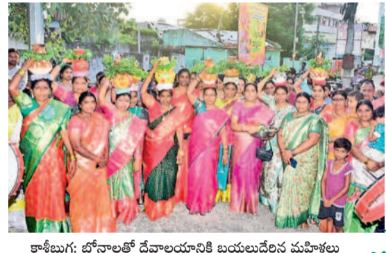
కాశీబుగ్గ: బోనాలతో దేవాలయానికి బయలుదేరిన మహిళలు