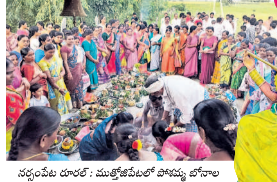
నర్సంపేట దూరలో: ముత్తేజిపేటలో పోచమ్మ బోనాల వేడుకల్లో పాల్గొన్న గ్రామస్థులు