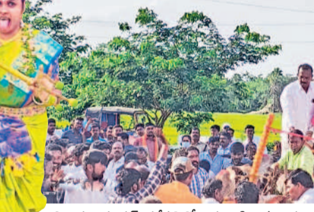
పాలకుర్తి దూరలో: దర్భంపల్లిలో ఎడ్లబండిపై వచ్చి దండమ్మ తల్లి బోనాల్లో పాల్గొన్న మాజీ మంత్రి ఎర్రబెల్లి

బోనమో పోచమ్మ... పోచమ్మ, ముత్యాలమ్మ, మైనమ్మ, పెద్దమ్మ లకు సమర్పణ... ఆకట్టుకున్న శివసత్తుల పూసకాలు, పోతరాజుల విన్యాసాలు... శ్రావణ మాస బోనమో సందడిగా పల్లెలు