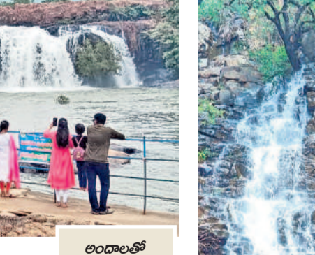
అందాలతో ఆకట్టుకుంటున్న జలపాతాలు... భారీగా తరలివచ్చి సందడి చేస్తున్న పర్యాటకులు