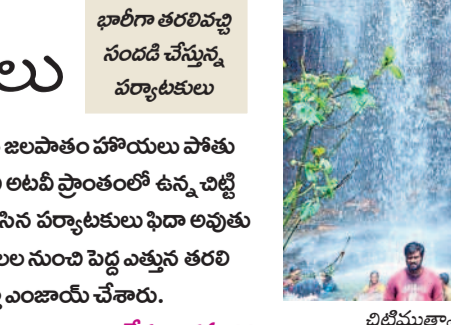
అందాలతో ఆకట్టుకుంటున్న జలపాతాలు... భారీగా తరలివచ్చి సందడి చేస్తున్న పర్యాటకులు