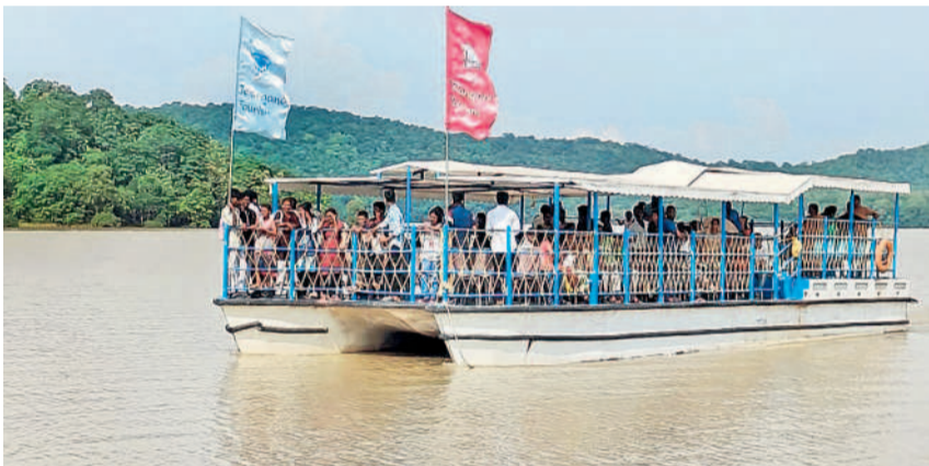
పెద్ద బోటులో లక్షవరంలో సందే సందడి... ములుగు జిల్లా గోవిందరావుపేట మండలంలోని లక్షవరం సరస్సు వద్ద పర్యాటకుల సందడి నెలకొంది.

ఎనకా పోస్టు ఖాతా... ఈకాకి ఇన్చార్జి బాధ్యతలు... 8 మంది శానిటరీ ఇన్స్పెక్టర్ల బదిలీ... ఒక్కో కుడా జాయిన్ కాలే..