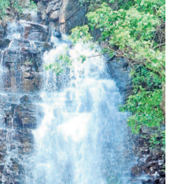
అందాలతో ఆకట్టుకుంటున్న జలపాతాలు... భారీగా తరలివచ్చి సందడి చేస్తున్న పర్యాటకులు