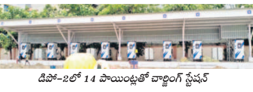
డిపో-2లో 14 పాయింట్లలో చార్జింగ్ స్టేషన్