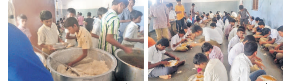
మెదక్ జిల్లా తూ.ప్రాన్ బాలుర గురుకులంలో పంట కార్మికులు లేక అన్నం వడ్డిస్తున్న విద్యార్థులు