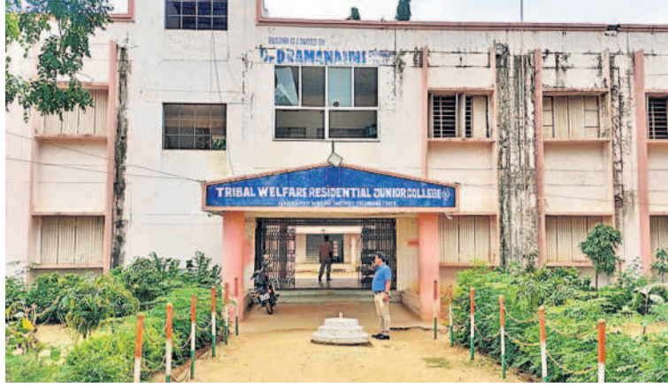
నర్సాపూర్లో ట్రిబల్ వెల్ఫేర్ రెసిడెన్షియల్ జూనియర్ కళాశాల