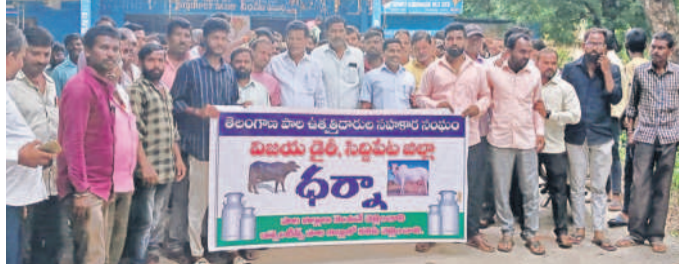
సిద్దిపేట పట్టణంలోని విజయ డెయిరీ వద్ద దర్శన చేస్తున్న పాడిదైతులు