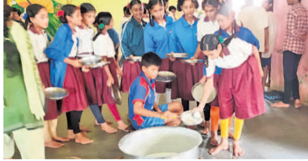
తోటి విద్యార్థులకు వడ్డిస్తున్న విద్యార్థులు