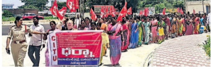
మెదక్ కలెక్టరేట్ ఎదుట దర్శన చేస్తున్న బీడీ కార్మికులు