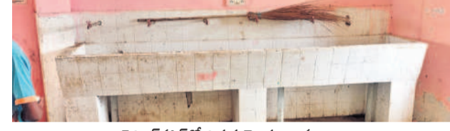
డైనింగ్ హాలులో నిరుపయోగంగా నల్లాలు