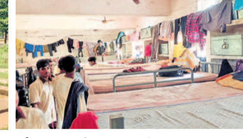
నర్సాపూర్లోని ట్రిబల్ వెల్ఫేర్ రెసిడెన్షియల్ లో ట్యాంకుల వద్ద పేరుకుపోయిన గడ్డి, మురుగు, అస్వచ్ఛంగా విద్యార్థులు నిద్రించే రూమ్, కిటికీలకు దోమతెరలు లేని దృశ్యం