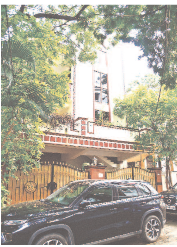
వెయ్యి కోట్ల పెట్టుబడి.. అఫీసు ఇది! తెలంగాణలో రూ. వెయ్యి కోట్ల పెట్టుబడులు పెట్టుకున్న 'స్టాప్ బయో'లోని హైదరాబాద్లోని కార్యాలయం ఇదే.

(స్విషల్ టాన్స్ బ్యూరో) హైదరాబాద్, ఆగస్టు 13 (నమస్తే తెలంగాణ): పెట్టుబడులే లక్ష్యంగా సీఎం హోదాలో కొలిసారిగా రేవంత్ రెడ్డి పది రోజుల పాటు ఆమెరికా పర్యటనకు వెళ్లారు. ఈ నెల 3న ప్రారంభమైన ఈ పర్యటనలో రూ. 31,500 కోట్ల పెట్టుబడులను సాధించినట్లు ముఖ్యమంత్రి కార్యాలయం వెల్లడించింది. 19 కంపెనీలు రాష్ట్ర ప్రభుత్వంతో కలిసి పని చేసేందుకు అవగాహన ఒప్పందాలు (ఎంవో యాలు) చేసుకున్నట్లు వివరించింది. దీంతో రాష్ట్రంలో కొత్తగా 30,750 ఉద్యోగాలు లభించనున్నట్లు తెలిపింది. అయితే, రేవంత్ ఆమెరికా పర్యటనలో భాగంగా ఎంవో యా చేసుకొన్న కంపెనీల్లో కొన్ని బోగస్ కంపెనీలు ఉన్నట్లు తెలుస్తున్నది. అంతేకాదు.. రేవంత్ బృందం ఒప్పందం చేసుకొన్న మరొకటి దిగజా కంపెనీలు ఇప్పటికే తెలంగాణలో సేవలు ప్రారంభించాయని, బీఆర్ఎస్ హయాంలోనే ఆయా కంపెనీలతో ఒప్పందాలు జరిగాయని, ఇప్పుడు అవే కంపెనీలతో సేవలు > 12వ పేజీలో