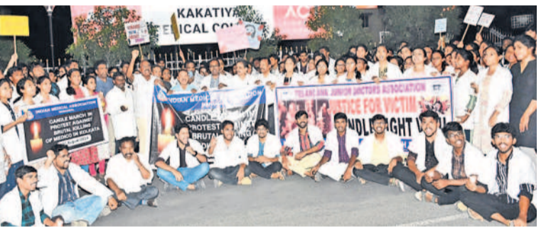
ఎంజీఎం సింబల్ లో నిరసన తెలుపుతున్న జూనియర్ డాక్టర్లు, వైద్యులు

వరంగల్ చౌరస్తా, ఆగస్టు 13 : కోల్ కాల ఆరోగ్య కేంద్రానికి అండ్ మెడికల్ కళాశాలలో వైద్య విద్యార్థులపై లైంగిక దాడి చేసే హత్య చేసిన నిందితుడిని వెంటనే ఉరితీయాలని తెలంగాణ జూనియర్ డాక్టర్ల అసోసియేషన్, తెలంగాణ డి.బి.ఎం ప్రభుత్వ వైద్యుల అసోసియేషన్, వివిధ ప్రతినిధులు డిమాండ్ చేశారు. ఈ మేరకు కేసీసీ జూని