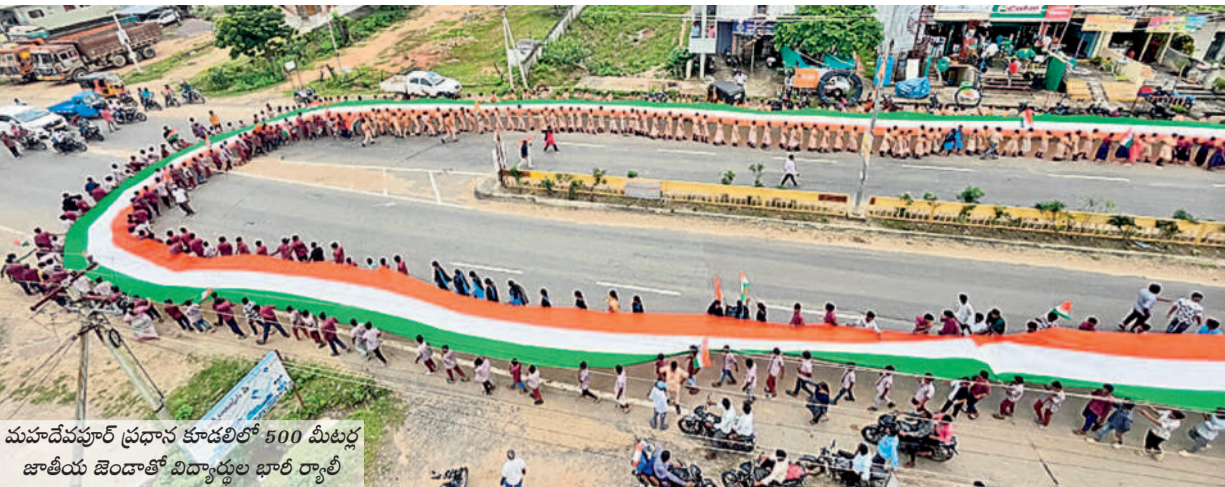
మహాదేవపూర్ ప్రధాన కూడలిలో 500 మీటర్ల జాతీయ జెండాతో విద్యార్థులు భారీ ర్యాలీ

త్రివర్ణ శోభితం మహాదేవపూర్లో 500 మీటర్ల జాతీయ జెండాతో భారీ ర్యాలీ స్వాతంత్ర్య దినోత్సవ వేడుకలను పురస్కరించుకొని మంగళవారం మహాదేవపూర్ లో 500 మీటర్ల జాతీయ జెండాతో భారీ ర్యాలీ నిర్వహించారు. ప్రభుత్వ పాఠశాలలు, డి.గ్రీ, జూనియర్ కళాశాల విద్యార్థులతో కలిసి త్రివర్ణ పతాకాన్ని ప్రధాన రహదారుల మీదుగా ప్రదర్శించిన తీరు ఆకట్టుకుంది. -మహాదేవపూర్, ఆగస్టు 13