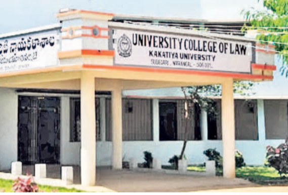
కాకతీయ యూనివర్సిటీ లా కాలేజీ