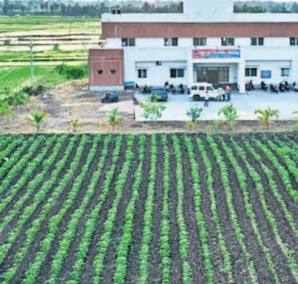
చుట్టూ పచ్చని పంట పొలాల నడుమ అభివృద్ధి కర వాతావరణంలో ఉన్న ఈ పోలీస్ ఠాణా ప్రత్యేక ఆకర్షణగా నిలుస్తోంది. జయశంకర్ భూపాలపల్లి జిల్లా టేకుమట్లలో తెలంగాణ తొలి సీఎం కేసీఆర్ సర్కారు సకల హంగులతో ఈ పోలీస్ స్టేషన్ ను నిర్మించింది. ఆ కారణం వల్లే ప్రజలలో పాటు స్నేహితుల వచ్చే వారు ప్రకృతి ఒడిలో ఉన్న ఈ స్టేషన్ ను చూసి మురిసిపోతున్నారు. పక్కనే ఉన్న మైదానంలో యువకులు, పోలీస్ సిబ్బంది సాయంత్రం వేళ ఆటలు ఆడుతూ స్వచ్ఛమైన చచ్చని గాలిని ఆస్వాదిస్తూ సరికొత్త అనుభూతి పొందుతున్నారు. - టేకుమట్ల, ఆగస్టు 13