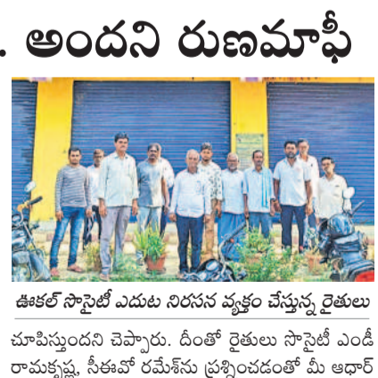
ఊకల్ సాస్ట్రో అధికారుల తప్పిదం వల్ల రుణమాఫీ అందని రైతులు

గోసుగోండ, ఆగస్టు 13 : వరంగల్ జిల్లా గోసుగోండ మండలం ఊకల్ రైతు సహకార సంఘంలో రుణం తీసుకున్న రైతులకు అధికారుల తప్పిదంతో రుణాలు మాఫీ కాలేదు. ఈ మేరకు మంగళవారం సాస్ట్రో కార్యాలయ ఆవరణలో రైతులు నిరసన వ్యక్తం చేశారు. వివరాలిలా ఉన్నాయి. ఊకల్ సాస్ట్రో పరిధిలో 13 గ్రామాల చెందిన సుమారు 3 వేల మంది సభ్యత్వం కలిగి రుణాలు తీసుకున్నారు. ఇందులో అధికారుల నిర్లక్ష్యంతో 184 మందికి రుణమాఫీ వర్తించలేదు. రుణమాఫీ తమకు ఎందుకు రాలేదని రైతులు గోసుగోండ వ్యవసాయ శాఖ కార్యాలయానికి వెళ్లి వాకలు చేయగా ఆధార్ నంబర్ తప్పగా