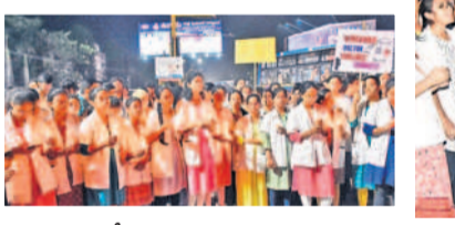
నిరసనలో పాల్గొన్న వివిధ ప్రతినిధులు