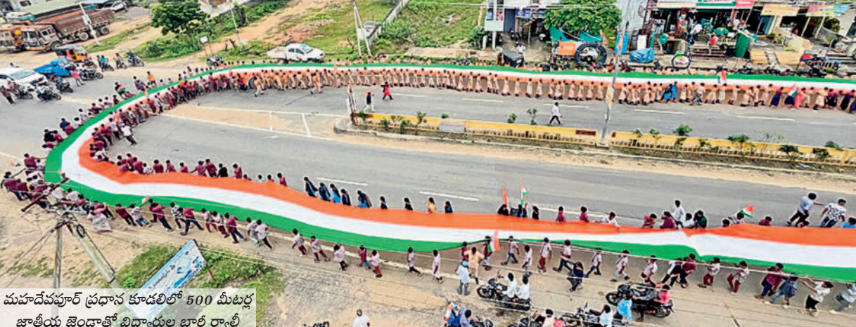
త్రివర్ణ శోభితం మహాదేవపూర్లో 500 మీటర్ల జాతీయ జెండాతో భారీ ర్యాలీ స్వాతంత్ర్య దినోత్సవ వేడుకలను పురస్కరించుకొని మంగళవారం మహాదేవపూర్ లో 500 మీటర్ల జాతీయ జెండాతో భారీ ర్యాలీ నిర్వహించారు. ప్రభుత్వ పాఠశాలలు, డి.గ్రీ, జూనియర్ కళాశాల విద్యార్థులతో కలిసి త్రివర్ణ పతాకాన్ని ప్రధాన రహదారుల మీదుగా ప్రదర్శించిన తీరు ఆకట్టుకుంది. - మహాదేవపూర్, ఆగస్టు 13