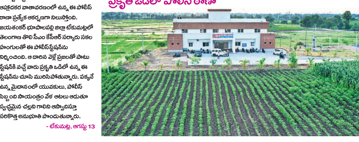
ప్రకృతి ఒడిలో పోలీస్ ఠాణా చుట్టూ పచ్చని పంట పొలాల నడుమ అభివృద్ధి చెందిన ఠాణాలో ఉన్న ఈ పోలీస్ ఠాణా ప్రత్యేక ఆకర్షణగా నిలుస్తోంది. జయశంకర్ భూపాలపల్లి జిల్లా టేకుమట్లలో తెలంగాణ తొలి సీఎం కేసీఆర్ సర్కారు సకల హంగులతో ఈ పోలీస్ ఠాణాను నిర్మించింది. ఆ దారిని వెళ్లే ప్రజలతో పాటు స్టేషన్ కి వచ్చే వారు ప్రకృతి ఒడిలో ఉన్న ఈ స్టేషన్ ను చూసి మురిసిపోతున్నారు. పక్కనే ఉన్న మైదానంలో యువకులు, పోలీస్ సిబ్బంది సాయంత్రం వేళ ఆటలు ఆడుతూ స్వచ్ఛమైన చచ్చని గాలిని ఆస్వాదిస్తూ సరికొత్త అనుభూతి పొందుతున్నారు. - టేకుమట్ల, ఆగస్టు 13

గీసుగోండ, ఆగస్టు 13 : వరంగల్ జిల్లా గీసుగోండ మండలం ఊకల్ రైతు సహకార సంఘంలో రుణం తీసుకున్న రైతులకు అధికారుల తప్పిదంతో రుణాలు మాఫీ కాలేదు. ఈ మేరకు మంగళవారం సాస్ట్రో కార్యాలయ ఆవరణలో రైతులు నిరసన వ్యక్తం చేశారు. వివరాలిలా ఉన్నాయి. ఊకల్ సాస్ట్రో పరిధిలో 13 గ్రామాల చెందిన సుమారు 3 వేల మంది సభ్యత్వం కలిగి రుణాలు తీసుకున్నారు. ఇందులో అధికారుల నిర్లక్ష్యంతో 184 మందికి రుణమాఫీ వర్తింపలేదు. రుణమాఫీ తమకు ఎందుకు రాదని రైతులు గీసుగోండ వ్యవసాయ శాఖ కార్యాలయానికి వెళ్లి వాకలు చేయగా ఆధార్ నంబర్ తప్పుగా