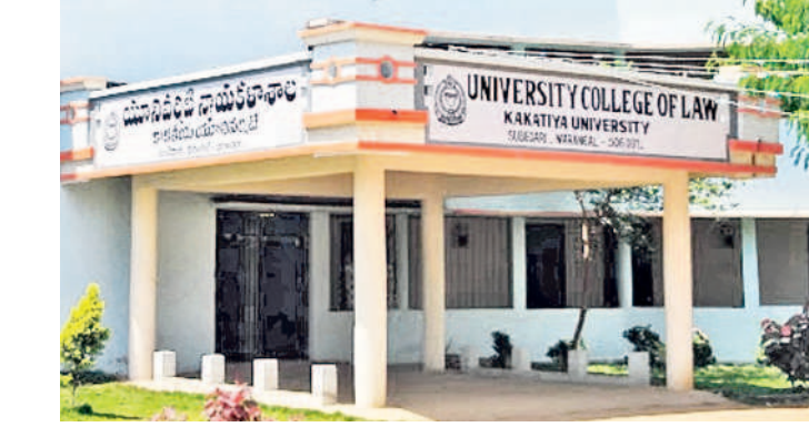
కాకతీయ యూనివర్సిటీ లా కాలేజీ