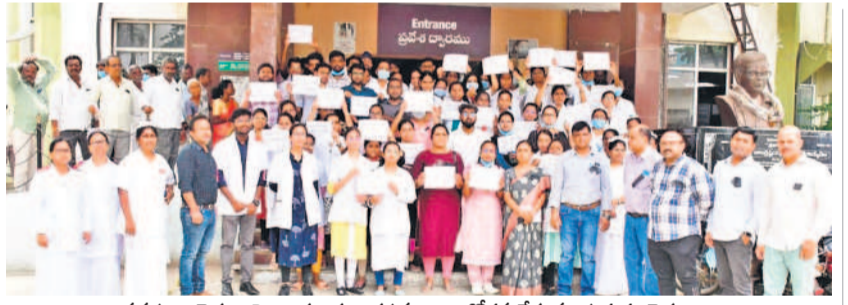
వనపర్తి : వైద్యులపై దారులకు నిరసనగా ఆందోళన చేస్తున్న ప్రభుత్వ వైద్యులు

ఫాగింగ్ యంత్రాలు మూలకు.. గ్రామ పంచాయతీలను నిధుల కొరత వేదిస్తున్నది. అభివృద్ధి సంగతి అటుంచి.. కనీసం ట్రాక్టర్ మెయింట్ టెన్షన్లలో పనులకు కూడా తీవ్ర అటంకం తలుగు తున్నది. చాలా గ్రామ పంచాయతీల్లో ఆర్థిక సమస్య కొట్టొచ్చినట్లు కనిపిస్తుంది. ఓ పైపు వేయాలన్నా.. మోటారు కాలిపోతే రిపేరు చేయాలన్నా కష్టపడుతున్నారని తెలుసుకుంటున్నాం.