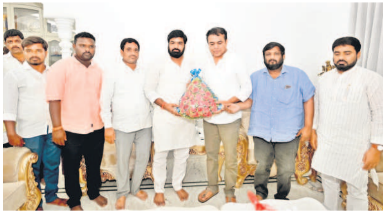
కేటీఆర్‌ను కలిసిన నడిగడ్డ హక్కుల పోరాట సమితి నాయకులు