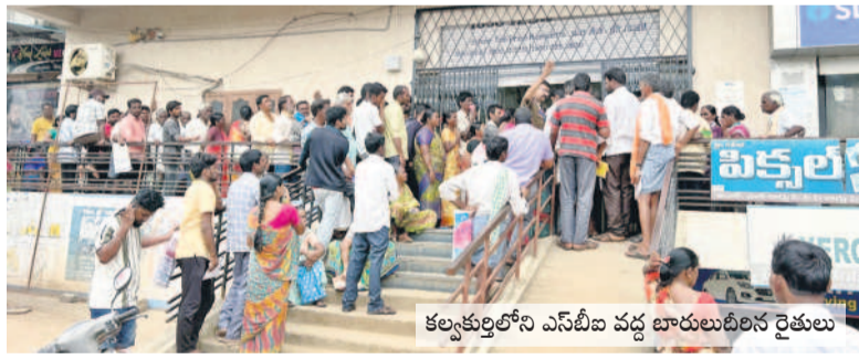
కలకత్తెలోని ఎస్‌బీఐ వద్ద బాంకులదీనిన రైతులు

కలకత్తె, ఆగస్టు 14 : ఇచ్చే వాడికి తీసుకునే వాడు లోకువ అనే నానుడి బ్యాంకుల ముందు కష్టాలు పడుతున్న రైతులకు అతిసీటు సరిపోతుంది. ప్రభుత్వం వ్యవసాయ రుణాలు మాఫీ చేస్తుందని తేలిదు ప్రకటించిన నాటినుంచి రైతులు తాము అప్పులు తీసుకున్న బ్యాంకుల ముట్టూ తిరుగుతున్నారు. గంధర్గోళ్ల పరిస్థితులు ఉండగా తమ రుణాలు మాఫీ అయ్యాయి.. లేదా అంటూ బ్యాంకుల ద్వారా సీసీఎఫ్ శివాని ద్వారా రుణమాఫీ అయిన వారు కొత్త రుణాల కోసం, రుణమాఫీ కానివారు అందుకు మాఫీ కాలేదని తెలుసుకునేందుకు, ప్రభుత్వం రైతులను ఇంజనీరింగ్ పాస్ చేయించడం పెట్టుకుంటుంది. అప్పులను ఇంజనీరింగ్ పాస్ చేయించడం పెట్టుకుంటుంది. అప్పులను ఇంజనీరింగ్ పాస్ చేయించడం పెట్టుకుంటుంది.