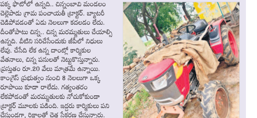
పక్కా ఫోటోలో ఉన్నది.. చిన్నంబాలి మండలం చెల్లెలపాడు గ్రామ పంచాయతీ ట్రాక్టర్. బాబులారీ చెడిపోవడంతో ఏడు నెలలుగా కడలేదంటే..

కేంద్రం నుంచి రూ.3.62 కోట్లు విడుదల గ్రామ పంచాయతీల్లో ఆర్థిక సమస్యలు పెరిగిపోతున్న క్రమంలో ప్రభుత్వం ఎట్టాటి అరకొర నిధుల విడుదలకు శ్రీకారం చుట్టింది. కేంద్రం జీపీలకు ఇచ్చిన రూ.220 కోట్లను రాష్ట్ర పంచాయతీరాజ్ ఇటీవల జీపీలకు విడుదల చేసింది. వీటిలో వనపర్తి జిల్లాకు రూ.3.62 కోట్లు వచ్చే అవకాశం ఉంది. ఈ మేరకు వచ్చిన నిధులు ఏ మూలకు కూడా సరిపోవు. రాష్ట్ర ప్రభుత్వం మాత్రం ఒక్కసారిగా ఇప్పుడుకూడా కేవలం కేంద్ర నిధులను మాత్రం కొంత మేర విడుదల చేసి పేటలు దులుపుకోంది. దీంతో తాజా మాజీ సర్దుబాటులంతా ఆవేదన వ్యక్తమవుతోంది.