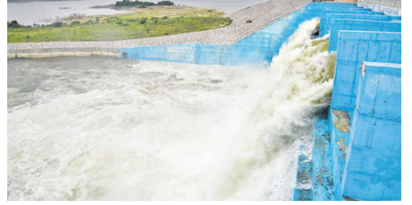
సిద్దిపేట జిల్లాలోని మల్లన్నసాగర్ లోకి పంపింగ్ అవుతున్న గోదావరి జలాలు