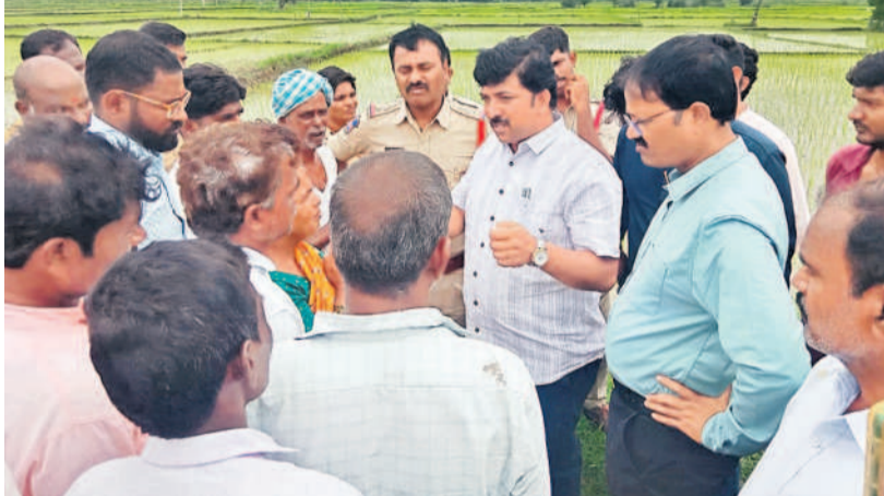
ఇటీవల ప్రీపుల్ ఆర్డర్ మెడక్ జిల్లా రెవెన్యూలో అధికారులతో వాగ్వాదానికి దిగుతున్న రైతులు

రాష్ట్ర ప్రభుత్వం 338 కిలోమీటర్ల మేర రిజిస్టర్ రింగ్ రోడ్డు నిర్మించేందుకు సిద్ధమవుతున్నది. ఉత్తర భాగంలో 158 కిలోమీటర్లు, దక్షిణ భాగంలో 175 కిలోమీటర్ల మేర ఆర్ఆర్ఆర్ నిర్మించనున్నది. ఉత్తర, దక్షిణ భాగం కలిపి సంగారెడ్డి జిల్లాలో 27.5 కిలోమీటర్ల మేర ఆర్ఆర్ఆర్ నిర్మించనున్నారు. ఇందుకోసం మొదటి సంగారెడ్డి, సదాశివపేట, కొండాపూర్, హత్తూర్ మండలాలలోని 11 గ్రామాల్లో 381.23 ఎకరాల భూమి సేకరించాలని నిర్ణయించారు. చౌటూరు మండలంలోని ఐదు గ్రామాల్లో 298.3 ఎకరాల భూమి సేకరణకు సర్వే జరిపారు. మొత్తంగా సంగారెడ్డి జిల్లాలో 659.53 ఎకరాల భూమి సేకరణకు నిర్ణయించారు. ఈ మేరకు అధికారులు సర్వే పనులు మొదలు పెట్టారు. సదాశివపేట, కొండాపూర్ మండలాలలో డిజిటల్ సర్వే పనులు మొదలు పెట్టగా రైతులు అడ్డుకుంటున్నారు. ఆర్ఆర్ఆర్ డిజైన్ మార్పుతో సంగారెడ్డి జిల్లాలో భూసేకరణ విస్తీర్ణం క్రమంగా పెరుగుతున్నది. ఇది వరకు 659.53 ఎకరాల భూమి సేకరించాల్సి ఉండగా, అధికారవర్గాల సమాచారం మేరకు భూ సేకరణ విస్తీర్ణం 853 ఎకరాలకు పెరిగి నట్లు తెలిసింది. దీంతో రైతులు ఆందోళన వ్యక్తం చేస్తున్నారు.