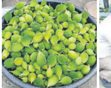
హుస్సేన్ పూర్ బోడీ కారకరాయలు, కొన్నగోలు చేస్తున్న జనం

గుడ్ల, తాగునీటి వసతి కల్పించాలని సిద్దిపేట కలెక్టర్ తెలిపారు. విద్యార్థుల కోసం పండ్ల పంటను కలెక్టర్ పరిశీలించారు. ఈ సందర్భంగా కలెక్టర్ మాట్లాడుతూ.. విద్యార్థులు ఎలాంటి అసౌకర్యాలకు గురైనా తన దృష్టికి తీసుకురావాలన్నారు. ప్రతి ఒక్క బుద్దవారం సిద్దిపేట అర్బన్ మండలం ఎన్ఎస్పిల్ లోని తెలంగాణ సాంఘిక సంక్షేమ బాలికల గురుకుల పాఠశాలను సందర్శించారు. ఆ మేరకు పాఠశాలలో ఏమైనా సమస్యలు ఉన్నాయో.. అని అలా అడగారు. పాఠశాల చుట్టూ ప్రహారీ లేక కక్కలు, పంటలు లోపలికి వస్తున్నాయని, విద్యార్థులకు సరదా మరు