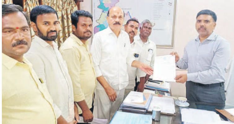
ప్రిపుల్ ఆర్డర్ మంగళవారం సంగారెడ్డి కలెక్టరేట్ లో రైతులతో కలిసి అదనపు కలెక్టరీకు వినతిపత్రం అందజేస్తున్న ఎమ్మెల్యే బిఠూరు ప్రభాకర్