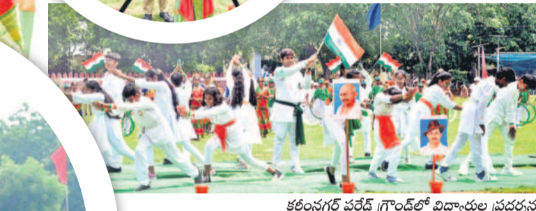
కరీంనగర్ పరేడ్ గ్రౌండ్లో విద్యార్థుల ప్రదర్శన