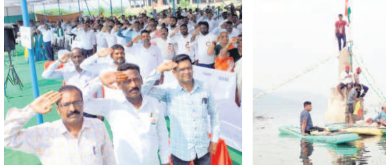
జగిత్యాలలో జెండాకు వందనం చేస్తున్న ప్రజలు