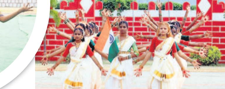
పెద్దపల్లిలో విద్యార్థుల సత్య ప్రదర్శన