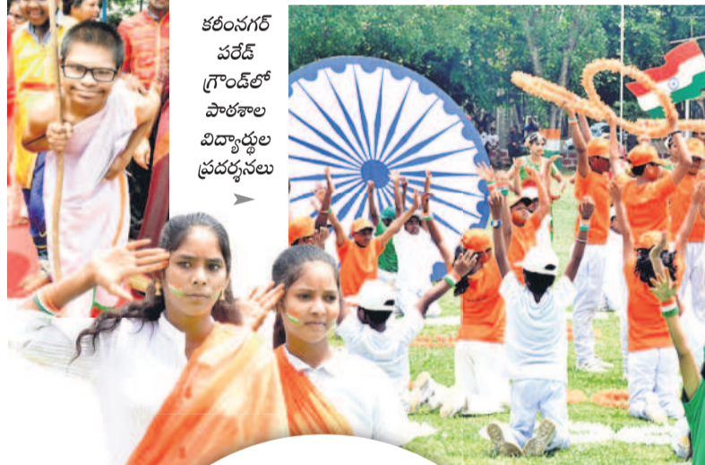
కరీంనగర్ పరేడ్ గ్రౌండ్లో పాఠశాల విద్యార్థుల ప్రదర్శనలు