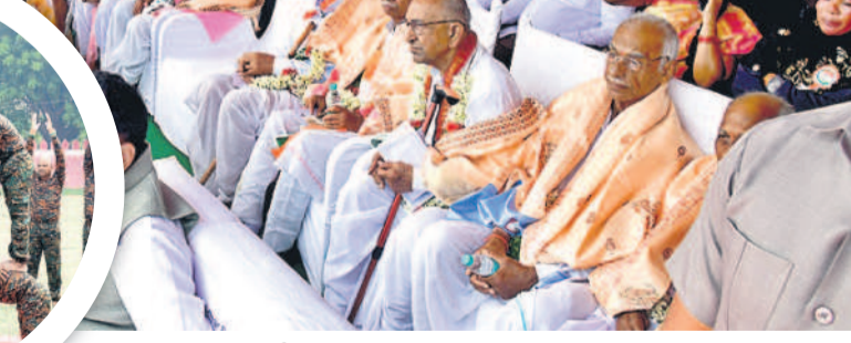
కరీంనగర్ పరేడ్ గ్రౌండ్లో వేడుకలను తిలకిస్తున్న స్వాతంత్ర్య సమరయోధులు, నగరవాసులు