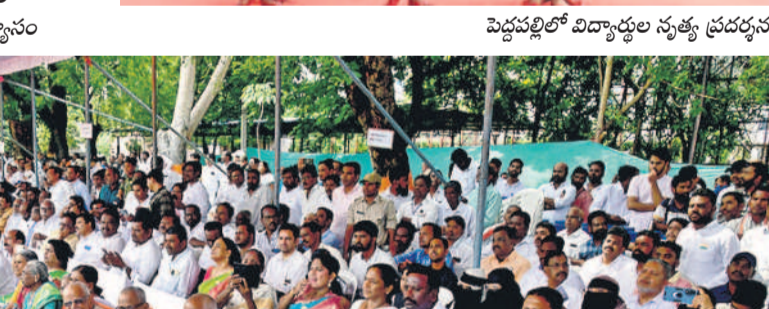
కరీంనగర్ పరేడ్ గ్రౌండ్లో వేడుకలను తిలకిస్తున్న స్వాతంత్ర్య సమరయోధులు, నగరవాసులు