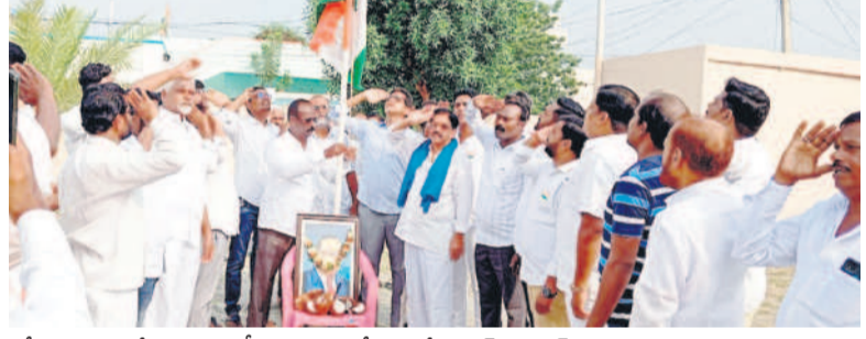
కోర్కట్ల : ఎమ్మెల్యే కాంత్ ఆఫీసు ఆవరణలో ఎమ్మెల్యే డాక్టర్ సంజయ్ కల్వకుంట్ల జెండా వందనం