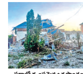
ఉక్రెయిన్ ఆధీనంలో రష్యా పట్టణం

మిలిటరీ కార్యాలయం ఏర్పాటు ప్రకటించిన అధ్యక్షుడు జెలెన్స్కీ కీవ్, ఆగస్టు 15: ఉక్రెయిన్ యుద్ధం కీలక మలుపు తిరిగింది. రష్యా భూభాగంలోని కర్కూ ప్రాంతంలో ఉన్న సడ్యా పట్టణాన్ని తమ బలగాలు పూర్తిగా ఆధీనంలోకి తీసుకున్నాయని ఉక్రెయిన్ అధ్యక్షుడు జెలెన్స్కీ గురువారం ప్రకటించారు. ఈ పట్ల బిల్లు దాదాపు 5,000 జనాభా ఉన్నారు. పశ్చిమ సైబీరియా చమురు నిక్షేపణ నుంచి ప్రపంచవే ప్రైవేట్లకు ఈ ప్రాంతంలోనే ఉన్నాయి. సడ్యా పట్టణంలో ఉక్రెయిన్ సైనిక కమాండర్ కార్యాలయాన్ని ఏర్పాటు చేస్తున్నట్లు జెలెన్స్కీ ప్రకటించారు. కాగా, జనపరి సుంచి ఉక్రెయిన్లో 1.175 వార్డుల కిలో మీటర్ల భూభాగాన్ని రష్యా ఆక్రమించగా, ఇప్పుడు మొదటిసారిగా రష్యా భూభాగంలోని దాదాపు 800 చదరపు కిలోమీటర్ల