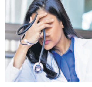
ఎన్ఎస్ఐ చేసిన కీలక ప్రతిపాదనలు

న్యూఢిల్లీ, ఆగస్టు 15: వైద్య విద్యార్థులు విపరీతమైన ఒత్తిడితో బాధపడుతున్నారని, మానసిక సమస్యలు బారిన పడుతున్నారని జాతీయ మెడికల్ కమిషన్ (ఎన్ఎస్ఐ) నివేదిక పేర్కొన్నది. ప్రతి నలుగురు ఎంబీబీఎస్ విద్యార్థుల్లో ఒకరు మానసిక సమస్యలు ఎదుర్కొంటున్నారని, ప్రతి ముగ్గురు వీజీ విద్యార్థుల్లో ఒకరిలో అత్యుత్సాహ ఆలోచనలు కూడా వచ్చాయని తెలిపింది. ఎన్ఎస్ఐ ఏర్పాటుచేసిన 'నేషనల్ టాన్స్పోర్ట్ ఫర్ మెంటల్ హెల్త్ అండ్ వెల్ఫేర్' వైద్య విద్యార్థులపై ఏప్రిల్ 28 నుంచి మే 8 వరకు ఒక ఆన్లైన్ సర్వే నిర్వహించింది. ఇందులో 25,590 మంది అందరే గ్రాహ్యుడే, నెట్ ఉన్నారని కానీ సిబ్బంది కొరత తీవ్రంగా ఉన్నాడని తెలిపింది. 2018లో • చెసిడెంట్ డాక్టర్ల వారానికి 74 గంటల కంటే ఎక్కువ పని చేయించారు. వారానికి ఒక రోజు కచ్చితంగా సెలవు తీసుకోవాలి. • వైద్య విద్యార్థులు సెలవు అడిగినప్పుడు పరిణామాల్లోకి తీసుకోవాలి. అకారణంగా తిరస్కరించొద్దు. • వీజీ విద్యార్థులు, ఇంటర్నీ ప్రధానంగా అభ్యసించడానికి ఉన్నారని కానీ సిబ్బంది కొరత తీవ్రంగా ఉన్నాడని తెలిపింది. • విద్యార్థులపై ఒత్తిడి, ఆందోళన తగ్గించడానికి సమీపంలో టర్నింగ్ నిర్వహణను ఆమలు చేయాలి. • యూజీ, వీజీ నిలబెట్టే మానసిక వైద్య విద్యను సైకం బాగా చేయాలి. పర్మిషన్లు, సదస్సులు నిర్వహించాలి. • మానసిక ఒత్తిడిని అధిగమించేందుకు విద్యార్థులకు యోగా తరగతులు, ప్రజలు నిర్వహించాలి.