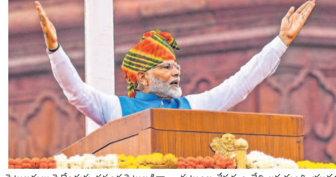
పెట్టుబడులు పెట్టేందుకు ప్రపంచ పెట్టుబడిదారులు ఆసక్తి చూపిస్తున్నారని, రాష్ట్రాలు సుప్రసిద్ధ మైన విద్యానాల రూపొందించి పెట్టుబడులను ఆకర్షించాలని సూచించారు. పెట్టుబడులు ప్రచారం కల్పించాలని ప్రధాని మోదీ పేర్కొన్నారు. అడవాల్ల దారుణాలకు పాల్పడితే అరెస్టు చేయాలని ప్రధాన మంత్రి పేర్కొన్నారు. అడవాల్ల దారుణాలకు పాల్పడితే అరెస్టు చేయాలని ప్రధాన మంత్రి పేర్కొన్నారు. అడవాల్ల దారుణాలకు పాల్పడితే అరెస్టు చేయాలని ప్రధాన మంత్రి పేర్కొన్నారు.

న్యూఢిల్లీ, ఆగస్టు 15: దేశంలో లాక్ష్మీక పౌరస్మృతి తక్షణ అవసరమని ప్రధాన మంత్రి నరేంద్ర మోదీ పేర్కొన్నారు. గురువారం న్యూఢిల్లీలోని ఎలక్ట్రోలిట్ 78వ స్వాతంత్ర్య దినోత్సవ వేడుకల్లో ఆయన జాతీయ జెండాను ఎగురవేశారు. అనంతరం ఆయన ప్రసంగిస్తూ.. 'ఇప్పుడు ఉన్న పౌరస్మృతి మతపరమైన పౌరస్మృతి అని సమాజంలోని ఎక్కువ మంది నమ్ముతున్నారు. ఇందులో నిజం ఉంది. మనం 75 ఏండ్లు మతపరమైన పౌరస్మృతితో జీవింపాం. వివక్షను ప్రోత్సహించే పౌరస్మృతితో జీవింపాం. ఇది దేశాన్ని మతప్రాతిపదికన విభజించడంతో పాటు ఆన మానవతలను ప్రోత్సహిస్తున్నది. ఇప్పుడు మనం లాక్ష్మీక పౌరస్మృతి దిశగా పయనం చేస్తున్నాం. దేశానికి లాక్ష్మీక పౌరస్మృతి తక్షణ అవసరం. రాజ్యాంగం సూర్య కుడా ఇది. సుప్రీంకోర్టు కూడా దీని అవసరాన్ని ఆసక్తిగా సాధ్యం చేసింది. రాజ్యాంగం నిర్మాతల కలను నిరవేల్చింది.' అని పేర్కొన్నారు. బంగ్లా దేశ్ ముఖ్యమంత్రి ఆయన ప్రస్తావనపై ఆ దేశంలోని లాక్ష్మీక పౌరస్మృతి అభివృద్ధికి పట్టణ 140 కోట్ల మంది భారతీయులు ఆందోళనతో ఉన్నారు. దేశంలో తరచూ ఎన్నికలు జరుగుతుండటం వల్ల అభివృద్ధికి అటంకం ఏర్పడుతున్నదని, జమిలి ఎన్నికలకు రాజకీయ పార్టీలు ముందుకు రావాలని ఆయన కోరారు. మహిళలపై అక్రమాలకు పాల్పడే వారికి వీడియో ఇచ్చి అరెస్టు చేయాలని ప్రధాన మంత్రి పేర్కొన్నారు. అడవాల్ల దారుణాలకు పాల్పడితే అరెస్టు చేయాలని ప్రధాన మంత్రి పేర్కొన్నారు. అడవాల్ల దారుణాలకు పాల్పడితే అరెస్టు చేయాలని ప్రధాన మంత్రి పేర్కొన్నారు. అడవాల్ల దారుణాలకు పాల్పడితే అరెస్టు చేయాలని ప్రధాన మంత్రి పేర్కొన్నారు.