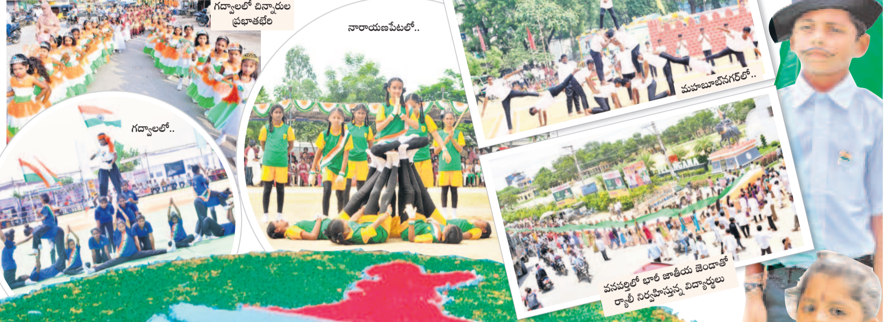
గద్వాలలో విద్యార్థుల ప్రభాతభేరి