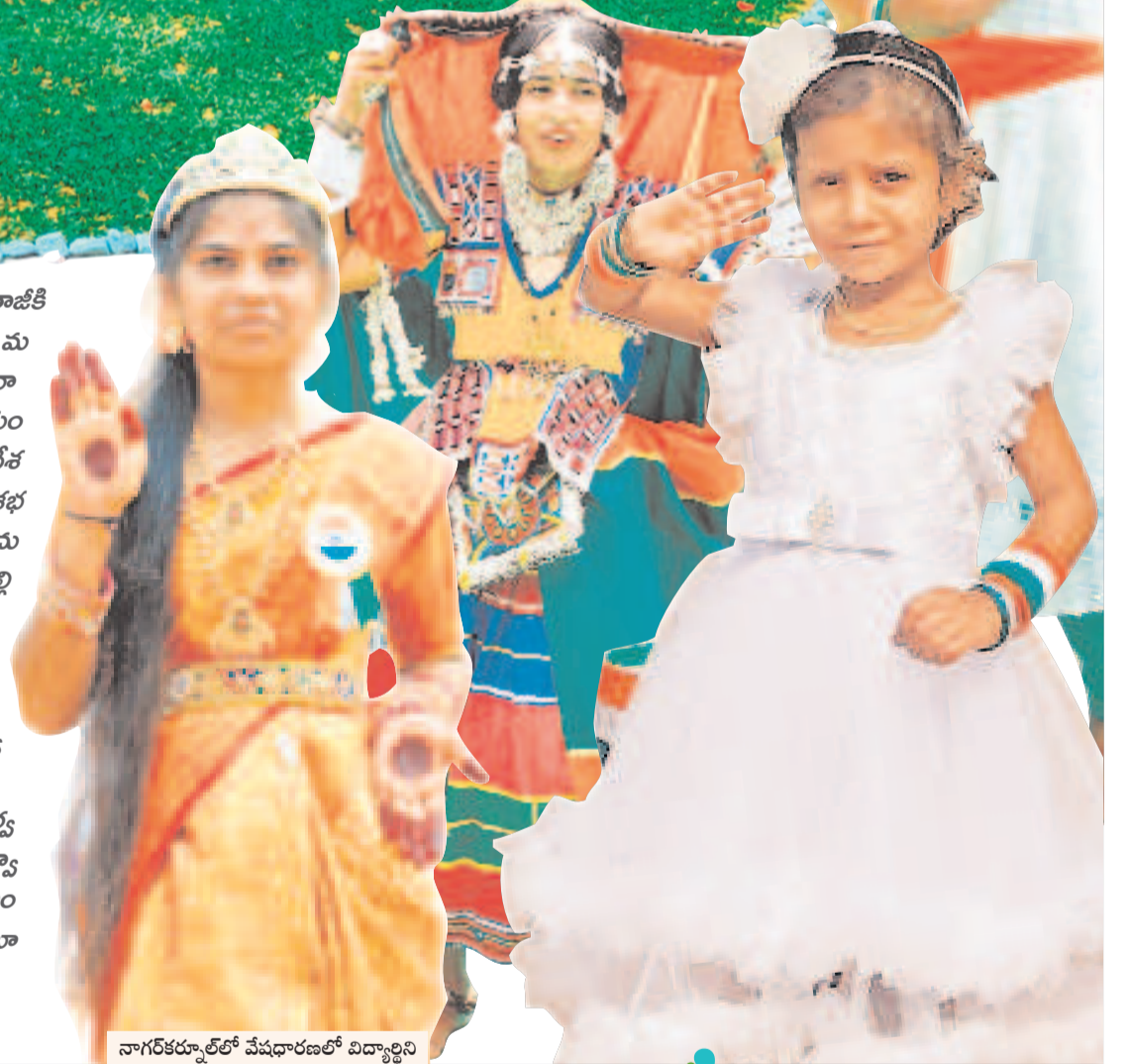
నాగర్ కర్నూల్ లో వేషధారణలో విద్యార్థులు