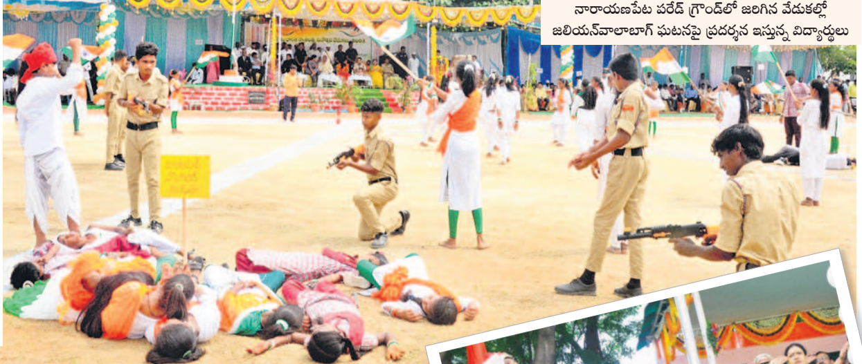
నారాయణపేట పరేడ్ గ్రౌండ్లో జరిగిన వేడుకల్లో జలియన్ వాలాబాగ్ ఘటనపై ప్రదర్శన ఇస్తున్న విద్యార్థులు