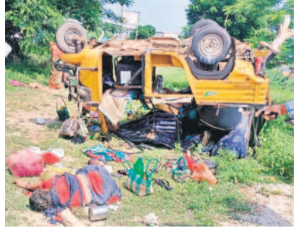
లారీ ఢీకొనడంతో బోల్తా పడిన ఆటో