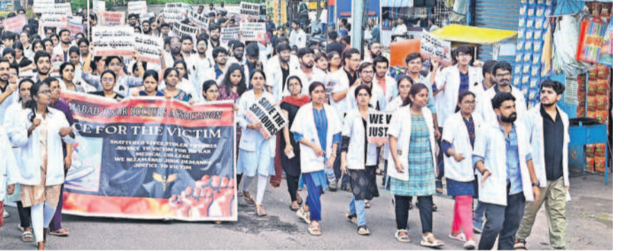
కోరికతా మతుకు నిరసనగా నిజామాబాద్ జిల్లా కేంద్రంలో శుభ్రవారం ఆంధోళ్లనే చేస్తున్న జూనియర్ డాక్టర్లు