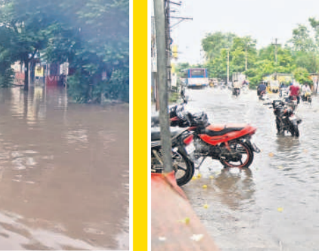
నిజామాబాద్ జిల్లా కేంద్రంలో జలమయమైన రోడ్లు