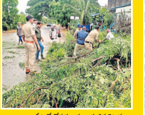
రాజంపేటలో రోడ్లకు అడ్డంగా కూలిన చెట్టును తొలగిస్తున్న పోలీసులు, యువకులు

ఉమ్మడి జిల్లాలో శుభ్రవారం భారీ వర్షం కురిసింది. ఉదయం నుంచి ఆకాశం మేఘావృతం కాగా..మధ్యాహ్నం నుంచి రాత్రి వరకు తుపానుగాలులతో కూడిన వర్షం కురిసింది. దీంతో జిల్లా కేంద్రాల్లోని రోడ్లు జలమయమయ్యాయి. కామారెడ్డి పట్టణంలోని పలు రోడ్లు చెరువులను తలపించాయి. దీంతో వాహనదారులు తీవ్ర ఇబ్బందులు పడ్డారు. రాజంపేట మండల కేంద్రంలో వర్షానికి రోడ్లకు అడ్డంగా ఓ వేవ చెట్టు విరిగి పడగా.. పోలీసులు స్థానిక యువకుల సాయంతో తొలగించారు.