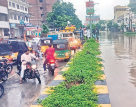
కామారెడ్డి జిల్లా కేంద్రంలో కాలుషయ తలపిస్తున్న రోడ్లు