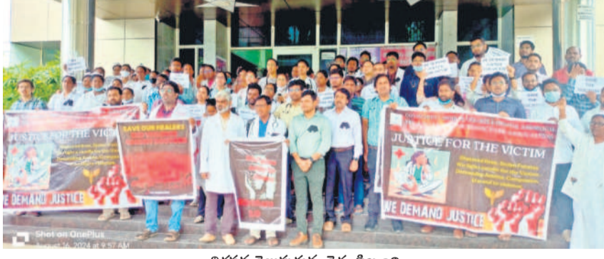
నిరసన తెలుపుతున్న వైద్య సిబ్బంది

కరీంనగర్, ఆగస్టు 16 (నమస్తే తెలంగాణ): దిగువ మానేరు జలాశయం (ఎల్ఎండీ) దయనిల స్థితికి చేరింది. దీని పూర్తి నీటి నిల్వ సామర్థ్యం 24.034 టీఎంసీలు కాగా, ప్రస్తుతం 5.449 టీఎంసీల నీరు మాత్రమే ఉన్నది. గతేడాది ఇదే సమయానికి 23 టీఎంసీల నీరు ఉన్నది. పోయిన అధిక వర్షాలతో మోయతున్న వాగు నుంచి 1,500 క్యూసెక్కుల వచ్చింది. ఇప్పుడూ పరిస్థితి లేదు. జలాశయం డెడ్ స్టోర్జి 9 టీఎంసీలు కాగా, అందులో 2.4 టీఎంసీలు మాత్రమే ఉన్నాయి. ఇవి కూడా కరీంనగర్, వరంగల్ సర్కలతోపాటు మిషన్ భగీరథ కింద కరీంనగర్ జిల్లాలోని మూడు నియోజకవర్గాలు, సిద్దిపేట పట్టణ తాగునీటి అవసరాలతో సరిపోతున్నాయి. ఈ నేపథ్యంలో జలాశయంలో నీటిపట్టు పెరిగితే గానీ, సాగునీటి కోసం వాడుకనే అవకాశం లేదు. ఎల్లంపల్లి ద్వారా ఎత్తిపోతలతో మధ్యమానేరు నింపుతున్న అధికారులు ఎల్ఎండీకి ఇప్పటి వరకు నీటిని విడుదల చేయాలనే ఆలోచన చేయడం లేదు. గత నెల 27 నుంచి మధ్య మానేరు నీటిని ఎత్తిపోస్తున్నారు. ఇప్పటి వరకు 14 టీఎంసీలకు పైగా నీటిని తరలించిన అధికారులు, అటు నుంచి అన్నపూర్ణ, సిద్దిపేటలోని రంగారాయకసాగర్ రిజర్వాయర్లకు 6,462 క్యూసెక్కుల నీటిని విడుదల చేస్తున్నారు. కానీ, ఎల్ఎండీకి నీటిని తరలించే విషయంలో తాత్కాలికం చేస్తున్నారు. వర్షాలు కురుస్తున్న ప్రస్తుత పరిస్థితిలోనే నీటిని తరలిస్తే పంటలకు అవసరమైనప్పుడు నీటిని విడుదల చేసుకోవచ్చని రైతులు భావిస్తున్నారు. ఆగస్టు, సెప్టెంబర్లో వర్షాలు పడితే రిజర్వాయర్లకు శ్రీరాసాగర్ ప్రాజెక్టు ద్వారా నీటిని విడుదల చేస్తామని అధికారులు చెబుతున్నట్లు తెలుస్తుండగా, ఒక వేళ వర్షాలు పడకపోతే తమ పరిస్థితి ఎంటని దిగువ మానేరు ఆయకట్టు రైతులు ప్రశ్నిస్తున్నారు.