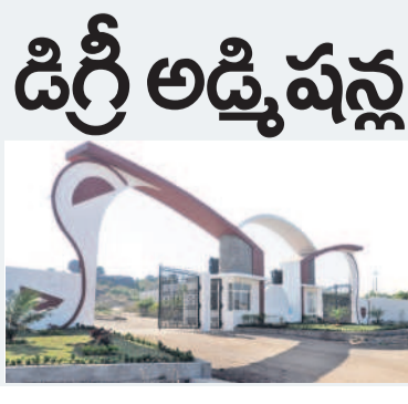
డిగ్రీ అడ్మిషన్ల జాడేది?

శాతవాహన యూనివర్సిటీ పరిధిలో డిగ్రీ అడ్మిషన్ల కోరు తగ్గడంతో పలు కళాశాలల యాజమాన్యాల తలలు పట్టుకుంటున్నాయి. యూనివర్సిటీ స్థాయిలో దాదాపు 80 వరకు ప్రైవేటు కళాశాలలు ఉండగా, పడుల సంఖ్యలో కళాశాలలకు అదే పడుల సంఖ్యలో అడ్మిషన్లు వచ్చినట్లు తెలుస్తున్నది. అయితే, సాంకేతిక విద్యకు ఆదరణ పెరగడంతో డిగ్రీ విద్యకు తగ్గుతుందని పలువురు అభిప్రాయం వ్యక్తం చేస్తున్నారు.