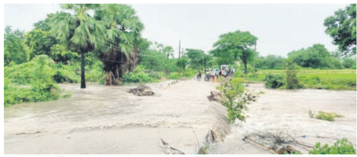
బోయినపల్లి : వేములవాడ వెళ్లే దారిలో వంతెన పైనుంచి వెళ్తున్న వరద