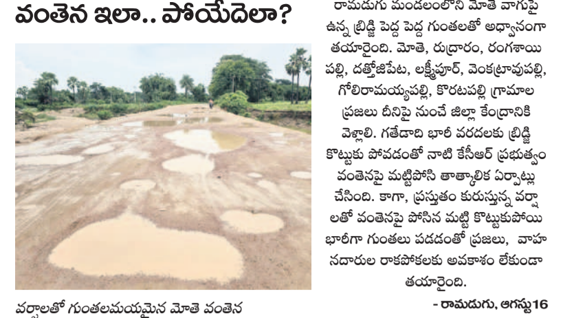
వంతెన ఇలా.. పోయేదెలా?