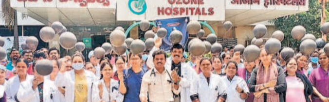
నల్ల లక్ష్మణుని దరఖాస్తు చేసిన వ్యక్తం చేస్తున్న డాక్టర్లు, సిబ్బంది

దన్నారు. నిందితులను కఠినంగా శిక్షించాలని, ఇలాంటి పునరావృతం కాకుండా ఉండాలంటే నిందితులను బహిరంగంగా ఉరి తీయాలన్నారు. ప్రభుత్వం వైద్యుల మీద యంత్ర ప్రత్యేక చట్టాలను చేసి వైద్యులకు రక్షణ కల్పించాలన్నారు. కార్యక్రమంలో వైద్యులు, జూనియర్ డాక్టర్లు, సిబ్బంది పాల్గొన్నారు.