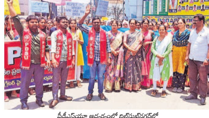
మేడిపనూరు ఆధ్వర్యంలో బిల్డింగ్ సర్కిల్లో నిరసన ర్యాలీ నిర్వహిస్తున్న సినద్దా మహిళా కళాశాల విద్యార్థులు