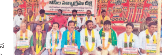
సత్కారానికి డిజిటలైజేషన్ ప్రాంతంబిందారు