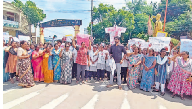
మన్యూరాబాద్ : నివాసాలు చేస్తున్న సర్పంచి కళాశాలల విద్యార్థులు