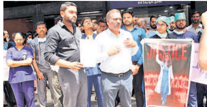
మలక్పేట యశోద దవాఖానలో ఓజీ సేవలను బహిష్కరించిన వైద్యులు