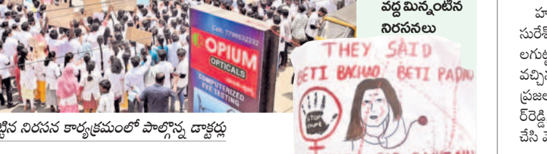
కేఎంసీ వద్ద చేపట్టిన నిరసన కార్యక్రమంలో పాల్గొన్న డాక్టర్లు

వరంగల్ చౌరస్తా, ఆగస్టు 17 : కోల్ కతాలో వైద్య విద్యార్థిని హత్యకారకు ఘటనపై శనివారం ఉమ్మడి జిల్లావ్యాప్తంగా నిరసనలు వెల్లువెత్తాయి. నిందితులను కఠినంగా శిక్షించి, ప్రాణం పోనీ వైద్యులకు రక్షణ కల్పించాలని డిమాండ్ చేస్తూ జూనియర్, సీనియర్ వైద్యులు రోడ్డు రాల్పాలి, రాస్తాలోకోలు చేయగా తెలంగాణ ప్రభుత్వ వైద్యుల అసోసియేషన్, ఐఎంఐ, తెలంగాణ ఆస్తులాలజీ అసోసియేషన్ సభ్యులు, సీఎం వైద్యుల డాక్టర్లు, నర్సింగ్ అసోసియేషన్, ప్రభుత్వ ప్రైవేట్ మెడికల్ కళాశాలల విద్యార్థులు మద్దతు తెలిపారు. ఈ సందర్భంగా కేఎంసీ, ఎంజీఎం ప్రధాన కూడలిలో పెద్దపట్టున నిరాదాలు చేశారు.