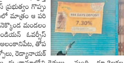
ఇండియన్ ఓపెన్ బ్యాంక్ - అలంకారిపేట శాఖ

నర్సంపేట, ఆగస్టు 17 : రైతు రుణమాఫీ పూర్తి స్థాయిలో చేశామని కాంగ్రెస్ ప్రభుత్వం గొప్పలు చెబుతున్నా. క్షేత్రస్థాయిలో మాత్రం ఆ పరిస్థితి లేదు. వరంగల్ జిల్లా నెక్కొండ మండలం అలంకారిపేట గ్రామం ఇండియన్ ఓపెన్ బ్యాంకు (ఐవోబీ) పరిధిలో అలంకారిపేట, తోప నపెల్లి, బొట్టికొండ, పెద్దకోల్వాయి, రెడ్డానాయక్ తండా గ్రామాలు ఉన్నాయి. ఈ గ్రామాలలోని రైతులు 2018 తర్వాత 1270మంది రుణాలు తీసుకున్నారు. వీరిలో రూ.లక్షలలోపు 700 మంది, రూ.లక్షలలోపు 350మంది, రూ.2లక్షల లోపు 170మంది రుణాలు తీసుకున్నారు. వీరిలో ఇప్పటివరకు కేవలం 384మంది రైతులకు మాత్రమే రుణమాఫీ కాగా, 886 మందికి అర్హత ఉన్నా కాలేదు. రూ.లక్ష, రూ.లక్షలలోపు 320