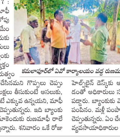
కమలాపురలో ఏవో కార్యాలయం వద్ద రుణమాఫీపై ఏవో నిలదీస్తున్న రైతులు

కమలాపుర, ఆగస్టు 17 : రెండు లక్షల రుణమాఫీ అన్నరు. అక్షా 99వేలలోపు వారితో మాఫీ చేసినం.. మేమేం పాపం చేసినం.. మాకేమీ రుణమాఫీ కాలేదంటూ రైతులు వ్యవసాయాధికారులు, బ్యాంకు అధికారులపై ఆగ్రహం వ్యక్తం చేస్తున్నారు. కాంగ్రెస్ ప్రభుత్వం రెండు లక్షల రుణమాఫీ చేసినమని గొప్పలు చెప్పుతుంది. క్రాఫ్ లోనే రెండు లక్షలు తీసుకుంటే అసలుకు, మిక్కిలి రెండు లక్షల కంటే ఎక్కువ ఉన్నయిన, మాఫీ వర్తించలేదని అధికారులు చెప్పుతున్నారు. ఇది బ్యాంకు అధికారుల తప్పిదమా? మాకేమీ రుణమాఫీ రాలేదని అధికారులను నిలదీస్తున్నారు. శనివారం ఒక రోజు