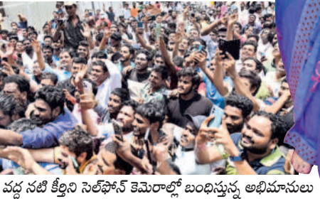
షోరూం వద్ద సటి కీర్తిని సెలెబ్రిటీ కెమెరాల్లో బంధిస్తున్న అభిమానులు