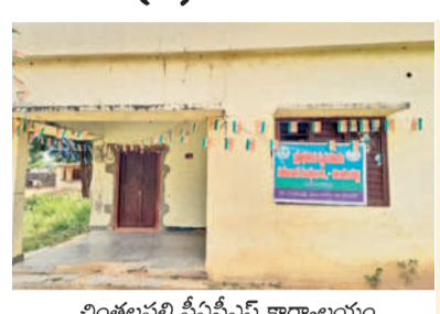
చింతలపల్లి పీఏసీఎస్ కార్యాలయం

వరంగల్, ఆగస్టు 17 (నమస్తే తెలంగాణ) : రాష్ట్ర ప్రభుత్వం రూ.2 లక్షల రుణమాఫీని మూడు విడుదలలుగా ప్రకటించినా వరంగల్ జిల్లాలోని అనేక గ్రామాల్లో అత్యధిక మంది రైతులకు వర్తించలేదు. కొన్ని ప్రాథమిక వ్యవసాయ సహకార సంఘాల (పీఏసీఎస్)ల పరిధిలో వంద శాతం మంది రైతులు మాఫీని పొందలేకపోయారు. జాతీయ బ్యాంకుల నుంచి రుణం పొందిన కొద్ది మందికి మాత్రమే మాఫీ వర్తించింది. ఇలాంటి గ్రామాల్లో సంగం మండలంలోని చింతలపల్లి ఒకటి. చింతలపల్లి కేంద్రంగా పనిచేస్తున్న పీఏసీఎస్ పరిధిలో చింతలపల్లి, పల్లారగుడ, మొండ్రాయి, కుంటపల్లి, కృష్ణానగర్ గ్రామాలుండగా, వాటిలోని 644 మంది రైతులు 2016, 2017లో సుమారు రూ.3.77 కోట్ల రుణాలు పొందారు. ఆ తర్వాత వీరి రుణాలను అధికారులు రెన్యూవల్ చేయకపోవడంతో రుణమాఫీకి వారు అర్హులు కాలేదు.