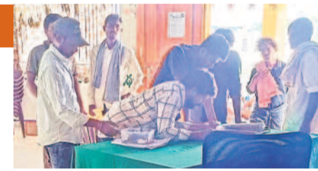
నర్సింహపేటలో రుణమాఫీ పేర్ల చూసుకుంటున్న రైతులు

హనుమకొండ సబర్బన్, ఆగస్టు 17 : రైతులందరికీ పంట రుణాలు మాఫీ చేశామని ప్రభుత్వం డంకా బజాయింది మరీ చెబుతున్నా. క్షేత్ర స్థాయిలో ఆ పరిస్థితి లేదు. రుణమాఫీకి సంబంధించి బ్యాంకుల నుంచి తమకు ఎలాంటి సమాచారం రాలేదని వారూ మాఫీ అన్నదాతలు చెబుతున్నారు. హనుమకొండ జిల్లాలో 1,46,184 మంది రైతులు ఉన్నారు. వీరిలో మూడో విడుదలలో 9,506 మందికి రూ.122.49 కోట్లు, రెండో విడుదలలో 14,700 మందికి రూ.143.84 కోట్లు, మొదటి విడుదలలో 25,991 మందికి రూ.141.98 కోట్లు, మొత్తం 49,597 మందికి రుణాలు మాఫీ చేసి నట్లు ప్రభుత్వం అధికారికంగా లెక్కలు విడుదల చేసింది. కాగా,