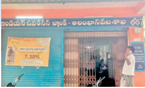
ఇండియన్ ఓపెన్ బ్యాంక్ - అలంకారిపేట శాఖ

అలంకారిపేటలో అస్తవ్యస్తం.. అలంకారిపేట లోని ఐ.ఓ.ఓ బ్యాంకు 1270 మంది రైతులకు 384 మందికే రుణమాఫీ సర్పంచే, ఆగస్టు 17 : రైతు రుణమాఫీ పూర్తి స్థాయిలో చేశామని కాంగ్రెస్ ప్రభుత్వం గొప్పలు చెబుతున్నా. క్షేత్రస్థాయిలో మాత్రం ఆ పరిస్థితి లేదు. వరంగల్ జిల్లా నెక్కొండ మండలం అలంకారిపేట గ్రామం ఇండియన్ ఓపెన్ బ్యాంకు(ఐ.ఓ.ఓ) వరదీలో అలంకారిపేట, తోప నపెల్లి, బొల్లికొండ, వెడ్లకొల్లూరు, రెడ్డానాయక్ తండా గ్రామాలు ఉన్నాయి. ఈ గ్రామాలలోని రైతులు 2018 తర్వాత 1270మంది రుణాలు తీసుకున్నారు. వీరిలో రూ.లక్షలోపు 700 మంది, రూ.లక్షన్నర లోపు 850మంది, రూ.2లక్షల లోపు 170మంది రుణాలు తీసుకున్నారు. వీరిలో ఇప్పటివరకు కేవలం 384మంది రైతులకు మాత్రమే రుణమాఫీ కాగా, 886 మందికి అర్హత ఉన్నా కాలేదు. రూ.లక్ష, రూ.లక్షన్నర లోపు 320