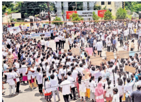
తేలంపే వద్ద చేపట్టిన నిరసన కార్యక్రమంలో పాల్గొన్న డాక్టర్లు