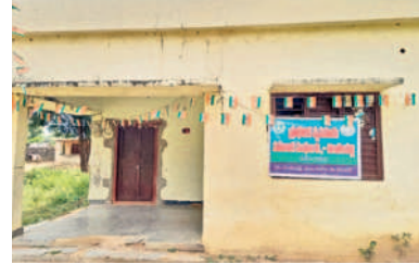
చింతలపల్లి పీఏసీఎస్ కార్యాలయం