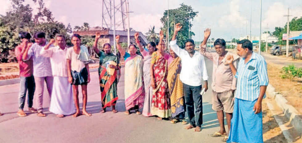
ఏటూరునాగారం : జాతీయ రహదారిపై నిరసన తెలుపుతున్న చిన్నదోయినపల్లి రైతులు