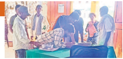
నర్సింహపాలెంలో రుణమాఫీ పేర్లు చూసుకుంటున్న రైతులు

హనుమకొండ జిల్లాలో లక్ష మందికి కాల్.. హనుమకొండ సబర్బన్, ఆగస్టు 17 : రైతులందరికీ పంట రుణాలు మాఫీ చేశామని ప్రభుత్వం డంకా బజాయింది మరీ చెబుతున్నా. క్షేత్ర స్థాయిలో ఆ పరిస్థితి లేదు. రుణమాఫీకి సంబంధించి బ్యాంకుల నుంచి తమకు ఎలాంటి సమాచారం రాలేదని వారూ మాఫీ అన్నదాతలు చెబుతున్నారు. హనుమకొండ జిల్లాలో 1,46,184 మంది రైతులు ఉన్నారు. వీరిలో మూడో విడుదలలో 9,506 మందికి రూ.122.49 కోట్లు, రెండో విడుదలలో 14,700 మందికి రూ.143.84 కోట్లు, మొదటి విడుదలలో 25,991 మందికి రూ.141.98 కోట్లు, మొత్తం 49,597 మందికి రుణాలు మాఫీ చేసి నట్లు ప్రభుత్వం అధికారికంగా తెల్పి విడుదల చేసింది. కాగా, నర్సింహపాలెంలో రుణమాఫీ పేర్లు చూసుకుంటున్న రైతులు ఇందులో మూడో విడుదల ప్రకటన చేసి మూడు రోజులవుతున్నా జాబితా విడుదల చేయకపోవడంతో పలు అసహనాలు వ్యక్తమవుతున్నాయి. రూ.2లక్షల వరకు రుణం తీసుకున్న రైతులకు మాఫీ