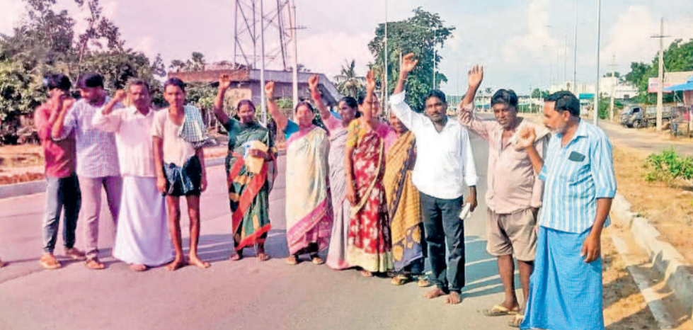
ఏటూరునాగారం : జాతీయ రహదారిపై నిరసన తెలుపుతున్న చిన్నదోయినపల్లి రైతులు