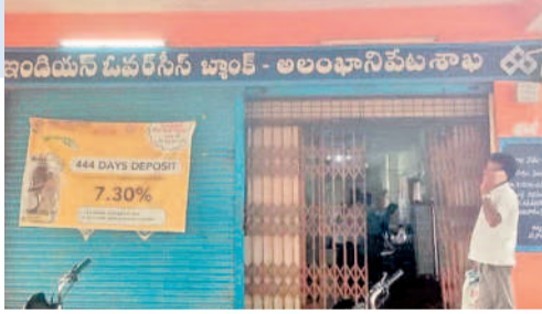
ఇండియన్ ఓపెన్ డిపాజిట్ బ్యాంక్ - అలంకారిపేట శాఖ

నర్సంపేట, ఆగస్టు 17 : రైతు రుణమాఫీ పూర్తి స్థాయిలో చేశామని కాంగ్రెస్ ప్రభుత్వం గొప్పలు చెబుతున్నా. క్షేత్రస్థాయిలో మాత్రం ఆ పరిస్థితి లేదు. వరంగల్ జిల్లా నెక్కొండ మండలం అలంకారిపేట గ్రామం ఇండియన్ ఓపెన్ డిపాజిట్ బ్యాంకు(ఐ.ఓ.ఓ) పరిధిలో అలంకారిపేట, తోప నపెల్లి, బొట్టికొండ, పెద్దకొల్లూరు, రెడ్డానాయక్ తండా గ్రామాలు ఉన్నాయి. ఈ గ్రామాలలోని రైతులు 2018 తర్వాత 1270మంది రుణాలు తీసుకున్నారు. వీరిలో రూ.లక్షలోపు 700 మంది, రూ.లక్షన్నర లోపు 850మంది, రూ.2లక్షల లోపు 170మంది రుణాలు తీసుకున్నారు. వీరిలో ఇప్పటివరకు కేవలం 384మంది రైతులకు మాత్రమే రుణమాఫీ కాగా, 886 మందికి అర్హత ఉన్నా కాలేదు. రూ.లక్ష, రూ.లక్షన్నర లోపు 320