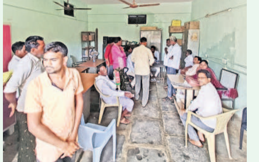
మహాదేవపూర్ వ్యవసాయ కార్యాలయంలో సిబ్బందిపై ఆగ్రహం వ్యక్తం చేస్తున్న రైతులు

■ మహాదేవపూర్ ఓపీఎస్ వద్ద రైతుల ఆందోళన ■ అధికారులు, సిబ్బంది తీరుపై ఆగ్రహం మహాదేవపూర్, ఆగస్టు 17 : ఇయ్యంకల్ భూపాలపల్లి జిల్లా మహాదేవపూర్ మండలంలోని పలువురు రైతులు పంట రుణమాఫీ కాలేదని వ్యవసాయ శాఖ కార్యాలయం వద్ద శనివారం ఆందోళన చేశారు. లిస్టులో తమ పేర్లు ఉన్నాయా? లేదా? తెలియక రెండు రోజులుగా మనోవేదనకు గురవుతున్నారని, ఈ క్రమంలో ఏవో కార్యాలయానికి వచ్చిన రైతులకు రుణమాఫీపై సరైన సమాచారం అందకపోవడంతో పాటు సమాచారం పాటింపకుండా ఇబ్బందులకు గురిచేస్తుండడంతో సిబ్బందిని నిలదీశారు. రైతుల బాధలను పట్టించుకోవడం లేదని, కనీసం సరైన సమాచారం ఇచ్చే పరిస్థితి లేకుండా పోయిందని ఆగ్రహం వ్యక్తం చేశారు. ఇప్పటికైనా ఉన్నతాధికారులు స్పందించి అర్హులైన రైతులకు రుణమాఫీ అయ్యేలా చూడాలని, లాగింగ్ విధుల్లో నిర్లక్ష్యంగా వ్యవహరిస్తున్న అధికారులు, సిబ్బందిపై చర్యలు తీసుకోవాలని వారు డిమాండ్ చేశారు.