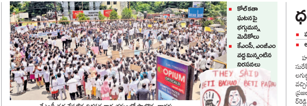
తేలవేటి వద్ద చేపట్టిన నిరసన కార్యక్రమంలో పాల్గొన్న డాక్టర్లు