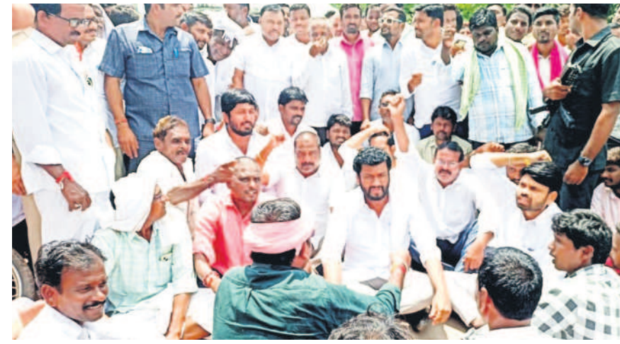
రైతులకు మద్దతుగా జైన్ బోధ్ రోడ్డుపై బయాయింది నిరసన తెలిపిన బోధ్ ఎమ్మెల్యే లలిత్ జాదవ్