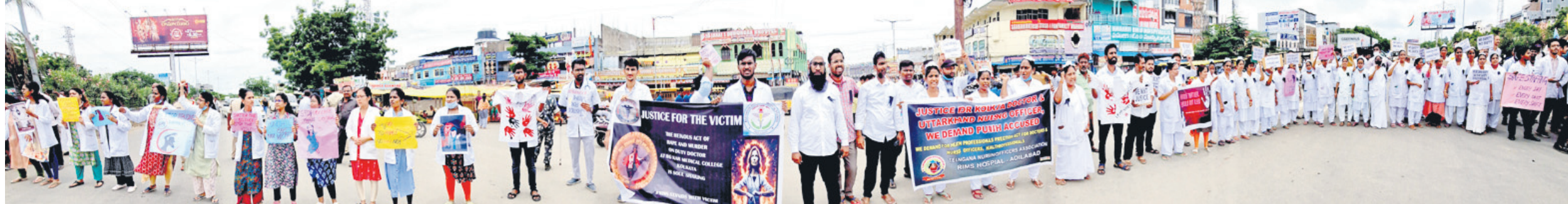
ఆదిలాబాద్ జిల్లాకేంద్రంలోని బస్టాండ్ ఎదుట రాస్తారోకో చేస్తున్న రిమ్మి జూనియర్ వైద్యులు, వైద్యులు