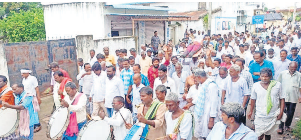
తలమడుగులో ముఖ్యమంత్రి రేవంత్ రెడ్డి దిష్టిబోమ్మతో శవయాత్ర నిర్వహిస్తున్న రైతులు