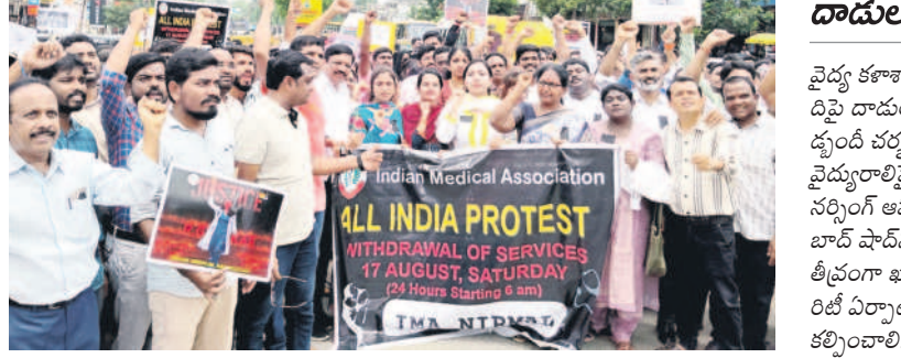
నిర్మల్ లో నిరసన వ్యక్తం చేస్తున్న వైద్యులు

జనప్రియ సీటీ స్పాన్సర్ సెంటర్ నుంచి మంచివ్యాలు చౌరస్తాలోని శివాజీ చౌక్ వరకు నిరసన ర్యాలీ తీశారు. వైద్యులు, కళాకారుల విద్యార్థులను వాహనాలపై ర్యాలీగా వెళ్లి కలెక్టర్ కు, ఎస్పీకి వినతిపత్రాలు ఇచ్చారు. ఐఎంఐ, ఎన్డీఐ, ఐఐఐ, తెలంగాణ డయాగ్నోస్టిక్ అసోసియేషన్, మెడికల్ రిప్రజెంటేటివ్స్ అసోసియేషన్, జన విజ్ఞాన వేదిక, తెరవే, తెలంగాణ జూనియర్ కాలేజీస్ అసోసియేషన్ వివిధ సంస్థల నిరసన లో పాల్గొన్నారు.