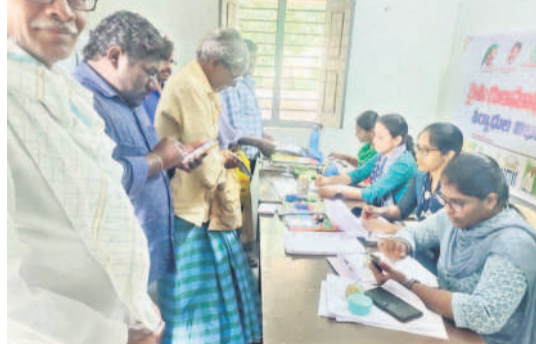
ఇల్లంతకుండు : మండల వ్యవసాయ కార్యాలయంలో దరఖాస్తు చేసుకుంటున్న రుణమాఫీ కార్యక్రమం

ఇల్లంతకుండు, ఆగస్టు 17 : మూడో విడుతలోనూ రుణమాఫీ కాకపోవడంతో రైతులు ఆగ్రహం వ్యక్తం చేస్తున్నారు. వ్యవసాయ కార్యాలయం వద్దకు వెళ్లిన సభ్యులలో తరలివస్తున్నారు. శనివారం ఇల్లంతకుండు వ్యవసాయ కార్యాలయంలో సుమారు 600 మంది దరఖాస్తు చేసుకున్నారు. ఈ విషయాన్ని వ్యవసాయ ప్లీడర్ అధికారులు తెలిపారు. మూడో విడుతలో ₹2 లక్షల రుణమాఫీ కనిపించిన దరఖాస్తు చేసుకున్నారని పేర్కొన్నారు. రైతులు తీసుకున్న రుణం పడ్డీతో కలిపి ₹2 లక్షల పై రుణం ఉన్న వారికి కాలేదని, ప్రభుత్వం నుంచి వచ్చే సమాచారం మేరకు మిగతా రుణమాఫీపై స్పష్టత వస్తుందన్నారు.