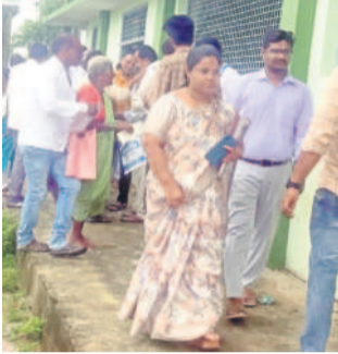
సమావేశం నుంచి వెళ్లిపోతున్న జిల్లా వ్యవసాయాధికారి