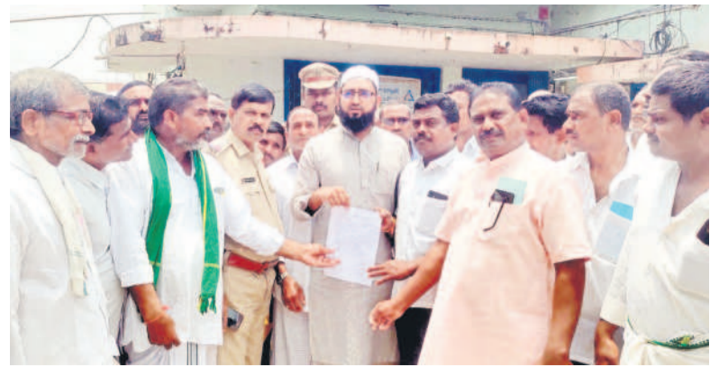
మెట్పల్లి రూరల్: పంట రుణమాఫీ చేయాలని కోరుతూ మెట్పల్లి ఏపీ షాహిద్ అలికి వినతిపత్రం సమర్పిస్తున్న రుణమాఫీ కార్యక్రమం