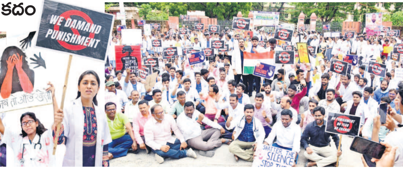
కరీంనగర్ కలెక్టరేట్ ఎదుట ధర్నా చేస్తున్న వైద్యులు, మెడికల్, సిబ్బంది, మెడికల్ రిటలు