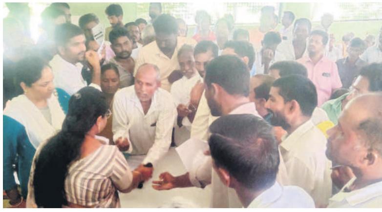
రైతు వేదికలో డీవోపై ప్రశ్నల వర్షం కురిపిస్తున్న రైతులు