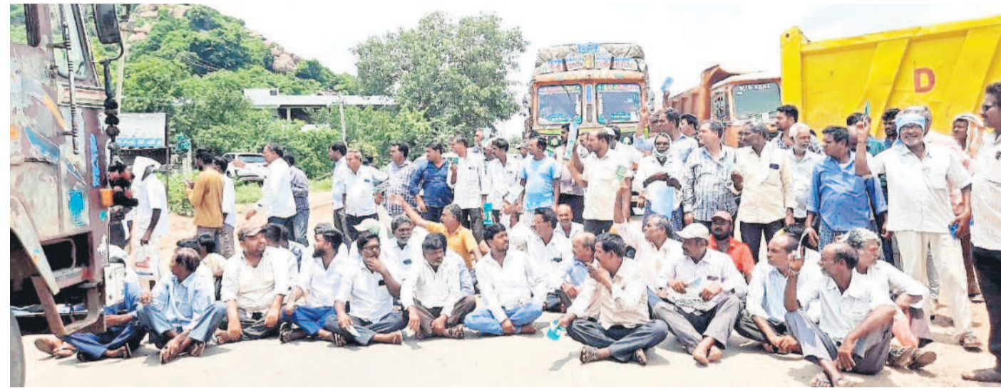
శంకరపట్నం: మొలంగూర్ వద్ద జాతీయ రహదారిపై ధర్నా చేస్తున్న రైతులు