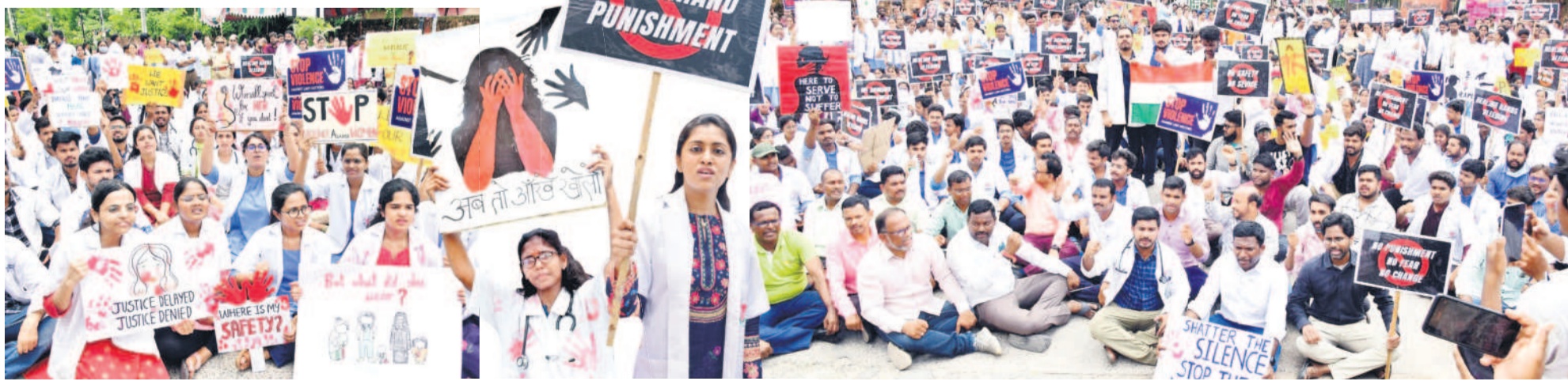
కరీంనగర్ కలెక్టరేట్ ఎదుట ధర్నా చేస్తున్న వైద్యులు, మెడికల్, సిబ్బంది, మెడికల్ రివీలు

కోల్ కతా ఘటనకు నిరసనగా ఉమ్మడి జిల్లా వ్యాప్తంగా ఓపీ సేవలు బండ్ అంతటా ర్యాలీలు కరీంనగర్ కలెక్టరేట్ ఎదుట భారీ ధర్నా