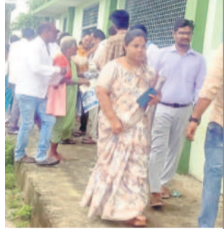
సమావేశం నుంచి వెళ్లిపోతున్న జిల్లా వ్యవసాయాధికారి