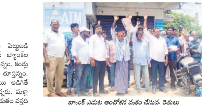
బ్యాంక్ ఎదుట ఆందోళన వ్యక్తం చేస్తున్న రైతులు