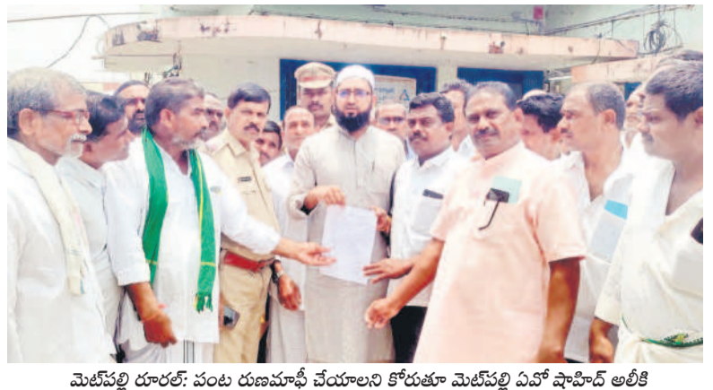
మెట్పల్లి రూరల్: పంట రుణమాఫీ చేయాలని కోరుతూ మెట్పల్లి ఏపీ షాహిద్ అలికి వినతిపత్రం సమర్పిస్తున్న రుణమాఫీ కార్యక్రమం