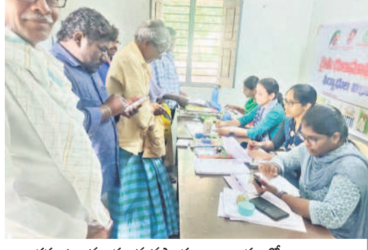
ఇల్లంతకుంట్ల : మండల వ్యవసాయ కార్యాలయంలో దరఖాస్తు చేసుకుంటున్న రుణమాఫీ కార్యక్రమం

ఇల్లంతకుంట్ల, ఆగస్టు 17 : మూడో విడుదలలోనూ రుణమాఫీ కాకపోవడంతో రైతులు ఆగ్రహిస్తున్నారు. వ్యవసాయ కార్యాలయం వద్దకు వెళ్ల సభ్యులలో తరలివస్తున్నారు. శనివారం ఇల్లంతకుంట్ల వ్యవసాయ కార్యాలయంలో సుమారు 600 మంది దరఖాస్తు చేసుకున్నారు. ఈ విషయాన్ని వ్యవసాయ ప్లీడర్ అధికారులు తెలిపారు. మూడో విడుదలలో ₹2 లక్షల రుణమాఫీ కనిపించు చేసుకున్నారని పేర్కొన్నారు. రైతులు తీసుకున్న రుణం పట్టికలో కలిపి ₹2 లక్షల పై రుణం ఉన్న వారికి కాలేదని, ప్రభుత్వం నుంచి వచ్చే సమాచారం మేరకు మిగతా రుణమాఫీపై స్పష్టత వస్తుందన్నారు.