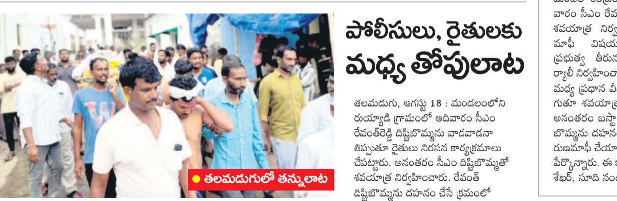
రుయ్యాడి గ్రామంలో సీఎం దిష్టిబొమ్మతో శవ యాత్ర నిర్వహిస్తున్న రైతులు

రైతు రణమాఫీ విషయంలో కాంగ్రెస్ ప్రభుత్వం మోసం చేసినందుకూ ఆదిలాబాద్ జిల్లా వ్యాప్తంగా రెండో రోజున ఆదివారం రైతులు ఆందోళనలు కొనసాగించారు. ముఖ్యమంత్రి రేవంత్ రెడ్డి ఎన్నికల సమయంలో హామీ ఇచ్చి ఎనిమిది నెలలు తర్వాత చేతులెత్తడంపై నిరసన ప్రదర్శనలు చేపట్టారు. ఆదిలాబాద్ జిల్లాలోని బజార్ హత్నూర్ మండలం కేంద్రంలోపాటు తలమడుగు మండలంలోని రుయ్యాడి, బేల మండలంలోని సిద్దిపేట, బీంపూర్ మండలంలోని పిప్పల్ కోటి గ్రామాల్లో రైతులు కాంగ్రెస్ ప్రభుత్వం మాఫీని అందగడుతూ నిరసన కార్యక్రమాలు నిర్వహించారు. బజార్ హత్నూర్ మండలం కేంద్రంలోపాటు తలమడుగు మండలం రుయ్యాడిలో ముఖ్యమంత్రి రేవంత్ రెడ్డి దిష్టిబొమ్మతో శవయాత్ర నిర్వహించారు. అనంతరం సీఎం రేవంత్ దిష్టిబొమ్మను దహనం చేశారు. బేల మండలం నిర్వహణ, బీంపూర్ మండలం పిప్పల్ కోటిలో రైతులు రాస్తారోకో నిర్వహించారు. కాంగ్రెస్ ప్రభుత్వానికి ముఖ్యమంత్రి రేవంత్ రెడ్డికి వ్యతిరేకంగా నిరాదాన చేశారు. ఎలాంటి షరతులు లేకుండా డిమాండ్ చేశారు. బ్యాంకు రుణం రద్దు అయ్యేంత వరకు తమ ఆందోళనలు కొనసాగతామని హెచ్చరించారు.