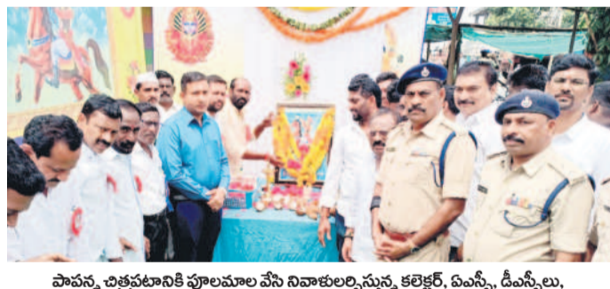
పాపన్న చిత్రపటానికి పూలమాల వేసి నివాళులర్పిస్తున్న కలెక్టర్, ఏసీసీ, డీఎస్సీలు, జీసీ సంతోషం, గౌడ సంఘం నాయకులు