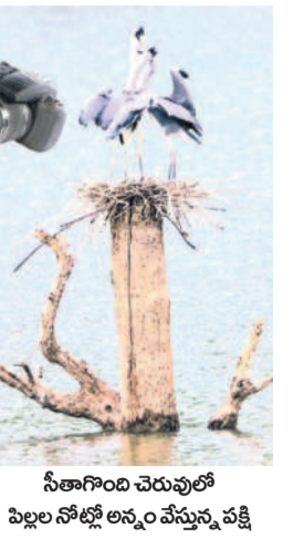
సీతాగింది చెరువులో పిల్లల నోట్లో అన్నం వేస్తున్న పక్షి