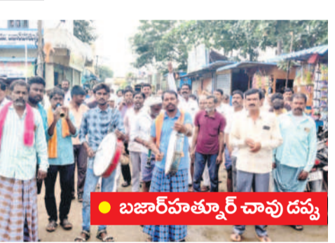
బజార్ హత్నూర్ శవయాత్ర నిర్వహిస్తున్న రైతులు