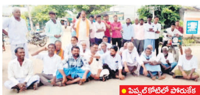
పిప్పల్ కోటిలో పోరుకేక