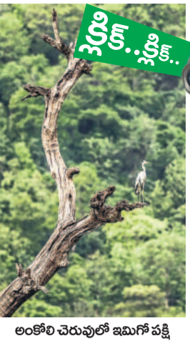
లంబో చెరువులో ఇమిగో పక్షి

నేడు ప్రపంచ ఫోటోగ్రఫీ దినోత్సవం ఒక్క ఫోటో వేల భావాలను తెలుపుతుంది. అటువంటి గొప్పదనం ఒక్క చాయా చిత్రానికి మాత్రమే ఉంది. ఈ ఆధునిక కాలంలో మానవ జీవనానికి, ఫోటోగ్రఫీకి విడదీయలేని బంధం ఉంది. రెండు గ్రీకు చదవల కలయికే ఫోటోగ్రఫీ. ఫోటో లంబో చిత్రం, గ్రీకు లంబో గ్రీకుడని అని అర్థం. ఫోటోగ్రఫీ లంబో కాంతిలో చిత్రాన్ని గీయడం. 18వ శతాబ్దంలో ఫ్రాన్స్ లో నలుపు తెలుపుతో ప్రారంభమైన ఫోటోగ్రఫీ కాలక్రమంలో రంగులు అద్భుతంగా కొత్త పుంతలు తొక్కుతోంది. మన దేశంలో ఇంటర్నెట్ ఫోటోగ్రఫీ క్రాంతి 1991 నుంచి దేశంలో ప్రతి యేటా ఆగస్టు 19వ తేదీన ఫోటోగ్రఫీ దినోత్సవాన్ని జరపడం ప్రారంభించారు.