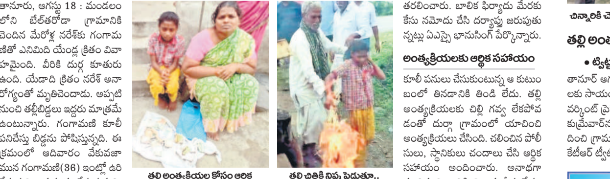
తల్లి అంత్యక్రియల కోసం అర్హత ఉన్నా కాలేదు..

● తల్లిదండ్రుల మృతితో అనాథగా మారిన బాలిక ● ఇక్కడే అంత్యక్రియలు నిర్వహించిన అమ్మాయి ● బాలికను ఆదుకోవాలని వేడుకుంటున్న స్థానికులు