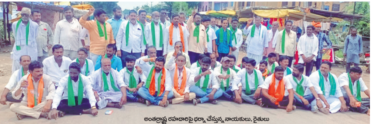
అంతర్జాతీయ రహదారిపై ధర్మా చేస్తున్న నాయకులు, రైతులు