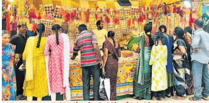
అమనగల్లూలో రాబీలు కొనుగోలు చేస్తున్న మహిళలు

పౌరమి రోజు సోదర సోదరీమణులు అత్యంత పవిత్రంగా వారి బాంధవ్యం కల కాలం నిలవాలని జరుపుకొనే పండుగ ఇది. జీవితాంతం తోడుంటానని భరోసా ఇచ్చేది రాబీ పండుగ. పురాణాల్లో కూడా రాబీ పండుగకు ఎంతో విశిష్టత ఉన్నది. సమాజంలో మానవతా విలువలను మంటగలుపుతున్న జుర్రుకోవాలని అవసరం ఎంతైనా ఉన్నది. మానవ సంబంధాలను మెరుగుపర్చడానికి ఈ పండుగ ఎంతో దోహదం చేస్తుంది. రక్షా పండుగను పుట్టిన సోదర సోదరీమణులతో పండుగ జరుపుకోవాలని ఏమీలేదు. ఏ బంధుత్వమన్నా లేకపోయినా సోదరుడు, సోదరి అన్న భావం ఉన్న ప్రతిఒక్కరూ రక్షా బంధనాన్ని కట్టే వారి క్షేమాన్ని కొరవకోవద్దు. అత్యున్నత మద్దతు అనుబంధాలకు, ఇతర ముఖ్యమైన సర్వసహకారానికి విస్తారంగా రక్షా బంధన పండుగ నిలుస్తుంది. సోదరులకు ఎప్పుడూ రాబీ కడుదామని సోదరీమణులు వేయి కళ్లతో ఎదురు చూస్తుంటారు. రాబీ పండుగ రోజు ఉదయాన్నే తలసానం చేసి