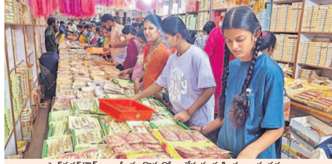
షాద్ నగర్లో రాబీలు కొనుగోలు చేస్తున్న మహిళలు, యువతులు

కొత్త బట్టలు ధరించి రాబీ కట్టడానికి సిద్ధమవుతారు. సోదరులకు రాబీలు కట్టి స్వీట్లు తిని పిండి అక్షతలు వేసి నివ్వారు. సోదరులు సంవత్సరం పాటు కనుకలు ఇస్తుంటారు. అందుకే ఈ రాబీ పండుగను ప్రీయమైన వారితో ముగించాడు జరుపుకొందాం.