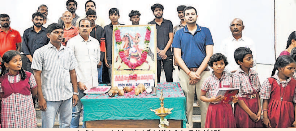
సర్దార్ సర్కారు పాపన్న బంధులతో పాల్గొన్న కల్వర్స ప్రతీకజైన్

ఇప్పటికే రక్షాబంధన సందర్భంగా మార్కెట్లో బోలెడన్ని రాబీలు దర్శనమిస్తున్నాయి. సరికొత్త డిజైన్లతో, రకరకాల రంగులతో, బంగారం, వెండి రాబీలతో కళకళలాడుతున్నాయి. సోదరుల పేర్లతో కూడా రాబీలు తయారు చేయించుకుంటున్నారు. రాబీలు కొనడానికి మహిళలు పెద్దఎత్తున దుకాణాలకు తరలివస్తున్నారు. రోడ్డు, రాబీలు అమ్మే దుకాణాలు, స్వీట్ల హాల్లులు కిటుకిలాడుతున్నాయి. పదిహేను రోజుల వరకు రాబీలు కట్టే సందడి గ్రామాల్లో కొనసాగుతుంది.