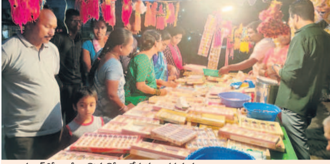
కడూర్లో రాబీలు కొనుగోలు చేస్తున్న ఆడపడుచులు

పౌరమి రోజు సోదర సోదరీమణులు అత్యంత పవిత్రంగా వారి బాంధవ్యం కల కాలం నిలవాలని జరుపుకొనే పండుగ ఇది. జీవితాంతం తోడుంటానని భరోసా ఇచ్చేది రాబీ పండుగ. పురాణాల్లో కూడా రాబీ పండుగకు ఎంతో విశిష్టత ఉన్నది. సమాజంలో మానవతా విలువలను మంటగలుపుతున్న జుర్రుకోవాలని అవసరం ఎంతైనా ఉన్నది. మానవ సంబంధాలను మెరుగుపర్చడానికి ఈ పండుగ ఎంతో దోహదం చేస్తుంది. రక్షా పండుగను పుట్టిన సోదర సోదరీమణులతో పండుగ జరుపుకోవాలని ఏమీలేదు. ఏ బంధుత్వమన్నా లేకపోయినా సోదరుడు, సోదరి అన్న భావం ఉన్న ప్రతిఒక్కరూ రక్షా బంధనాన్ని కట్టే వారి క్షేమాన్ని కొరవకోవద్దు. అత్యున్నత మద్దతు అనుబంధాలకు, ఇతర ముఖ్యమైన సర్వసహకారానికి విస్తారంగా రక్షా బంధన పండుగ నిలుస్తుంది. సోదరులకు ఎప్పుడూ రాబీ కడుదామని సోదరీమణులు వేయి కళ్లతో ఎదురు చూస్తుంటారు. రాబీ పండుగ రోజు ఉదయాన్నే తలసానం చేసి