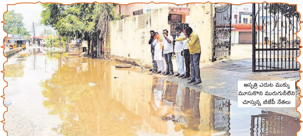
ఆస్పత్రి ఎదురు ముక్కు మారుకొని మురుగునీటిని చూస్తున్న బీజేపీ నేతలు