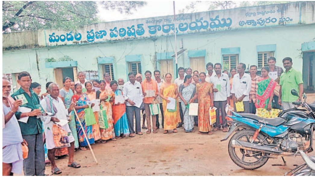
భద్రాద్రి కొత్తగూడెం జిల్లా అక్కాపూరు మండల కేంద్రంలో తమకు రుణమాఫీ వర్ధిల్లాలని కోరుతూ అధికారులకు ఫిర్యాదు చేయడానికి వచ్చిన వివిధ గ్రామాల ప్రజలు. పండుగ ఉన్నా 200మందికి పైగా రైతులు ఏవో ఫిర్యాదులు చేశారు.