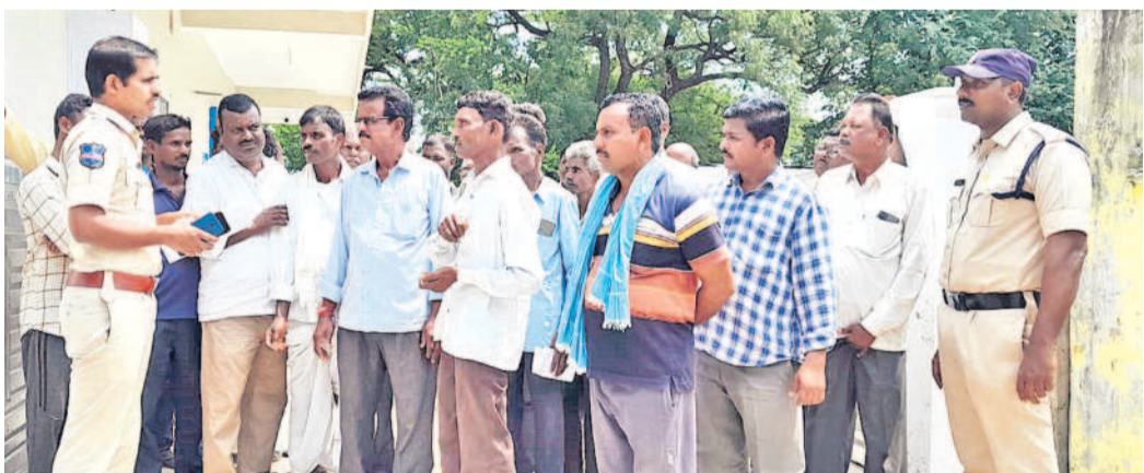
నిజామాబాద్ జిల్లా ఎడపల్లి మండలం మంగళవారిలోని సిండికేట్ బ్యాంకు ఎదుట రైతులు రుణమాఫీ చేయమని నిరసనగా అందోళన చేపట్టారు. పోలీసులు వారిని వినకుండా రుణమాఫీ చేయాలిందంటూ పట్టుబట్టారు.