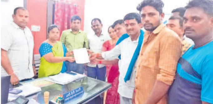
రూ.2 లక్షల లోపు రుణమాఫీ వర్ధిల్లాలని కోరుతూ జగిత్యాల జిల్లా వ్యవసాయాధికారి వాణికి వినతిపత్రం ఇస్తున్న మల్లాపూర్ గ్రామ రైతులు