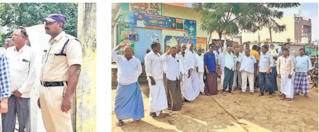
తమకు రుణమాఫీ కాలేదని అదిలాబాద్ జిల్లా బోధ మండలం ధన్నూరు (బి) గ్రామంలో రైతులు నిరసన ప్రదర్శన చేశారు. ప్రభుత్వ వైఖరిని నిరసించారు.