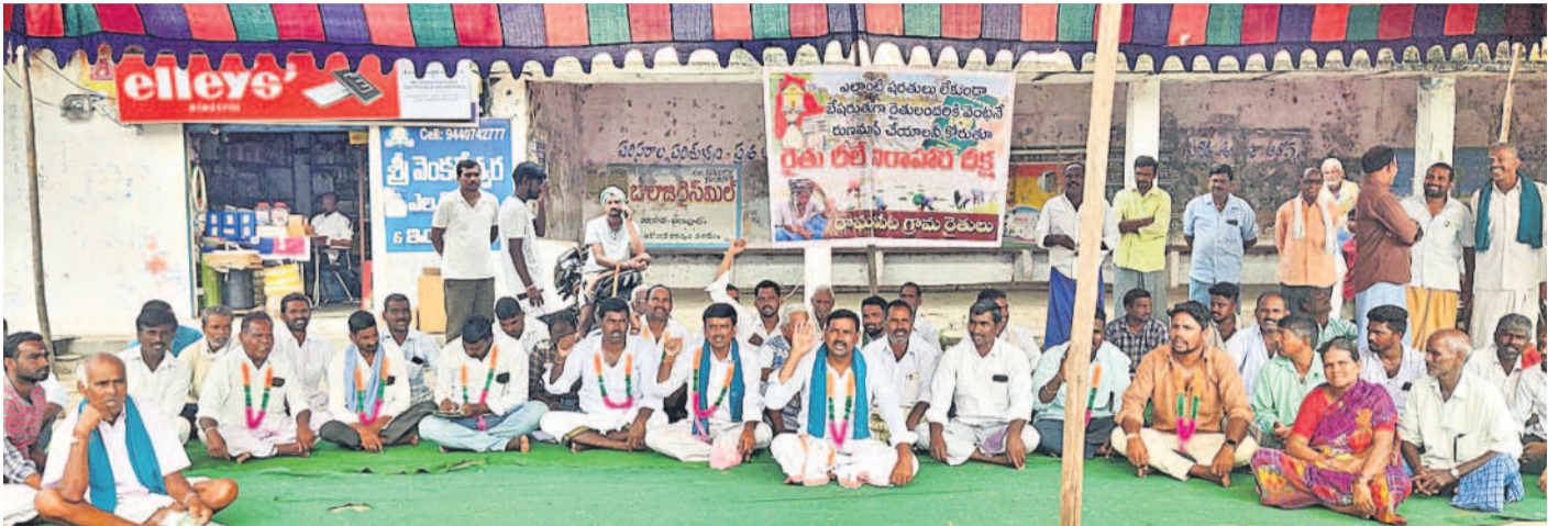
జగిత్యాల జిల్లా మల్లాపూర్ మండలం రామవేటలో లిలే నిరాహారదీక్ష చేస్తున్న రైతులు. 400 మందికి రుణమాఫీ కాలేదని రైతులు తెలిపారు. నెలరోజుల్లోగా రుణమాఫీ వర్ధిల్లాలని చర్యలు తీసుకుంటామని ఏడీఏ రైతులకు హామీ ఇచ్చారు.