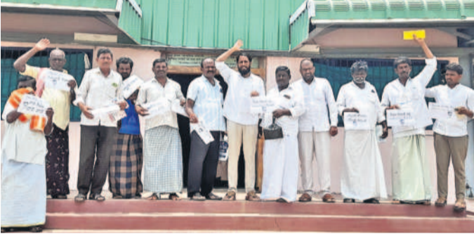
బోగోళాంబ గద్వాల జిల్లా అయిజ వ్యవసాయ మార్కెట్ అవరణలోని రైతువేదిక వద్ద జీఆర్‌ఎస్సీ అధ్యక్షులలో నిరసన వ్యక్తం చేస్తున్న రైతులు