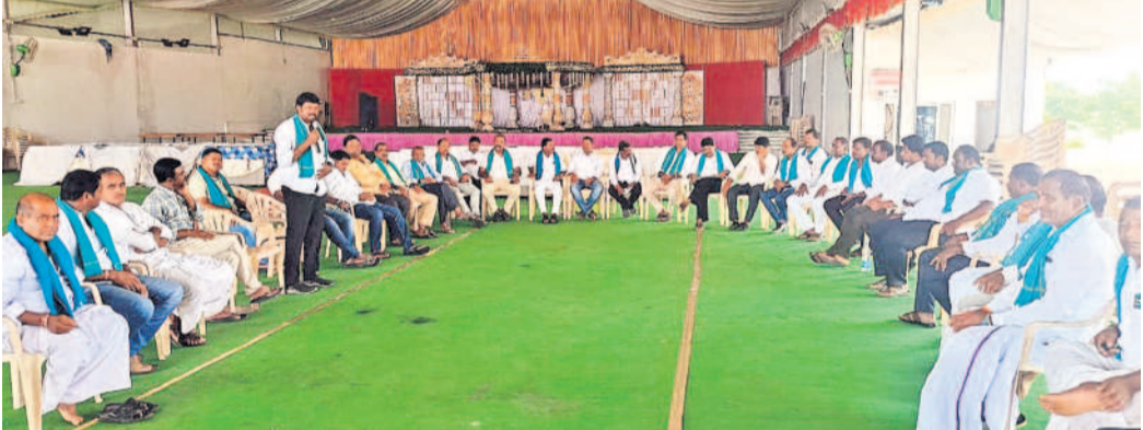
నిజామాబాద్ జిల్లా జక్రాన్‌పల్లి మండలం అర్హుల శివారులోని ఓ ఫంక్షన్ హాలులో రైతులు సమావేశమయ్యారు. ఆర్కాడ, బాల్కొండ, నిజామాబాద్ రూరల్ అసెంబ్లీ నియోజకవర్గాల రైతులు పాల్గొని, రుణమాఫీ కోసం ఐక్యపోరాటం చేయాలని నిర్ణయించుకున్నారు.