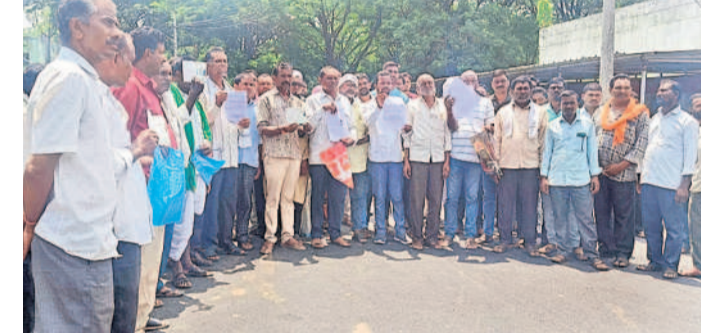
అదిలాబాద్ జిల్లా కేంద్రంలోని కలెక్టరేట్ కార్యాలయంలో సోమవారం జరిగిన ప్రజా వాణికి ఇండ్రెస్ట్ మండల రైతులు పెద్దపెట్టు తరలివచ్చి వినతిపత్రాలు అందజేశారు.