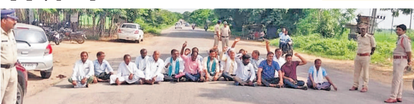
నిజామాబాద్ జిల్లా పల్వోలిలోని నందిపేట-నిజామాబాద్ ప్రధాన రహదారిపై రాస్తారోకో చేస్తున్న నందిపేట మండలం వెల్లుల్ గ్రామ పల్వోలి రైతులు. ఈ సందర్భంగా తమకు రుణమాఫీ వర్ధిల్లాలని ప్రభుత్వాన్ని డిమాండ్ చేస్తూ నిరసించారు. రుణమాఫీ చేయని ప్రభుత్వ వైఖరిని నిరసించారు.