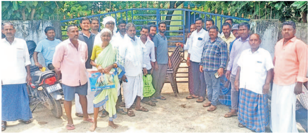
నిజామాబాద్ జిల్లా పాల్వోలి కార్యాలయం గేటుకు తాళం వేసి రైతులు నిరసన తెలిపారు. పంట రుణాలు మాఫీ చేయాలని కోరుతూ, ప్రభుత్వ నిర్లక్ష్యాన్ని నిరసనగా రైతులు పెద్దపెట్టున నిరసనలు చేశారు.