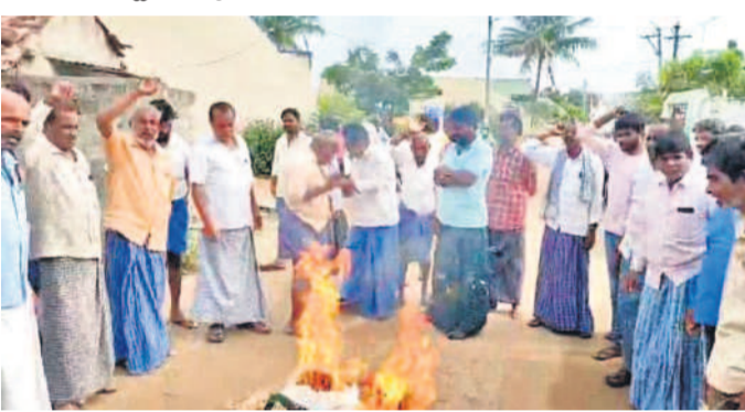
సిద్దిపేట జిల్లా అక్కాపూరులో సీఎం రేవంత్‌రెడ్డి దిష్టిబొమ్మకు శవయాత్ర నిర్వహించారు. అనంతరం సీఎం డౌన్‌డౌన్ అంటూ నినదిస్తూ దిష్టిబొమ్మను దహనం చేశారు.