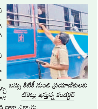
బస్సు కిటికీ నుంచి ప్రయాణికులకు టికెట్లు ఇచ్చే కండక్టర్

ఏటా చూడగలగ, ఆగస్టు 19 : సాధారణంగా బస్సు కండక్టర్ సీట్ల వద్దే వచ్చి ప్రయాణికులకు టికెట్లు ఇస్తారు. కానీ సోమవారం ఏటా చూడగలగ బస్సుల వద్ద వచ్చిన బస్సు వచ్చినట్లు నిండిపోతుండడంతో ఓ కండక్టర్ చివరే లేక బస్సు బయటి నుంచే టికెట్ ఇవ్వాలి వచ్చింది. లోపలికి కొంచెం వెళ్లి సాహసం చేయలేక ఇలా బస్సు చుట్టూ తిరిగి కిటికీల నుంచే టికెట్ ఇవ్వడం కనిపించింది. ఏటా చూడగలగ, కన్నాయిగూడెం, వాణిడు, వెంకటాపురం, మంగళం మండలాల ప్రజలకు ఏటా చూడగలగం మొయిన సెంటర్ కావడంతో రాబీ కట్టేందుకు వచ్చి వెళ్తున్న మహిళలతో బస్ స్టేషన్ కిటకిటలాడింది. ప్రమాదమని తెలిసినా చేసేదేమీలేక బస్సులో 150 మంది దాకా ఎక్కారు.